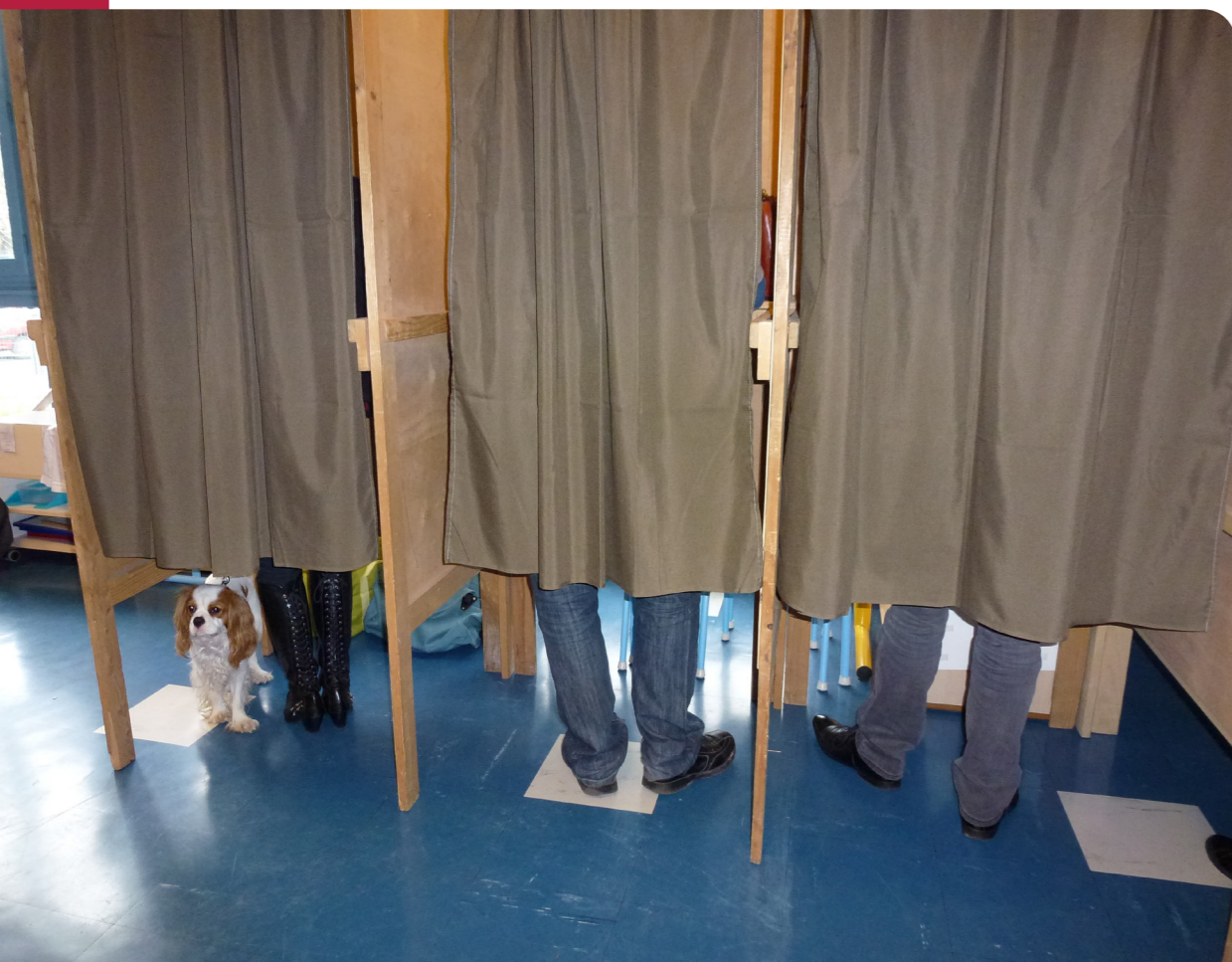
Des isoaloirs à Saint Etienne.