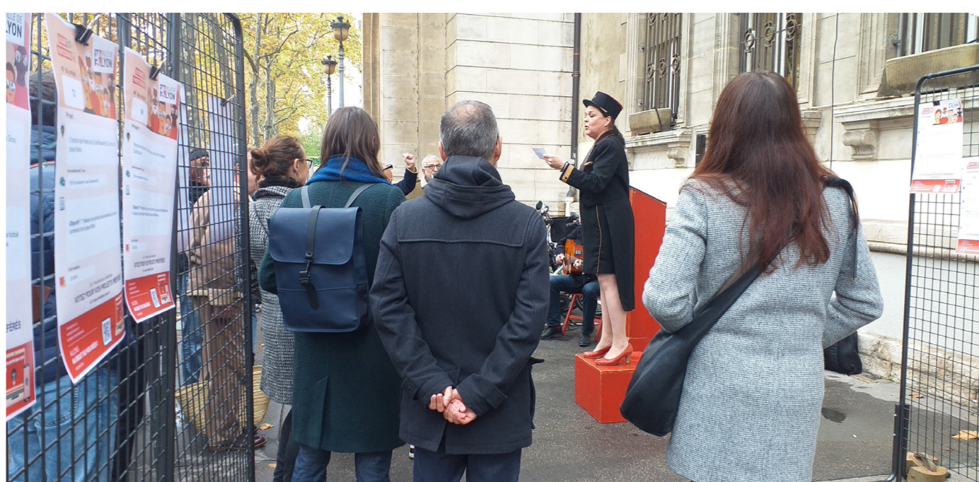
La crieeuse publique à la mairie du 4ème arrondissement de Lyon pour les budgets participatifs.

Ce projet mobilise une équipe de chercheurs en économie et en théorie du choix social computationnel, mais aussi des acteurs publics locaux comme la Municipalité de Lyon (mission démocratie ouverte) sur les budgets participatifs, des lieux d'expérimentation comme Le Dôme (centre régional de culture scientifique à Caen labellisé SAPS en 2021) et enfin des citoyens qui participent à nos expériences.