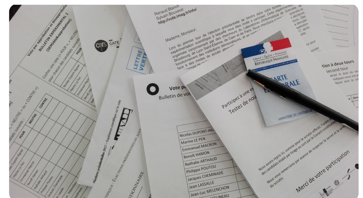
Des bulletins de vote d'une expérience électorale.