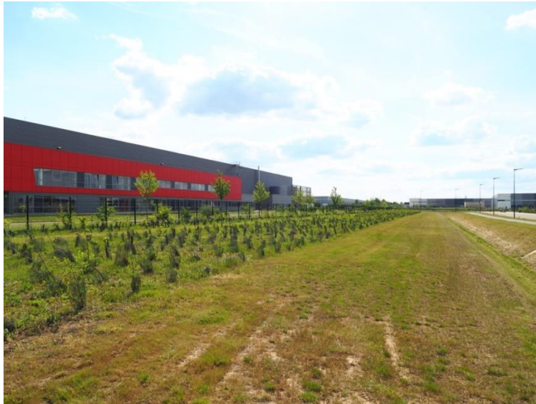
Figure 4.1. Paysage de zone logistique (parc de l'A5 à Réau, 77)

logistiques est d'environ 8 000 €/m 2 dans la ville de Paris, 5 500 €/m 2 dans la petite couronne et 1 350 €/m 2 dans la grande couronne 8 .