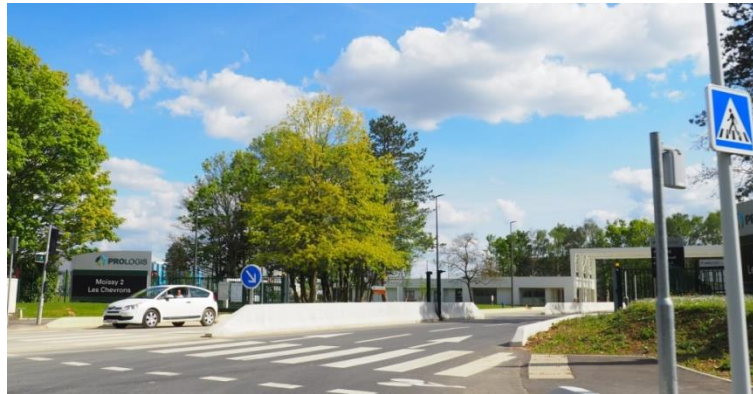
Figure 4.3. Entrée du parc logistique Prologis « Moissy 2 Les Chevrons » à Moissy-Cramayel (77)

De tels parcs logistiques se sont ainsi multipliés sur le front d'urbanisation de bien des métropoles dans le monde : à Paris (Raimbault 2022), à Berlin (Hesse 2008), à Francfort (Barbier et al. 2019), dans la Bay Area (Hesse 2008), à Atlanta (Dablanc et Ross 2012), mais aussi, par exemple, à Mexico (David et Halbert 2014) et à Sao Paulo (Magnani et Sanfelici 2021 ; Yassu 2021).