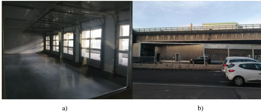
Figure 4.5. ELU « P4 Pantin Logistique » (Paris 19 e ) sous le périphérique ; a) zone de groupage/dégroupage des marchandises, b) vue extérieure du bâtiment

Aujourd’hui, le parc immobilier de la logistique urbaine en Île-de-France représente 5 % de la surface totale des entrepôts de la région. L’engouement récent pour la logistique urbaine n’en fait donc pas une tendance dominante sur le marché immobilier logistique qui reste majoritairement déployé dans les grandes périphéries (Heitz 2021). Le prix du foncier, et donc les loyers élevés dans les espaces denses, constitue un frein au développement d’immobilier pour la logistique urbaine, comparativement aux faibles loyers proposés dans les zones logistiques périphériques. Outre le coût du foncier, les coûts de production des ELU, qui ne sont pas des bâtiments standardisés comme les entrepôts de la périphérie, mais réalisés « sur mesure » pour pouvoir s’intégrer dans un tissu urbain dense, sont plus importants. Cette situation peut expliquer la réticence des promoteurs immobiliers et des investisseurs privés à investir dans les centres urbains jusqu’à très récemment. En l’absence d’investissements privés, les acteurs publics ont tenté de développer une première offre immobilière dès la fin des années 1990. Pendant près de trente ans, la logistique urbaine a fait l’objet d’expérimentations publiques (Debie et Heitz 2017). Il aura fallu attendre une période récente pour voir émerger de ces expérimentations, un urbanisme logistique et un marché immobilier naissant.