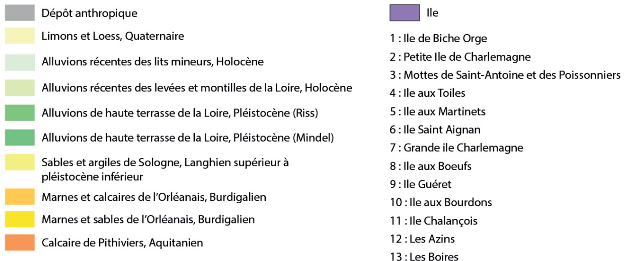
Fig. 1 : Plan des îles de Loire au niveau d'Orléans au Moyen Age (fond de plan Sébastien Jesset d'après Alexandre Audebert, article cit. ).

et les différents droits de justice qui y sont appliqués. S'agit-il de celui vu précédemment par Michel de la Fournière qu'il a consacré essentiellement à l'Île Charlemagne ? (DE LA FOURNIÈRE 1986). La redécouverte de plusieurs documents sur les possessions de l'abbaye Saint-Aignan, sur celles de la Madeleine et leur confrontation aux comptabilités duciales permettent d'apporter quelques compléments juridiques et économiques sur la connaissance de ces îles. Dans cette énumération, les juristes de Saint-Aignan n'ont pas tenu compte de l'évolution et de la mouvance de certaines îles, parfois disparues, parfois regroupées, mais de la situation de ces îles à un moment donné de l'histoire du fleuve.