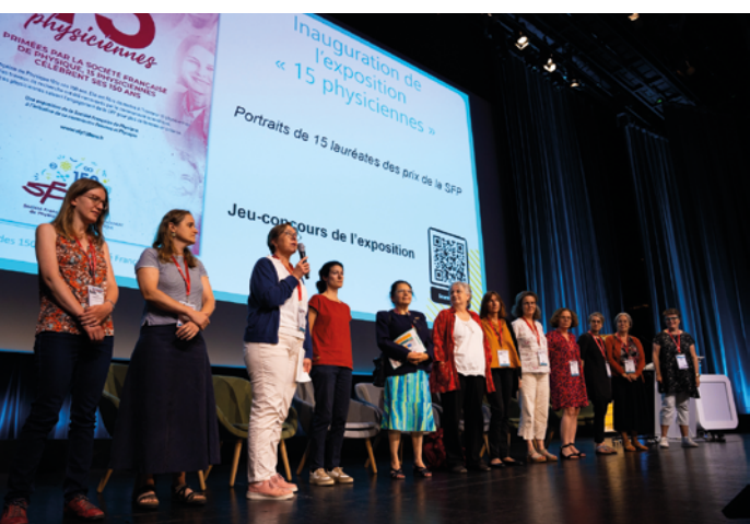
1. Ouverture du congrès dans le grand amphithéâtre Gaston Berger de la Cité des sciences et de l'industrie.