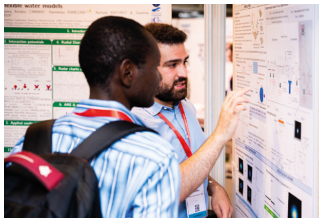
3. Une session poster.