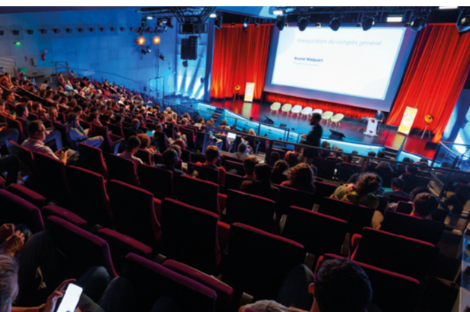
1. Ouverture du congrès dans le grand amphithéâtre Gaston Berger de la Cité des sciences et de l'industrie.

Le 26 e Congrès général de la Société Française de Physique, congrès exceptionnel pour fêter ses 150 ans, s'est déroulé du lundi 3 au vendredi 7 juillet 2023 au Centre des Congrès de la Cité des sciences et de l'industrie à Paris (fig. 1).