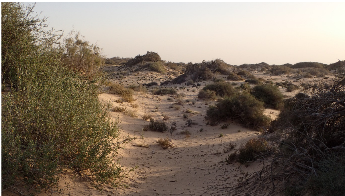
Figure 3. Habitat de Glycia rufolimbata Maindron, 1905.

La biologie de Glycia rufolimbata semble mal connue. Il s'agit probablement d'une espèce qui passe les heures les plus chaudes de la journée enfouie dans le sable des dunes mais vole au crépuscule. En ce qui concerne l'espèce de Glycia récemment décrite, G. socotrana , Felix (2017) note : « All specimens were collected at light in various habitats, like sand dunes ». Cette remarque doit pouvoir s'appliquer aussi à Glycia rufolimbata .