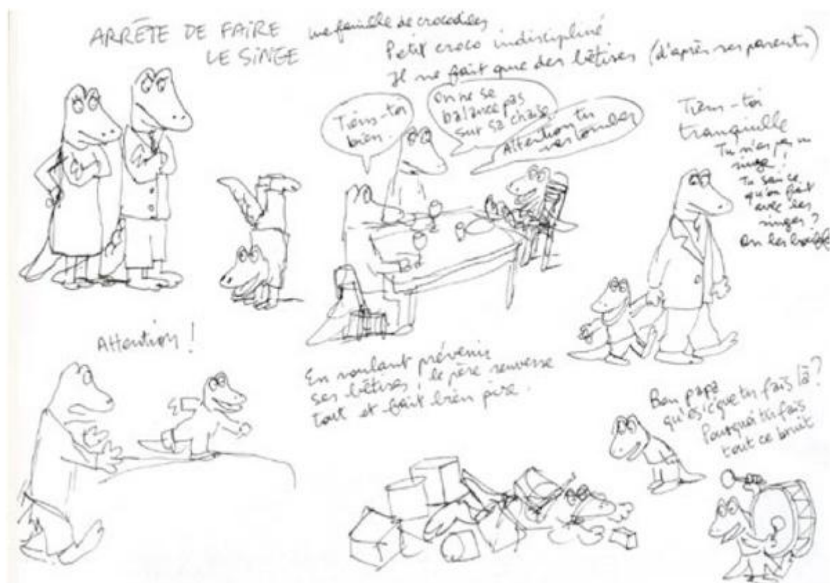
Figure 6. Esquisse préparatoire de l'album Arrête de faire le singe ! . © Mario Ramos.