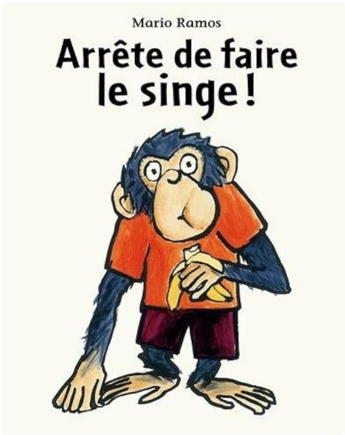
Figure 5. Mario Ramos, Arrête de faire le singe ! , [2010] 2013. © L'école des loisirs.

Le titre, Arrête de faire le singe ! , renvoie à une expression très largement répandue dans le discours parental. Cette expression, figée, est difficilement glosable : « arrête de faire le pitre » recourt à une nouvelle métaphore, et « faire le singe » n'est pas tout à fait « faire des farces ». Partant du constat de la très forte lexicalisation du mot « singe », un article de Philippe Planchon (2008) analyse un