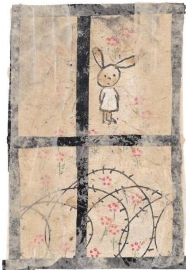
Figure 7. Elzbieta, Flon-Flon et Musette , 1998, p. 13. © L'école des loisirs.

Plus loin, une autre métaphore repose sur une autre répartition entre langage textuel et langage iconique. La « guerre » ( N_1 ) est en effet désignée sur la page de gauche, tandis que le dessin en regard (fig. 8) – le seul de l'album à ne pas s'inscrire dans le cadre de la fenêtre – représente une allégorie de celle-ci ( N_2 ), au sens visuel du terme, soit la personnification d'une idée abstraite : « La guerre était trop grande. Elle n'écoutait personne. On l'entendait aller et venir. Elle faisait un bruit immense. Elle allumait de grands feux. Elle cassait tout... » La métaphore est présente dans le texte, mais de manière implicite. En effet, la guerre est placée en position de sujet de verbes de perception et d'action qui nécessitent un agent animé, elle se trouve donc personnifiée. L'image a alors pour fonction d'explicitier ce que le texte peut avoir d'implicite en représentant la guerre sous les traits d'un agent animé.