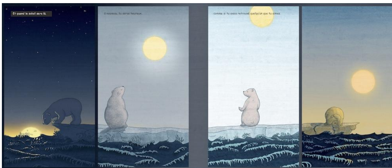
Figure 3. Rosie Eve, Demain il fera beau , 2018. © Saltimbanque.

L'enchaînement des quatre images crée une séquence narrative qui dessine la courbe du soleil dans le ciel, telle qu'elle est perçue depuis le référentiel-Terre dans l'expérience quotidienne des êtres humains. L'ourson semble suivre cette courbe, dans une attitude qui indique le passage de l'espoir à la tristesse. Si dans la première image il semble guetter l'apparition du soleil au-dessus de la surface de l'eau, il s'en détourne et s'en cache dans la dernière, comme si la chute du soleil constituait une menace : l'absence de texte, dans cette dernière vignette, semble accentuer le sentiment de dérégulation.