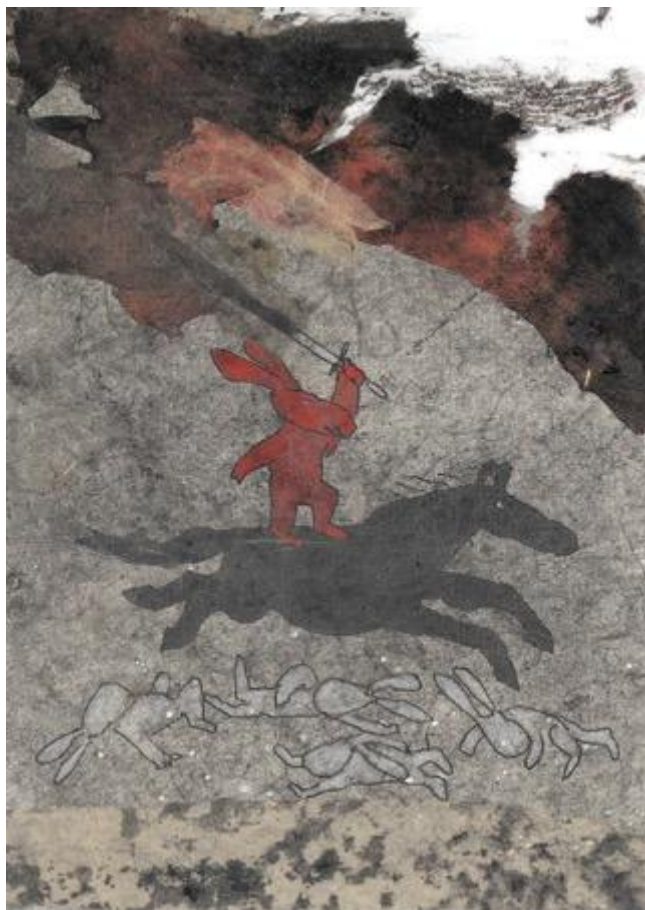
Figure 8. Elzbieta, Flon-Flon et Musette , 1998, p. 19. © L'école des loisirs.

L'image vient illustrer le texte, qui en retour précise l'image. Le dispositif iconotextuel semble pensé pour permettre la saisie globale du sens. Néanmoins, le langage de l'image est tout aussi conventionnel que le langage textuel : le jeu des couleurs – rouge et noir pour la guerre, blanc pour les lapins tués –, l'utilisation d'une épée brandie, arme symbolique qui n'est plus en usage dans les conflits modernes, renvoient à des codes culturels dont la compréhension est rendue possible par la saisie globale de l'illustration et par le contraste qui se dégage entre la violence verticale de la guerre et la fragilité de ses victimes couchées au sol. Le recours à l'image n'est pas seulement un procédé d'illustration ou d'explicitation des implicites textuels. C'est bien ici le modèle interactionniste qui semble le plus efficace pour comprendre la complémentarité entre texte et images. La présence de l'allégorie de la guerre, représentée sans le filtre de la fenêtre, ne peut s'expliquer par le désir d'euphémiser le réel. L'image est d'une grande violence, comme le texte qui l'accompagne. Elzbieta ne cherche pas, dans cette double page, à atténuer la réalité de l'expérience.