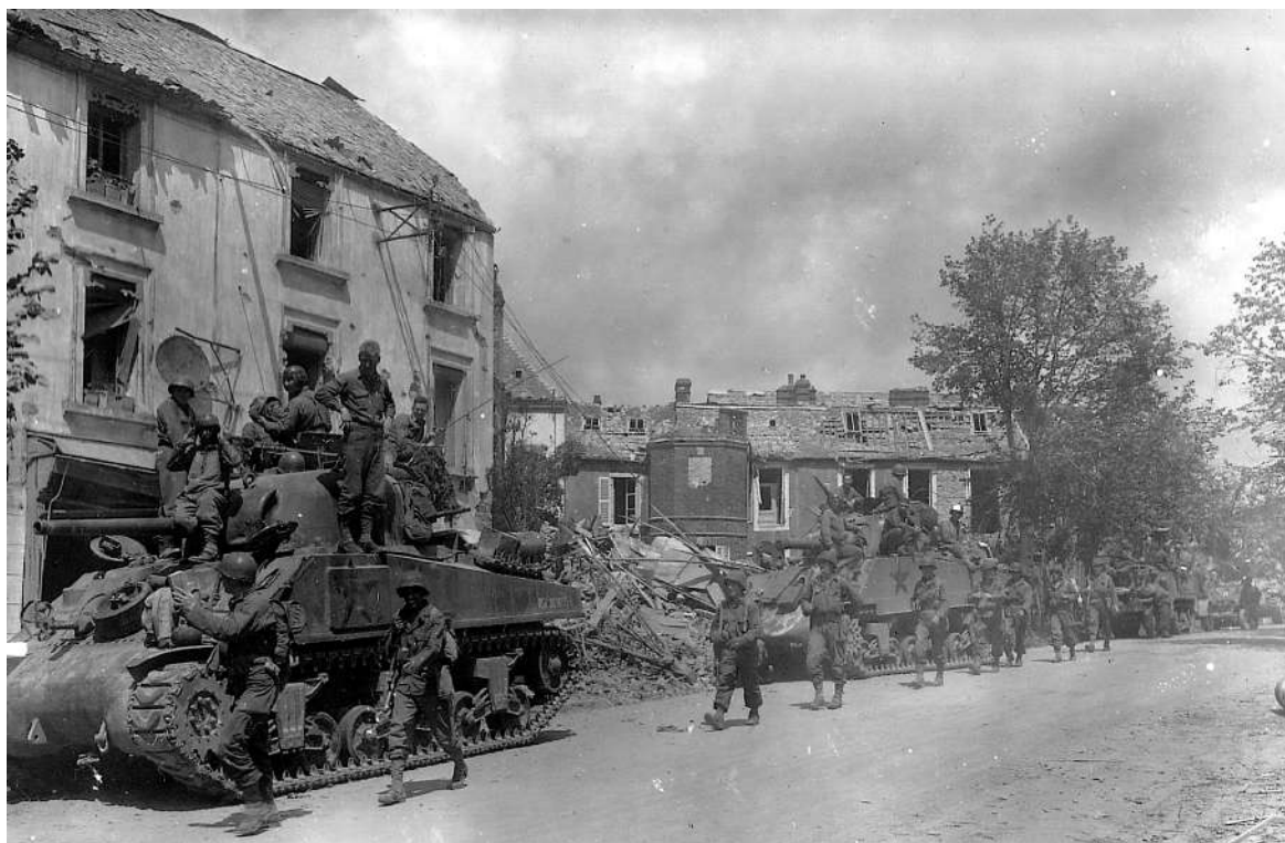
Les Américains traversant Coutances lors de l'opération Cobra, juillet 1944

Bradley conçut alors la manœuvre, restée dans l'histoire sous le nom d'opération Cobra, qui allait lui permettre de percer le front du Cotentin. Il s'agissait d'écraser sous un tapis de bombes une mince bande du front, de 7 km de largeur et de 3 km de profondeur, avant de l'ouvrir à l'assaut de l'infanterie et des chars. Le 26 juillet au matin, plus de 2000 bombardiers se mirent en action et les troupes qui s'avancèrent ensuite trouvèrent un champ de ruines et des défenseurs hébétés, hors de combat pour beaucoup, incapables d'opposer une réelle résistance. Le 28 juillet, Coutances, sur la côte ouest du Cotentin, était libéré, et le 31 juillet, c'était au tour d'Avranches : les Américains s'étaient rendus maîtres de tout le Cotentin.