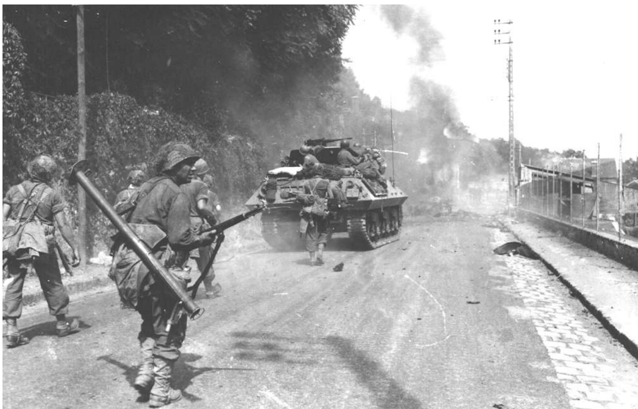
L'arrivée des Américains à Fontainebleau, 23 août 1944