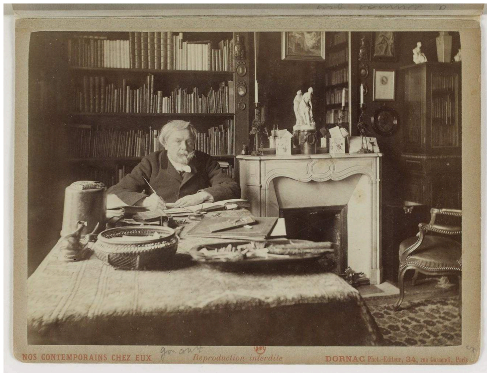
Dornac [Cardon, Paul], portrait photographique d'Edmond de Goncourt dans son cabinet de travail, Nos contemporains chez eux , entre 1885 et 1895, papier albuminé.