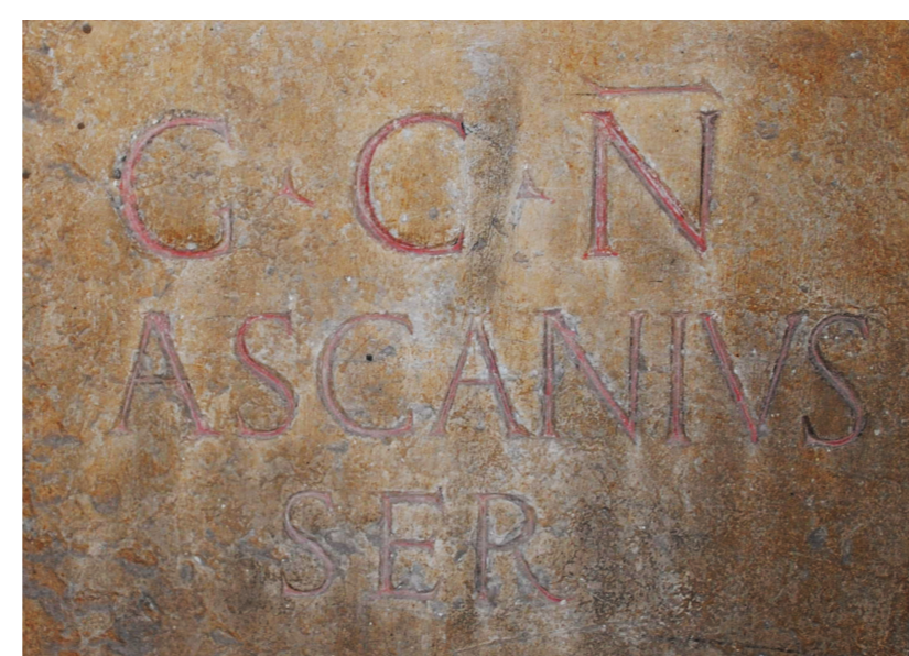
Exemple du formulaire Détail du CIL XII, 3052

À première vue, la formulation abrégée, l'onomasie réduite au seul praenomen et la relation interpersonnelle sous-entendue par l'adjectif noster confortent l'hypothèse d'un contexte privé (maison, compitum , collège). Cependant, il convient d'approfondir les données épigraphiques, matérielles et contextuelles offertes par ce corpus pour répondre à la question du lieu d'exposition de cet hommage, mais aussi pour approcher la construction sociale du langage culturel dans la sphère privée.