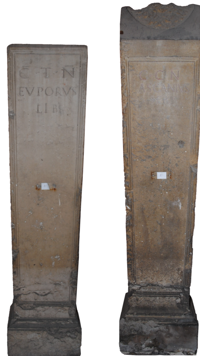
Piliers hermaïques de Nîmes (CIL XII, 3052 et 3056)