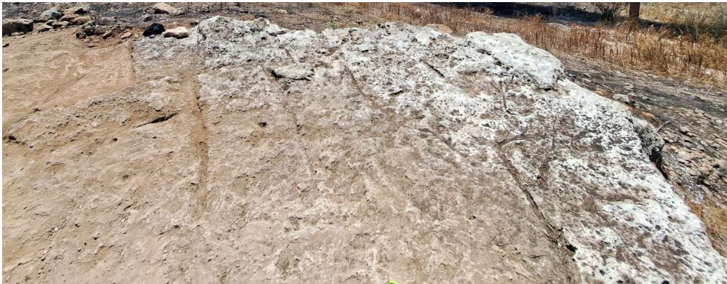
Fig. 12. La roche aplanie portant des sillons d'extraction de blocs parallélépipédiques. Vue vers l'Est.

La fouille a mis au jour un aplanissement du substrat sur tout le secteur immédiatement au sud des traces d'encastrement. La roche est creusée régulièrement de sillons, témoignage de l'extraction de blocs ( fig. 12 ). La disposition des sillons, parallèles et perpendiculaires les uns aux autres, permet de déduire la dimension approximative des blocs extraits. Il s'agissait de blocs rectangulaires de grandes dimensions, jusqu'à 110 cm de long sur 27 de large. Il s'agit de dimensions qui sont similaires à celles des blocs en place dans la courtine mise au jour à l'Est de la colline, recourant à la « coudée égyptienne » comme unité modulaire (52,5 cm après équarrissage et mise en œuvre). Malgré l'absence de tessons, il est possible de penser que cette carrière à ciel ouvert soit hellénistique et qu'elle ait servi à alimenter le chantier de construction du rempart Nord. Un gros éclat de taille semble témoigner du travail d'égalisation des blocs avant mise en œuvre ( fig. 13 ). Peut-être des blocs avaient-ils été extraits à proximité immédiate du chantier du rempart tout le long de son tracé. Dans ce cas, il pourrait aider à préciser l'emplacement de ce tracé.