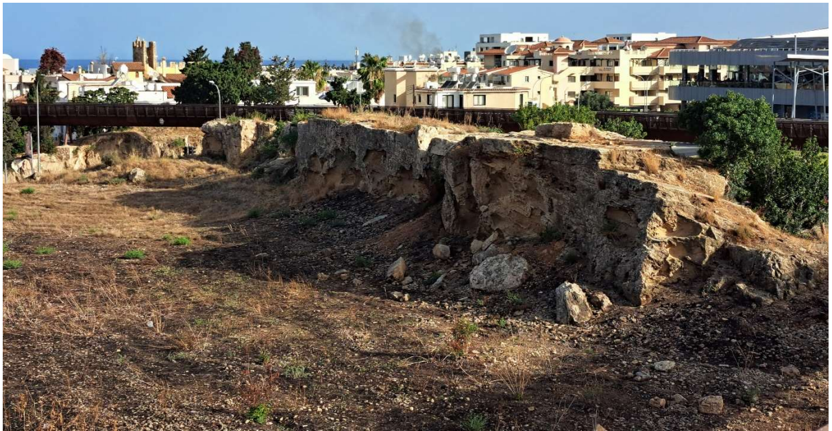
Fig. 3. La falaise résiduelle au Nord-Ouest de la colline de Fabrika . Vue vers le Nord-Ouest.