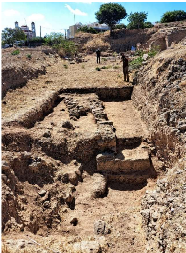
Fig. 22. Le mur sur le substrat taillé. Vue vers l'Est.

Un niveau de circulation damé (rue ?) semblait avoir alors été aménagé ; mis au jour en 2013, il était délimité au sud par un mur rudimentaire, fondé sur la roche ( fig. 22 ), et conduisait vers la maison romaine, une trentaine de mètres plus à l'Est. Ce mur rudimentaire, fait de blocs en orthostates et de pierres de tout venant et terre, était en fait un mur de soutènement de l'épais remblai visible dans la berme Sud et un autre remblai a été constitué contre sa face Nord, apparemment pour soutenir une rue damée, comme on peut le voir dans la coupe de la berme Ouest du sondage ( fig. 23 ).