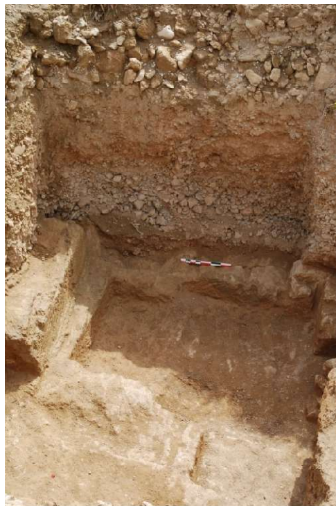
Fig. 21. Le fond de carrière et les couches de remblai accumulées.