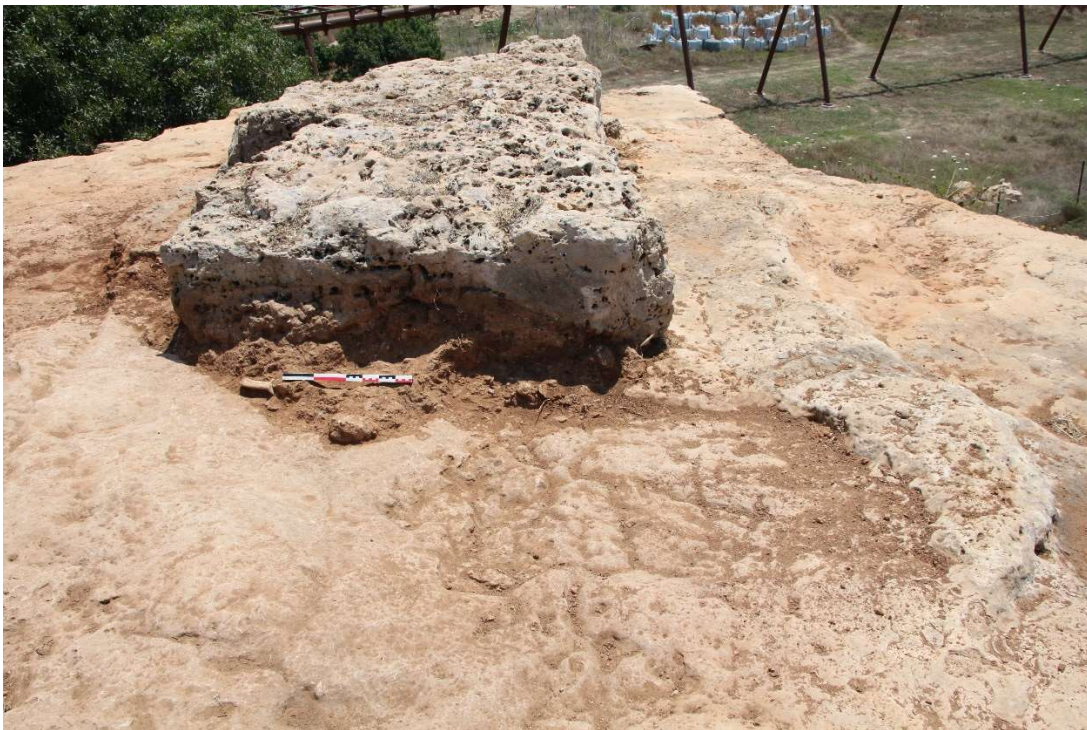
Fig. 3. Le substrat nivelé et terre argileuse et roche résiduelles de la structure interne du rempart Nord au sommet de la falaise. Vue vers l'Est.

Sur cette même falaise, quelques mètres plus à l'ouest, nous avons pu observer que le substrat est nivelé de façon régulière et comporte encore la terre argileuse du remplissage entre les deux parements (disparus) dont il donne ainsi la limite ( fig. 5 ).