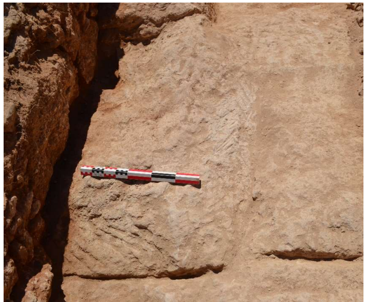
Fig. 28. Traces de régularisation de la roche pour en faire un lit d'attente. Vue vers l'Est.