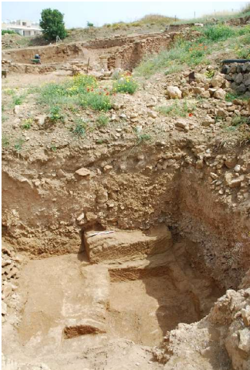
Fig. 20. Le substrat taillé mis au jour en 2012. Vues vers l'Est et le Sud-Est.

L'extension linéaire de la carrière, dont les négatifs d'extraction témoignent qu'on y avait produit des blocs de grandes dimensions, similaires à ceux mis au jour dans la courtine du rempart Est, semble nous indiquer que le rempart Nord lui était vraisemblablement parallèle. Il est ainsi possible que celui-ci soit à rechercher quelques mètres plus au Nord où un sondage avait été ouvert, en 2012, pour identifier le niveau de circulation à l'ouest de la maison romaine et où le substrat avait été atteint très profondément ( fig. 20 ). La couche stratigraphique obtenue avait fait comprendre que le secteur avait été fortement remblayé à l'époque romaine, ce qui avait modifié la topographie au nord de la colline de Fabrika ( fig. 21 ).