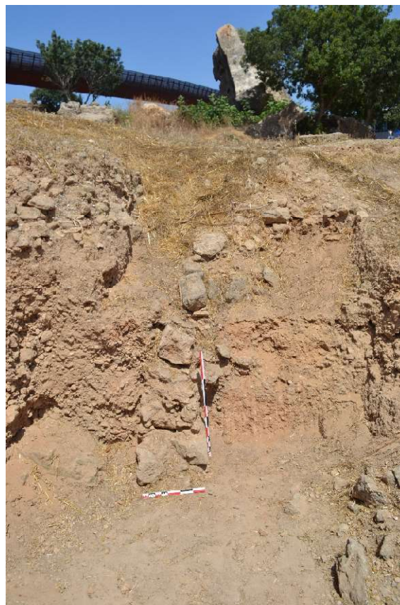
Fig. 23. Le mur sectionné dans la berme Ouest : Il retient un remblai au Sud (à gauche) et un remblai a été accumulé contre lui au Nord (à droite) pour établir une rue.