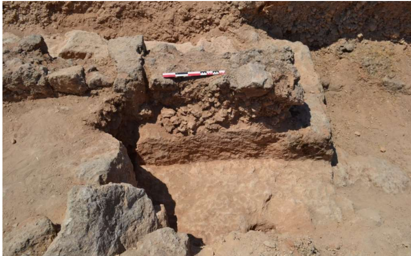
Fig. 26. Le négatif de bloc et le lit d'extraction aplani et la paroi régularisée. Vue vers le sud-ouest.

L'élargissement du sondage vers l'Est ( fig. 27 ) a permis de poursuivre le dégagement du substrat et de constater que l'épaisseur de roche laissée volontairement par les carriers se poursuivait de façon linéaire et régulière sur environ 6 m de long vers l'Est. Cela a confirmé le fait que le substrat avait été régularisé en surface ( fig. 28 ) et que, là aussi, la roche avait aussi été conservée sur la hauteur et l'épaisseur d'un bloc (bloc non extrait), comme si on avait souhaité le conserver dans l'alignement du socle rocheux. S'il s'agit bien du soubassement du rempart, il aurait été pris dans la structure interne, entre deux parements aujourd'hui disparus.