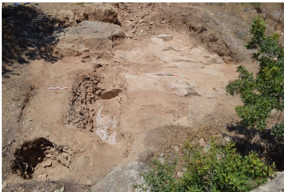
Fig. 35. La roche à nu vue depuis le haut de la masse rocheuse de l'église rupestre. En bas à gauche, fosse tardive. À l'arrière-plan en haut à gauche l'entaille dans la roche, interprétée comme une poterne en 2022.

Le substrat a été mis à nu sur toute la longueur du sondage ( fig. 35 ), confirmant que la masse rocheuse de l'église était liée à l'aménagement du secteur. Celui-ci a été perturbé par des fosses plus tardives (cf. la fosse dans l'angle en bas à gauche de la fig. 35), probablement liées à l'activité de l'église, mais aucune sépulture n'a été mise au jour dans ce secteur.