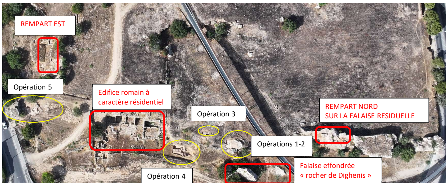
Fig. 30. Vue verticale des secteurs de fouille de l'enceinte urbaine au Nord de la colline de Fabrika . Le Nord est en bas.

La recherche de la jonction entre les remparts oriental et septentrional a été reprise au nord-est de la colline là où la roche avait été atteinte en 2022 au Nord et en contrebas de la courtine du rempart Est et à l'ouest de l'église rupestre d'Ayios Agapitikos ( fig. 30 ).