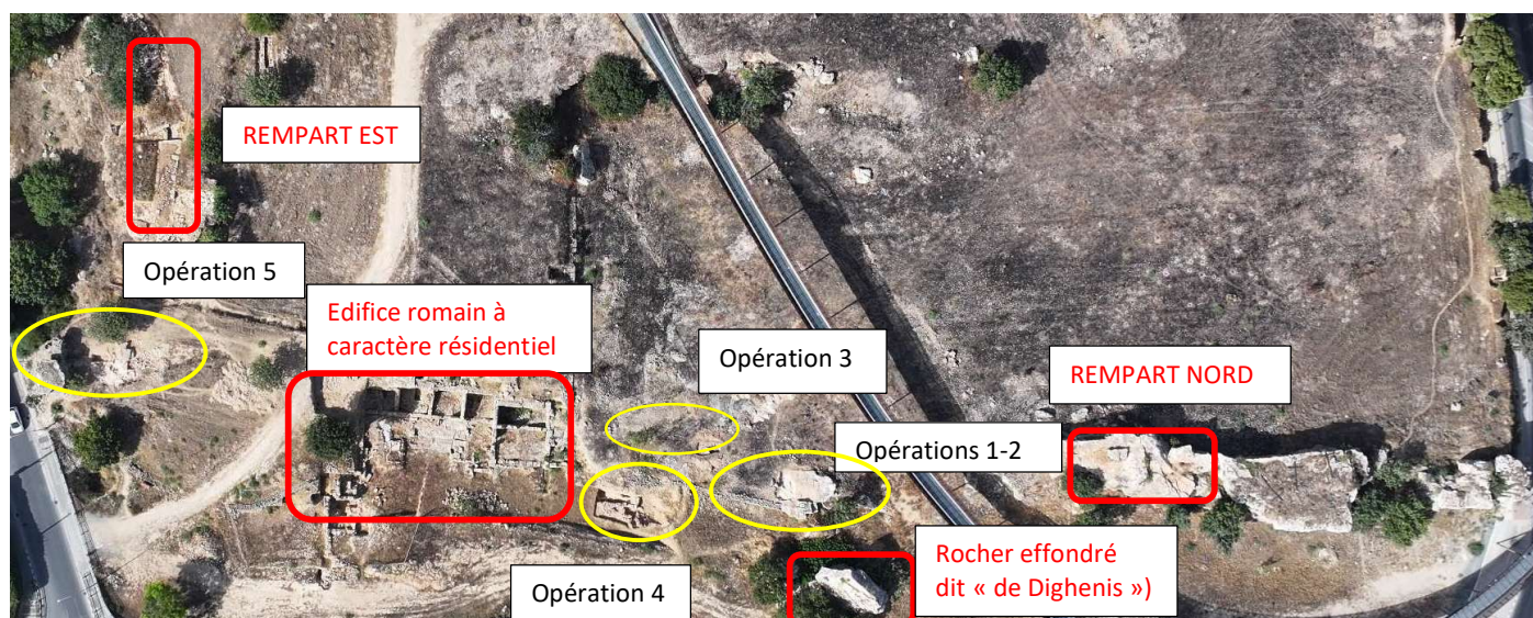
Fig. 6. Localisation des opérations effectuées sur le tracé du rempart Nord en 2024. Le Nord est en bas. Photo verticale par drone réalisée par le service de conservation du site archéologique de Paphos, dirigé par E. Charalampos (Département des Antiquités de Chypre), que nous remercions.

Cette année, l'objectif a été de poursuivre la recherche du tracé du rempart Nord à la hauteur de ce rocher et plus à l'est, et à tenter d'identifier sa jonction avec le rempart Est ( fig. 6 ). Six opérations archéologiques principales ont été conduites par Claire Balandier, assistée de Manuel Tastayre 2 . Yohan Échaubard a assuré le conditionnement du mobilier archéologique et l'étude des timbres amphoriques rhodiens, nombreux, mis au jour par les différentes opérations décrites ci-dessous.