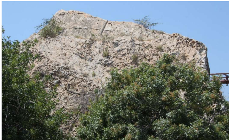
Fig. 8. Vue du lit d'attente basculé du fragment de falaise (« rocher de Dighenis »). Vue vers le Sud.