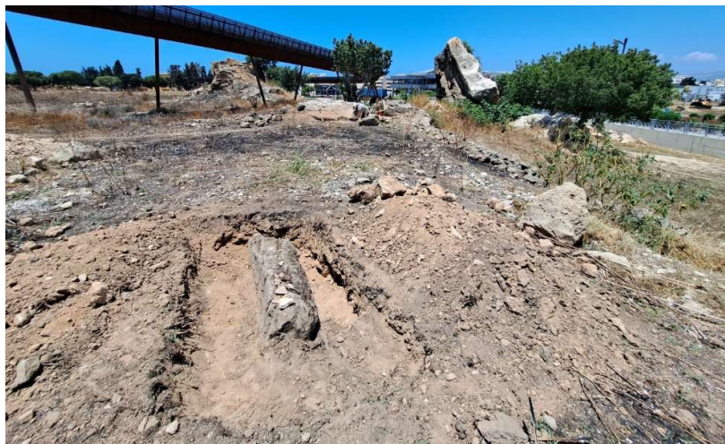
Fig. 16. La roche taillée émergeant à la surface en cours de dégagement. Vue vers l'Ouest.

Quelques dizaines de mètres au sud-est de cette zone d'extraction et de cet effondrement du substrat, un fragment de roche taillée émergeant verticalement de la terre a été observé ( fig. 16 ). Celui-ci se trouvant presque dans l'axe de la falaise résiduelle ayant servi de socle au rempart Nord, un sondage a été ouvert pour vérifier s'il s'agissait d'un bloc en place.