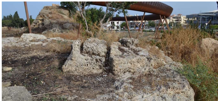
Fig. 9. Le substrat taillé dans l'axe de la falaise résiduelle (à l'arrière-plan) et au sud du fragment basculé (à droite du bord droit de la photo). Vue vers le Nord.

Au sud-est de cette portion de falaise effondrée, la roche apparaît et porte la trace d'aménagements et notamment d'encastrement de blocs ( fig. 9 à 11 ). Un sondage a donc été ouvert pour vérifier s'il pouvait s'agir de la suite du tracé du rempart, à une altitude inférieure.