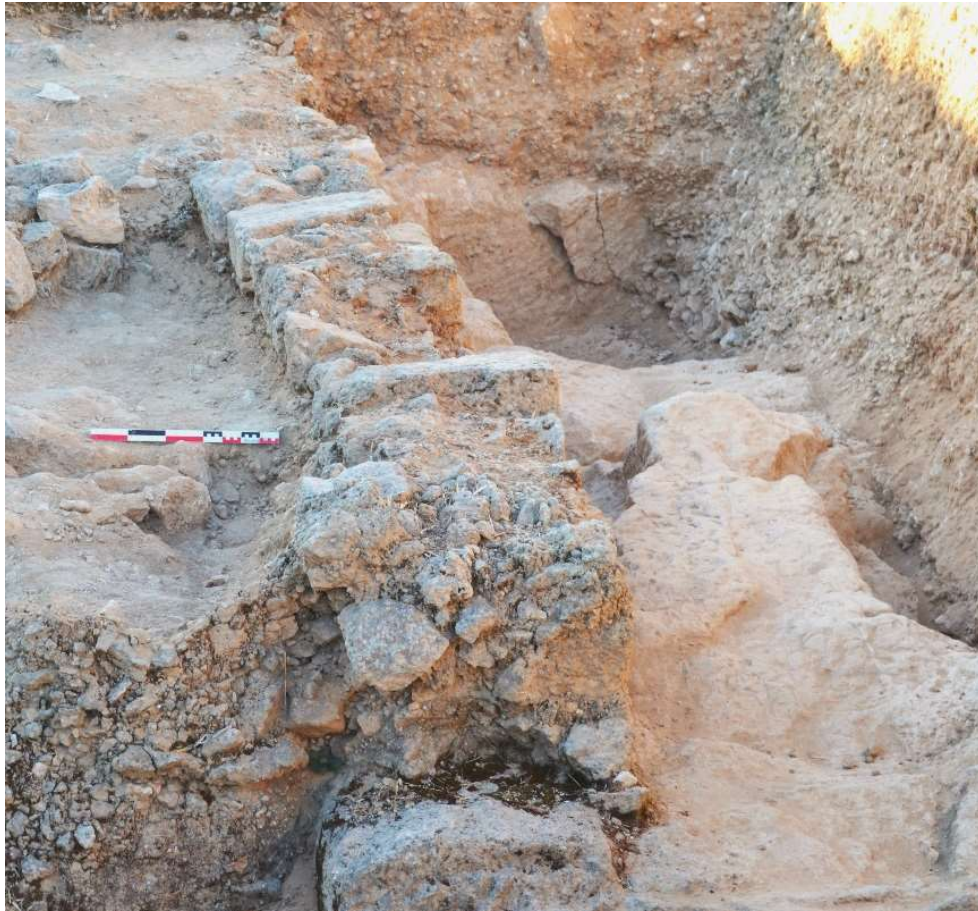
Fig. 29. À l'arrière-plan, le substrat retaillé verticalement prend la direction du sud-sud-ouest. Vue vers le sud-est.

La roche nivelée prend alors une direction sud-sud-est et disparaît dans l'angle des bermes est et sud du sondage élargi ( fig. 29 ). Ce massif taillé dans le substrat ayant une épaisseur et une largeur régulières, il pourrait effectivement s'agir du socle rocheux du rempart comme Jean-Claude Bessac en avait émis l'hypothèse. Le mobilier archéologique mis au jour dans la couche sableuse, mêlée de cailloutis, recouvrant le substrat et s'interrompant contre la face sud du massif rocheux (« socle » du rempart) n'a pas été encore expertisé : au premier regard, il semble majoritairement hellénistique, mais la présence de tessons romains n'est pas à exclure, notamment en raison du réaménagement de tout le secteur Nord de la colline à l'époque romaine.