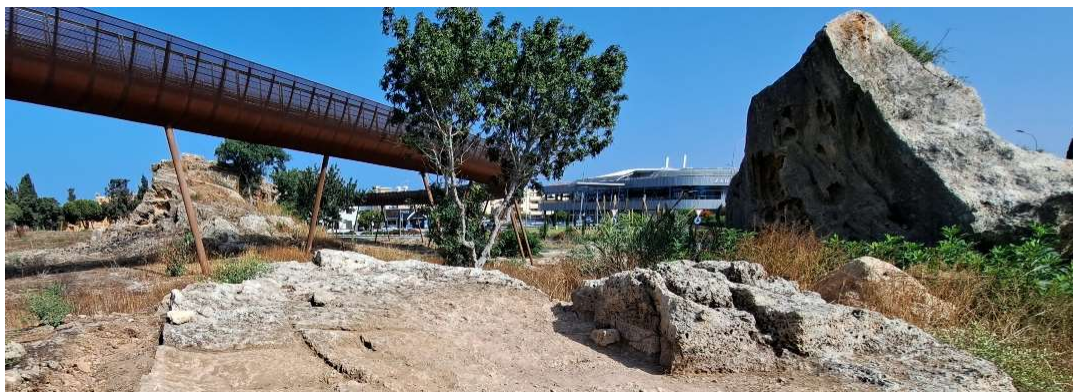
Fig. 11. Le substrat rocheux et la roche taillée à droite, dans l'axe de la falaise résiduelle (au fond) et immédiatement au sud-est du fragment de falaise effondré. Vue vers l'Ouest.