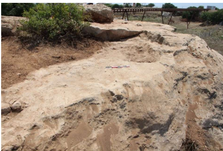
Fig. 5. La roche nivelée et le résidu de terre argileuse rougeâtre de la structure interne du mur. Vue vers l'est.