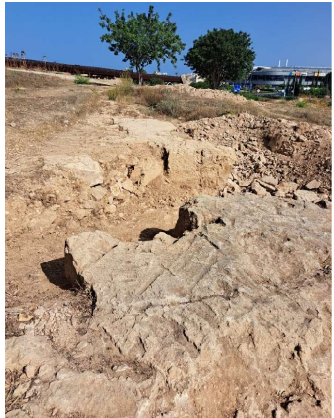
Fig. 38. Marque incisée dans la roche nivelée à l'ouest du passage. Vue vers l'Ouest.

Cependant, la poursuite du dégagement de la roche plus à l'Est au pied de la paroi ouest de la masse rocheuse de l'église rupestre, a montré que tout le secteur avait été l'objet d'extraction de la pierre, peut-être pour l'aménagement de l'église, après que la roche se soit en partie affaïssée. La roche est très abimée dans ce secteur ( fig. 39 ). En limite Nord du sondage, elle est en effet fracturée et devient très sableuse, comme cela a pu être également mis en évidence dans l'opération 2, à côté du fragment de falaise effondrée. Des vestiges de fronts de taille sont identifiables dans les dégagements effectués au Sud et au Nord. La masse de remblai d'éclats de taille et pierres a empêché d'atteindre le fond. Dans le sondage Sud, un drap a été posé pour indiquer l'arrêt de la fouille.