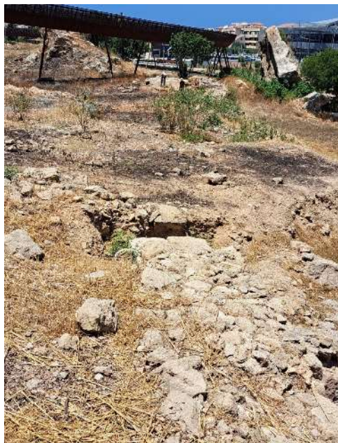
Fig. 40. L'extrémité Ouest du mur de soutènement Sud du bâtiment romain (ici vue à son sommet au premier plan) est dans l'axe de la falaise résiduelle supportant les vestiges du rempart Nord. Vue vers l'Ouest.

Cette opération n'a pas permis de confirmer que le rempart Nord était fondé sur cette terrasse, mais n'a pas non plus permis d'en infirmer totalement l'hypothèse. Le substrat nivelé se trouvant approximativement dans l'axe de la falaise résiduelle sur laquelle nous avons identifié le tracé du rempart Nord, celui-ci aurait pu être implanté sur cette terrasse. Cependant, la découverte, au cours de cette même campagne, du prolongement vers l'Est du mur de soutènement Sud du grand bâtiment à caractère résidentiel (dit « maison romaine ») conduit à penser que tout le nord de la colline a subi un réaménagement important à l'époque romaine, probablement à la suite de l'un des tremblements de terre survenus entre la fin du I er siècle av. J.-C. et la construction de ce bâtiment dans la 2 e moitié du I er siècle de notre ère. Le substrat retaillé et nivelé, que l'on a dégagé sur plusieurs mètres à l'ouest de l'église rupestre pourrait correspondre au prolongement vers l'Est d'un nouveau quartier résidentiel établi à cette époque. L'extrémité Ouest du mur de soutènement Sud de la maison romaine est bien dans l'axe de la falaise résiduelle ( fig. 40 ).