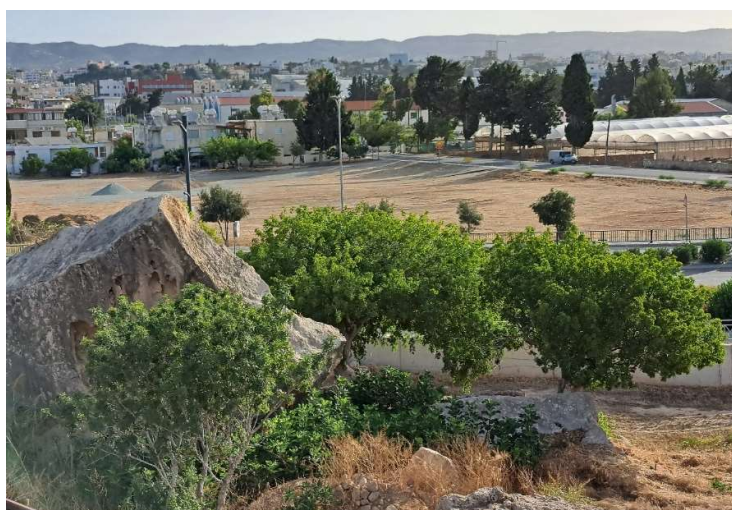
Fig. 10. Le fragment de falaise basculé (« rocher de Dighenis ») et la roche taillée à l'Est. Vue vers le Nord.