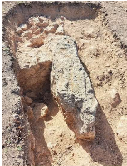
Fig. 18 et 19. Vues de la roche taillée et d'un mur de soutènement. Vues vers l'Ouest et vers l'Est.