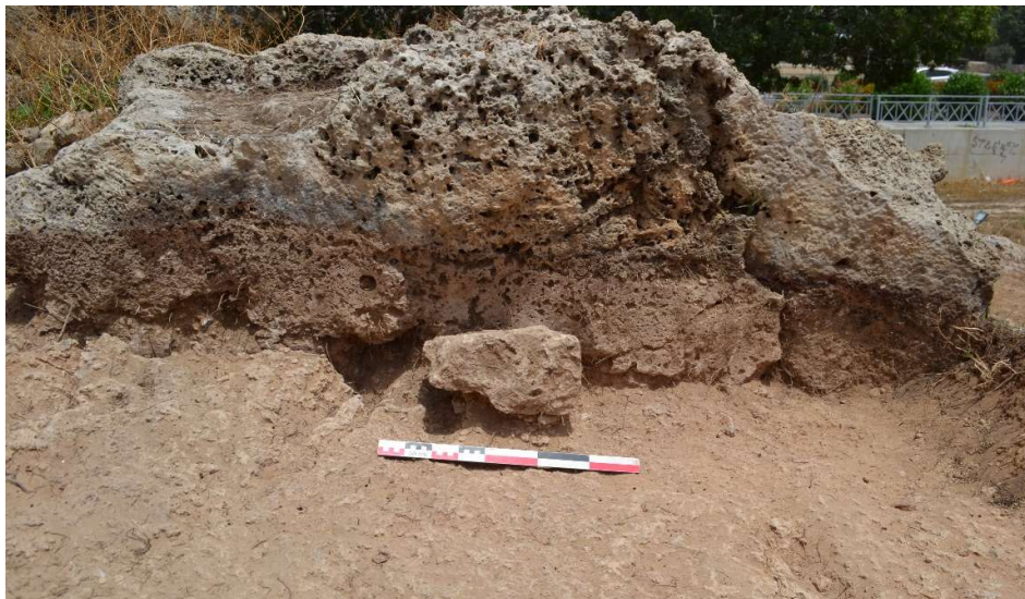
Fig. 13. Gros éclats de taille d'équarrissage de bloc. Vue vers le Nord.

Pour vérifier si la zone d'extraction se poursuivait plus à l'Est et pouvait nous donner ainsi une indication du tracé du rempart, la zone de fouille en aire ouverte a été élargie vers l'est.