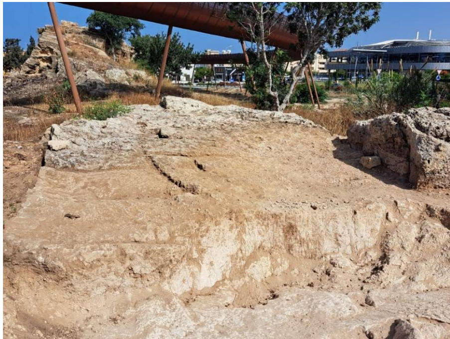
Fig. 15. Détail de l'arrachement du substrat et de sa désagrégation en sable. Vestiges du fond de carrière à l'arrière-plan dans l'axe de la falaise résiduelle et, à droite, de l'éclat de bloc. Vue vers l'Ouest