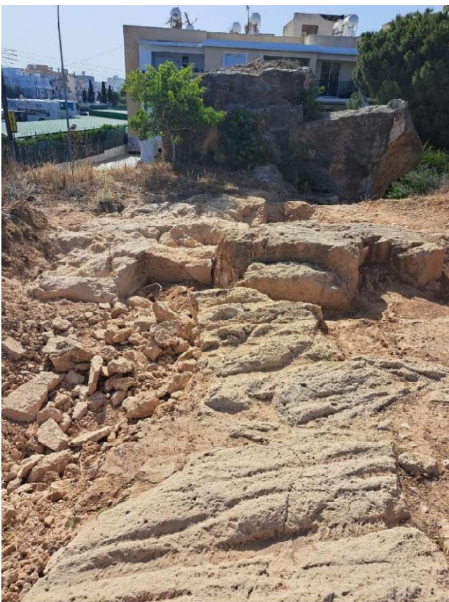
Fig. 37. Traces de charrue sur le substrat nivelé. Vue vers l'Est.

Le substrat qui avait été dégagé en 2022 à l'Ouest de son interruption sur 1, 20 de large portait la trace des charrues utilisées dans le secteur au cours du siècle dernier, mais aucun sillon d'extraction n'avait été observé ( fig. 37 ). La roche semblait avoir été nivelé et surcreusée au nord et au sud, comme pour créer un socle. Ce socle ayant été interrompu par un creusement perpendiculaire, on en avait déduit qu'il pouvait s'agir du soubassement du rempart Nord percé d'une poterne. Un nettoyage soigneux a été réalisé cette année à l'Est de ce passage et a fait apparaître des traces claires d'outils d'extraction et une marque sur la roche qui a été identifiée ailleurs sur des blocs épars dans la destruction de la maison romaine voisine ou en œuvre dans le soubassement du portique sud de l'agora : il s'agit d'un grand delta majuscule à barre brisée enserré dans un cercle ( fig. 38 ). La quasi absence de mobilier archéologique dans le remblai voisin de nous aide pas à déterminer si cette marque est d'époque hellénistique ou romaine. Dans la maison romaine comme sur l'agora, il pourrait s'agir de blocs en remplois.