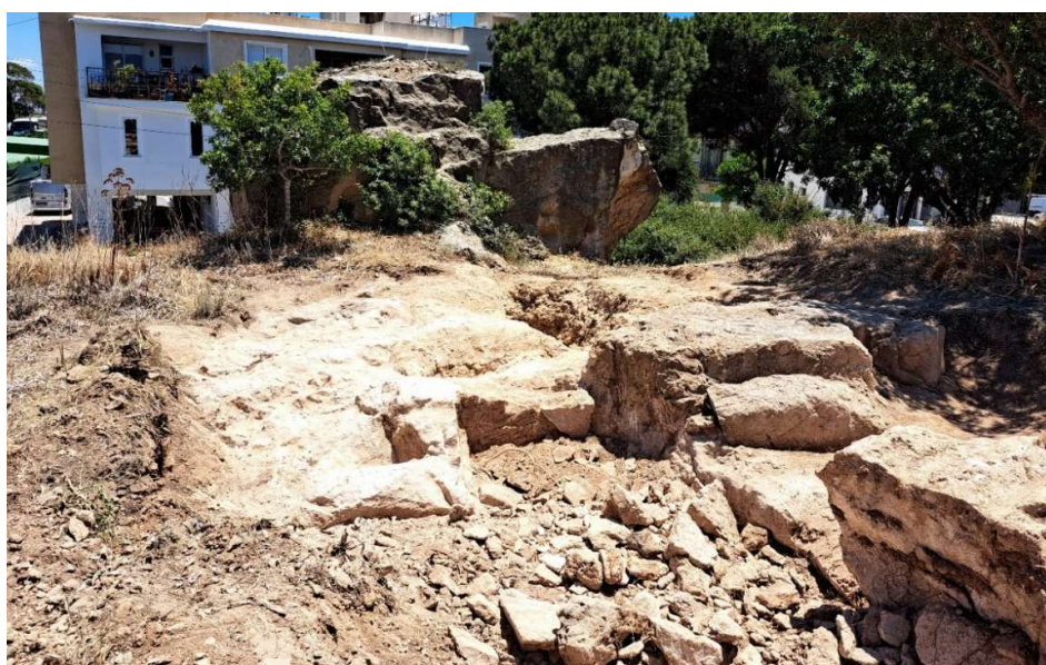
Fig. 36. L'épaisse couche de pierraille et d'éclats de taille comblant l'interruption de la roche taillée avec la masse rocheuse de l'église rupestre à l'arrière-plan. Vue vers l'Est.

La poursuite de la fouille dans le secteur de l'entaille perpendiculaire à la roche, interprétée comme une possible « poterne », en 2022, n'a pu être confirmée. Le dégagement de cette interruption de la roche a été rendu difficile car il était remblayé par d'importants volumes de pierres de tout venant, mais surtout d'éclats de taille de toutes dimensions ( fig. 36 ).