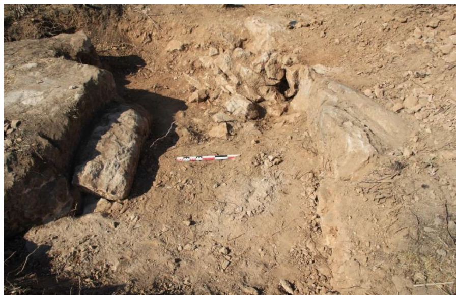
Fig. 31. L'interruption de la roche, nivelée de part et d'autre : « poterne » ? (2022). Vue vers le Sud.

En 2022, la recherche de cette jonction avait mis au jour la roche nivelée sur la terrasse inférieure à celle où a été mis au jour le rempart Est. Cette roche comportait une entaille nette, révélée par le dégagement de surface ( fig. 31 ). Elle s'interrompait ainsi sur environ 1,20 m Est-Ouest, délimitant ce qui ressemblait à un passage Nord-Sud, une éventuelle poterne à l'extrémité Nord du rempart Est ( fig. 32 ).