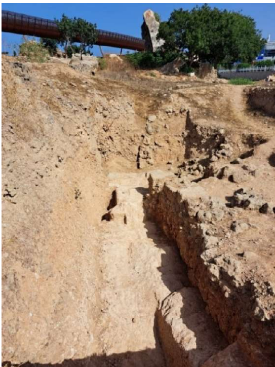
Fig. 27. La roche nivelée à l'Est du sondage avec un bloc non extrait dans l'axe du remplissage interne. Vue vers l'Ouest.

L'élargissement du sondage vers l'Est ( fig. 27 ) a permis de poursuivre le dégagement du substrat et de constater que l'épaisseur de roche laissée volontairement par les carriers se poursuivait de façon linéaire et régulière sur environ 6 m de long vers l'Est. Cela a confirmé le fait que le substrat avait été régularisé en surface ( fig. 28 ) et que, là aussi, la roche avait aussi été conservée sur la hauteur et l'épaisseur d'un bloc (bloc non extrait), comme si on avait souhaité le conserver dans l'alignement du socle rocheux. S'il s'agit bien du soubassement du rempart, il aurait été pris dans la structure interne, entre deux parements aujourd'hui disparus.