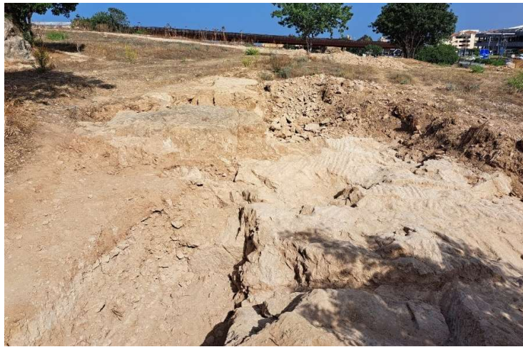
Fig. 39. Le substrat très endommagé au pied de l'église rupestre. Un front de taille est visible dans le sondage à gauche de la photo. Vue vers l'Ouest.

Cette opération n'a pas permis de confirmer que le rempart Nord était fondé sur cette terrasse, mais n'a pas non plus permis d'en infirmer totalement l'hypothèse. Le substrat nivelé se trouvant approximativement dans l'axe de la falaise résiduelle sur laquelle nous avons identifié le tracé du rempart Nord, celui-ci aurait pu être implanté sur cette terrasse. Cependant, la découverte, au cours de cette même campagne, du prolongement vers l'Est du mur de soutènement Sud du grand bâtiment à caractère résidentiel (dit « maison romaine ») conduit à penser que tout le nord de la colline a subi un réaménagement important à l'époque romaine, probablement à la suite de l'un des tremblements de terre survenus entre la fin du I er siècle av. J.-C. et la construction de ce bâtiment dans la 2 e moitié du I er siècle de notre ère. Le substrat retaillé et nivelé, que l'on a dégagé sur plusieurs mètres à l'ouest de l'église rupestre pourrait correspondre au prolongement vers l'Est d'un nouveau quartier résidentiel établi à cette époque. L'extrémité Ouest du mur de soutènement Sud de la maison romaine est bien dans l'axe de la falaise résiduelle ( fig. 40 ).