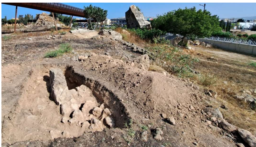
Fig. 17. Mise au jour de la roche taillée et d'un mur de soutènement. Vue vers l'Ouest.

Le sondage a montré qu'il s'agissait en fait de la roche en place, du substrat taillé verticalement, négatif de l'extraction de blocs ( fig. 17 à 19 ). Contre la face Nord de la paroi rocheuse verticale résiduelle vient s'abuter un mur dont seule une face a été mise en évidence. Il s'agit apparemment d'un mur de soutènement qui retient un remblai de pierres de tout venant.