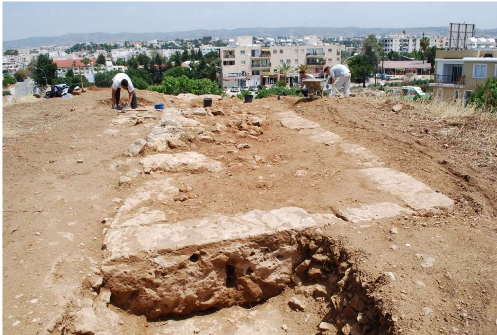
Fig. 2. Mise au jour de l'assise conservée d'une courtine du rempart Est par la MafàP (2014).

Sur cette colline, le rempart Est a été identifié, au cours des années précédentes, sur la ligne de rupture de pente du point le plus élevé au nord-est de la colline, sur la terrasse dominant l'église rupestre d'Ayios Agapitikos ( fig. 2 ).