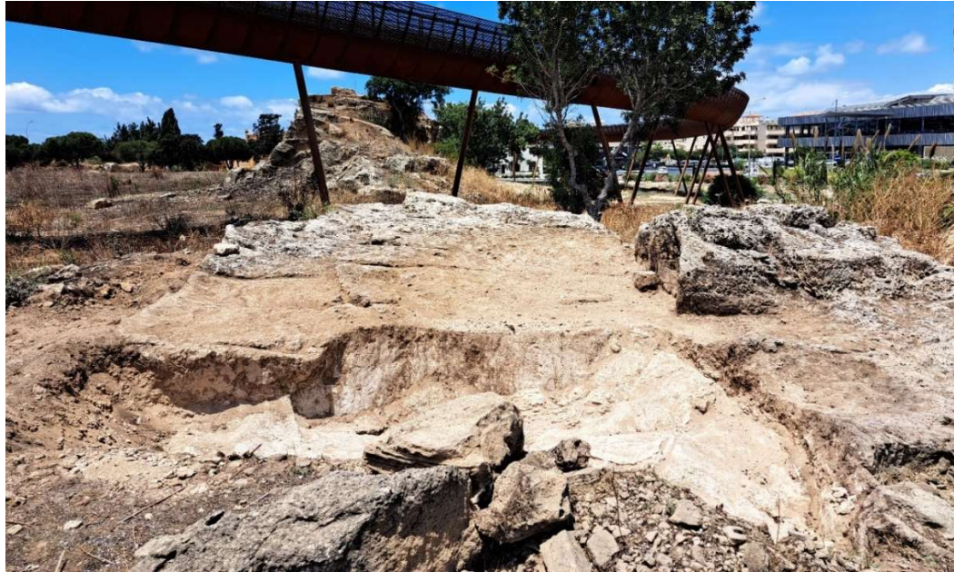
Fig. 14. La faille dans le substrat qui s'est en partie affaissé. Vue vers l'Ouest.

Le substrat y est apparu à une altitude légèrement inférieure, mais la roche y est beaucoup plus dégradée ( fig. 14 et 15 ), en partie sableuse (calcarénite décomposée). Le substrat s'est fissuré et en partie affaissé, vraisemblablement à la suite du même séisme qui a fait s'effondrer la portion de falaise voisine. La roche s'est décomposée, constituant une couche sableuse qui a recouvert le substrat et le fond de carrière.