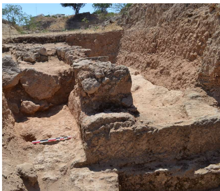
Fig. 24 et 25. Le mur de soutènement avant et après le démontage de son extrémité conservée à l'Ouest. Vues vers l'Est.

Le substrat porte en effet nettement la trace d'outils ayant régularisé la roche après l'extraction d'un bloc ( fig. 26 ). La paroi rocheuse laissée au sud par l'extraction du bloc a également été régularisée de façon soignée. Ceci conduit à penser qu'à l'emplacement même de blocs extraits de la roche avaient ensuite été posé un bloc de taille soigneusement équarri et pour lequel on avait préparé l'emplacement, le lit d'attente dans le substrat, tout aussi soigneusement. Il semble donc bien que l'on ait là les vestiges du socle du rempart Nord.