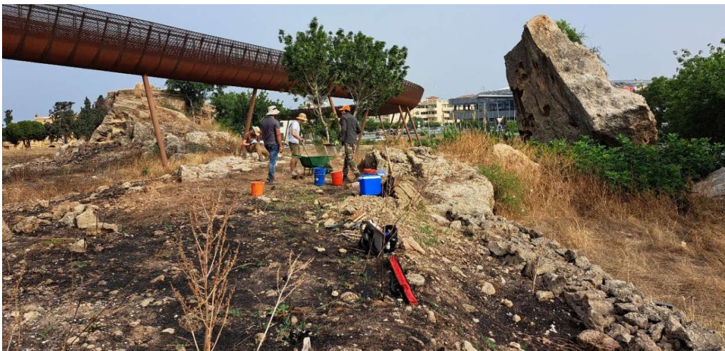
Fig. 7. Implantation d'un sondage dans l'axe de la falaise résiduelle et immédiatement au sud-est du fragment de falaise basculé (« rocher de Dighenis »). Vue vers le Nord-Ouest.

La mise en évidence du tracé du rempart Nord au sommet de la falaise résiduelle, épargnée par la carrière romaine, a conduit à s'interroger sur le prolongement vers l'est de ce rempart et sur son raccordement avec le rempart Est. Les niveaux de fondation des portions des remparts Est et Nord étant beaucoup plus élevés que le niveau de circulation d'époque romaine et actuel entre les deux, l'objectif a donc été double : tenter de restituer la topographie des lieux avant les remaniements d'époque augustéenne pour pouvoir envisager le tracé du rempart Nord. Or, immédiatement à l'est de la portion conservée de falaise où le tracé de ce rempart a été identifié, subsiste une portion effondrée de cette même falaise appelé localement « rocher de Dighenis » (toponyme lié à une légende locale) ( fig. 7 ) : le niveau de circulation ancien de la roche basculée (aujourd'hui vertical) porte la trace d'encastrement de blocs, parallèles ( fig. 8 ), entre lesquels la roche n'a pas été régularisée. En revanche, celle-ci a été nivelée à l'extérieur de ces deux alignements. Il semble donc qu'on ait là le témoignage du prolongement du tracé du rempart Nord vers l'est avant que la falaise ne s'effondre à la suite d'un séisme.