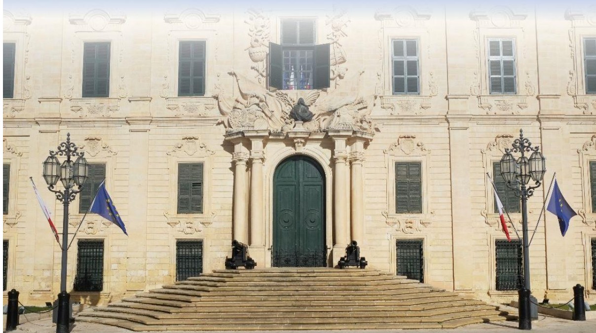
Le palais des Grands Maîtres. À l'origine résidence des Grands Maîtres de l'Ordre de Malte, le palais abrite aujourd'hui le bureau de la présidence de Malte.

30 e anniversaire de la Convention de La Valette (Malte) pour la protection du patrimoine archéologique en Europe