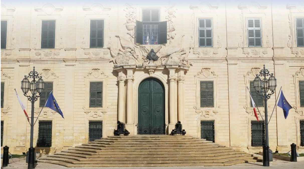
Le palais des Grands Maîtres. À l'origine résidence des Grands Maîtres de l'Ordre de Malte, le palais abrite aujourd'hui le bureau de la présidence de Malte.

30 e anniversaire de la Convention de La Valette (Malte) pour la protection du patrimoine archéologique en Europe