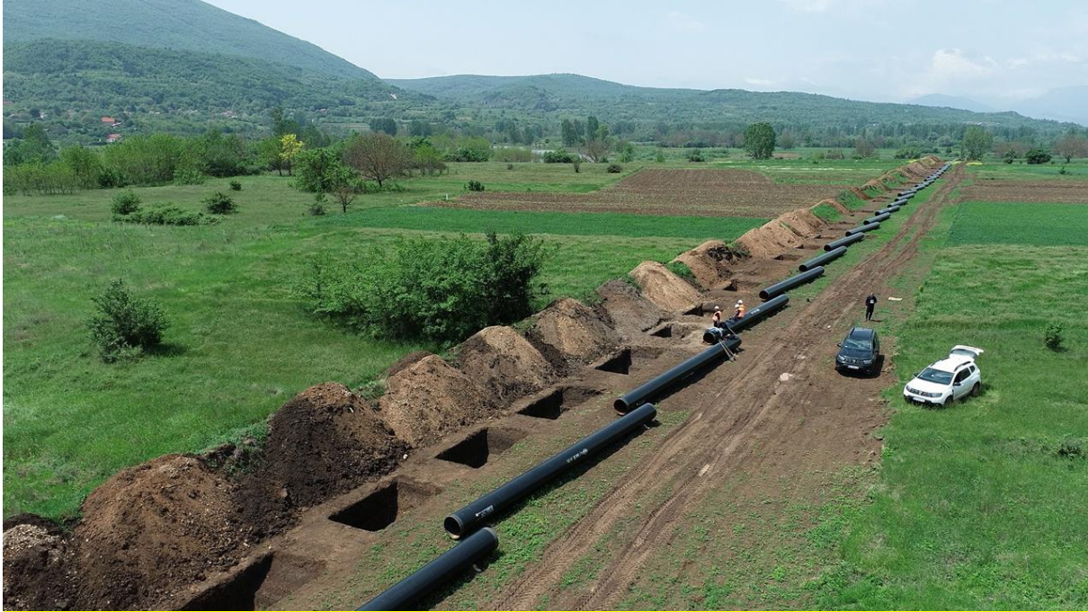
< Figure 2 – Test trenches during the construction of the IBS gas pipeline, 2023 >

After all, if we can implement and secure international support for rapid urban development, can we not do the same for preventive archaeology in Serbia?