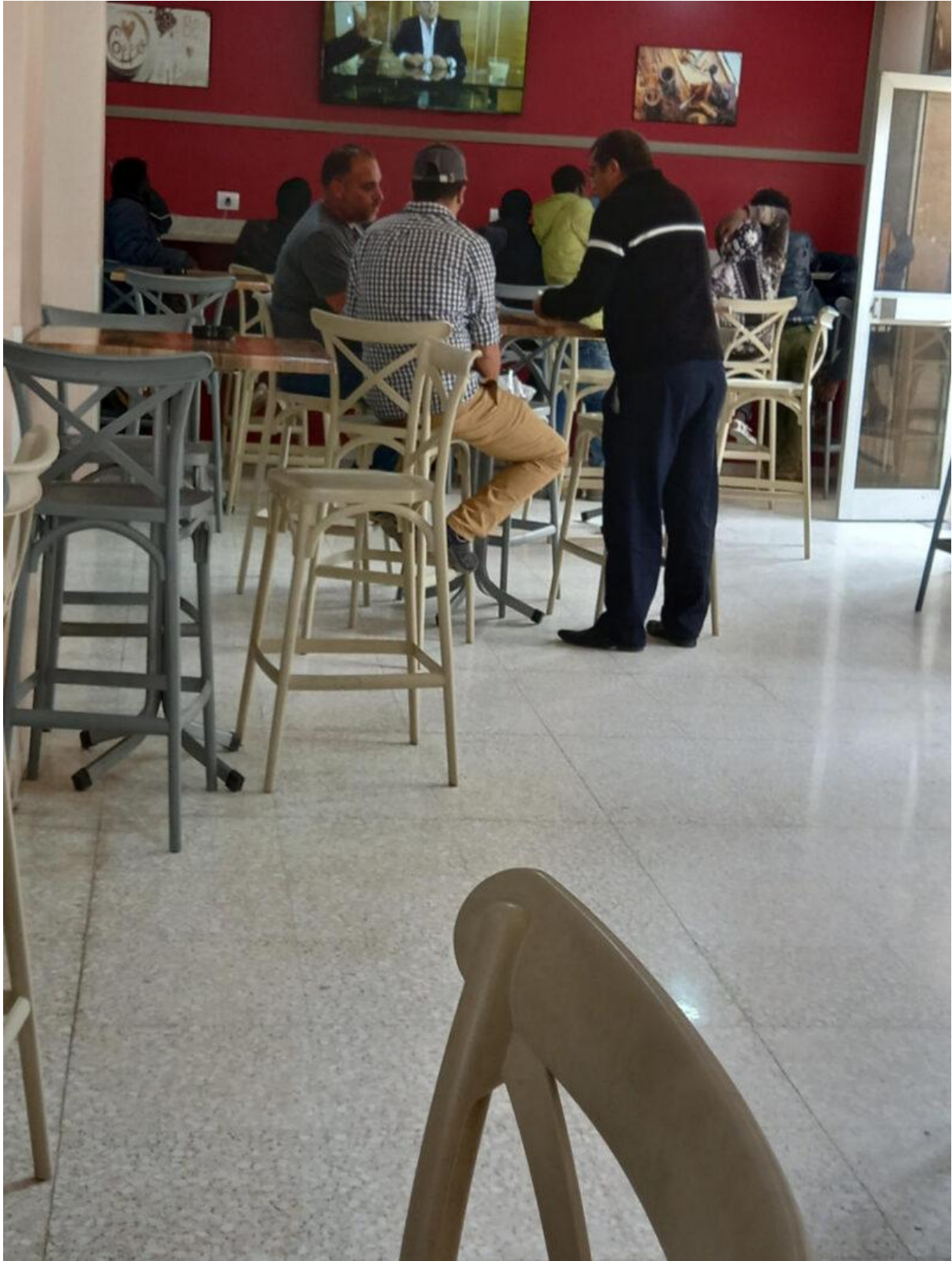
Figure 6. Le café et ses aménagements intérieurs