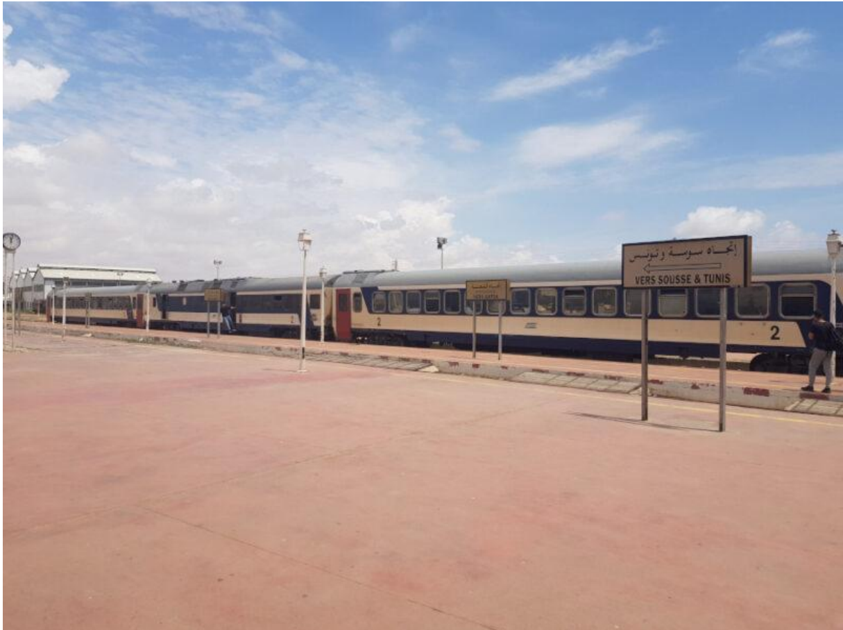
Figure 2. L'arrivée du train en gare

spontanée de tables et de chaises, il est le seul espace animé, rythmant les journées des passant.es comme des résident.es, au petit déjeuner, à la lecture du journal, à la pause sandwich, à la diffusion des matchs de football sur les écrans télévisés. Il se constitue également comme un espace privé, ponctué d'habitudes et de pauses, ouvert sur l'extérieur en tant que commerce mais aussi replié sur lui-même et séparé du hall de gare. La place, elle, semble plus déserte, investie ponctuellement, selon les passages des trains. Le hall de gare est aussi peu fréquenté, si ce n'est pour s'asseoir dans l'attente du prochain train. Au moment de nos observations, un seul guichet est ouvert et reçoit peu de visites.. Dans ce panorama de la gare de Sfax, par qui est-elle occupée et quelle place est laissée aux personnes en situation de migration ?