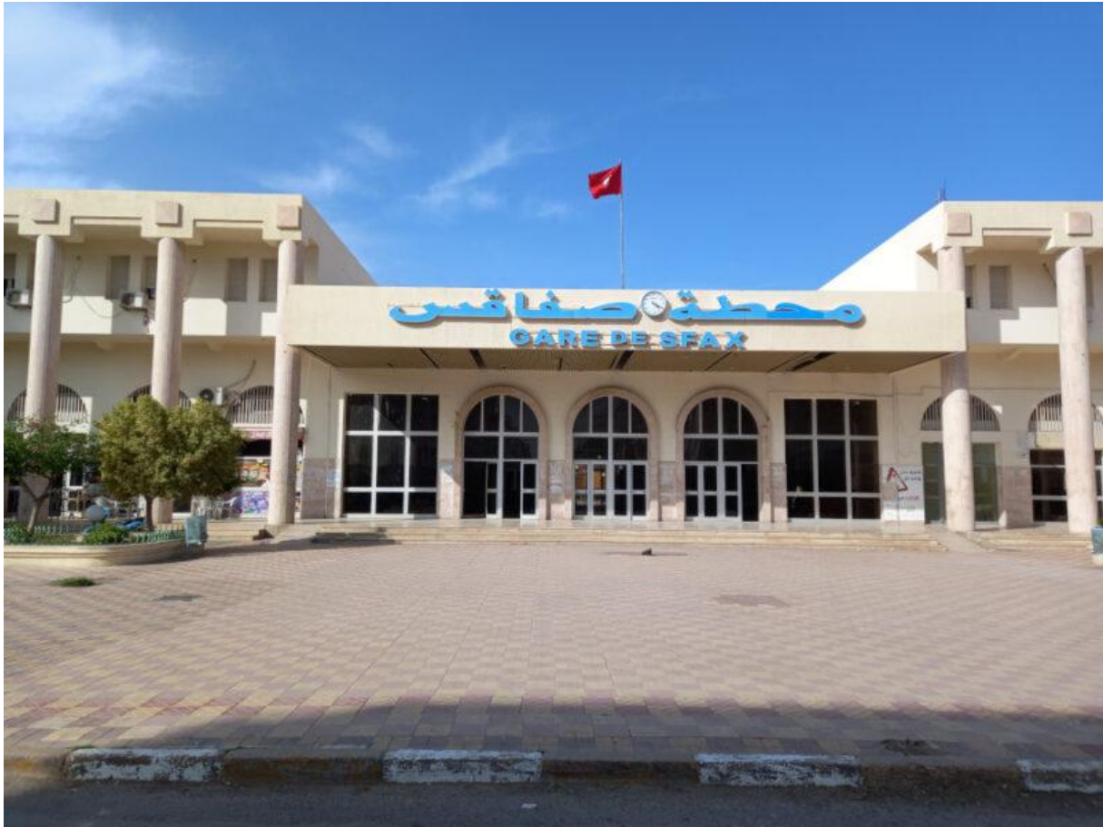
Figure 1. Devanture de la gare ferroviaire de Sfax