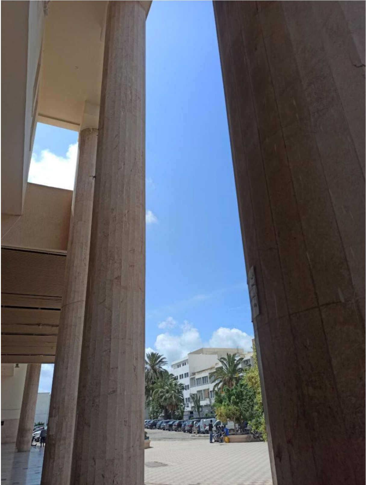
Figure 5. Vue sur la place depuis le parvis de la gare