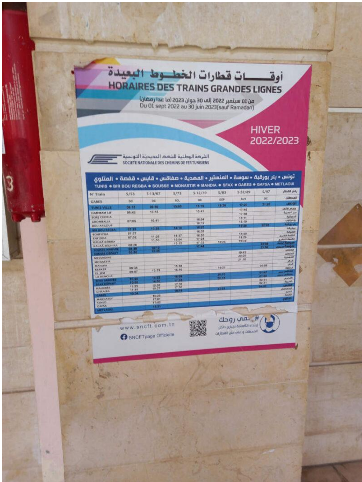
Figure 10. Les horaires et les stations de train desservies