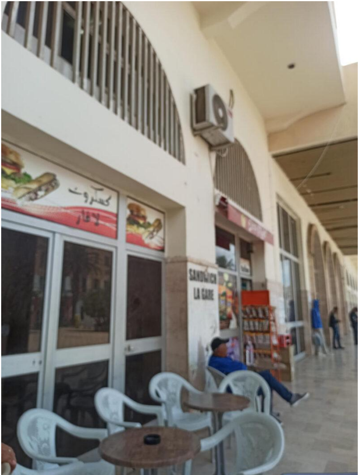
Figure 7. La terrasse du café