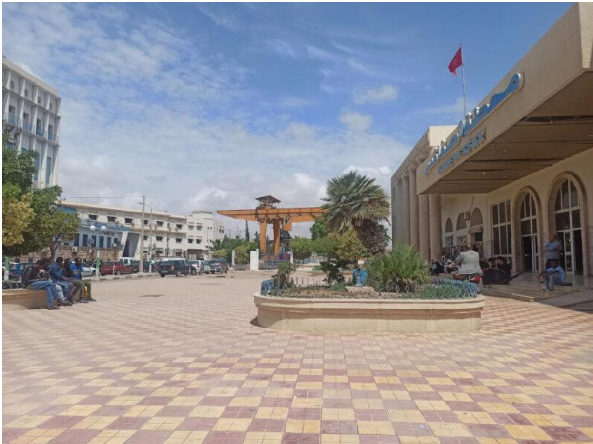
Figure 11. Vue panoramique de la place de la gare

Finalement reléguées à l'extérieur de la gare et du café, les personnes en situation de migration investissent davantage la place devant la gare, espace public ni commercial, ni privé et moins contrôlé. Des groupes de trois à quatre personnes se sont installés sur des petits murets à l'ombre des arbres, à quelques mètres de l'entrée du hall et de la terrasse du café, tandis que les personnes a priori tunisiennes se situent davantage sur la terrasse de ce dernier.