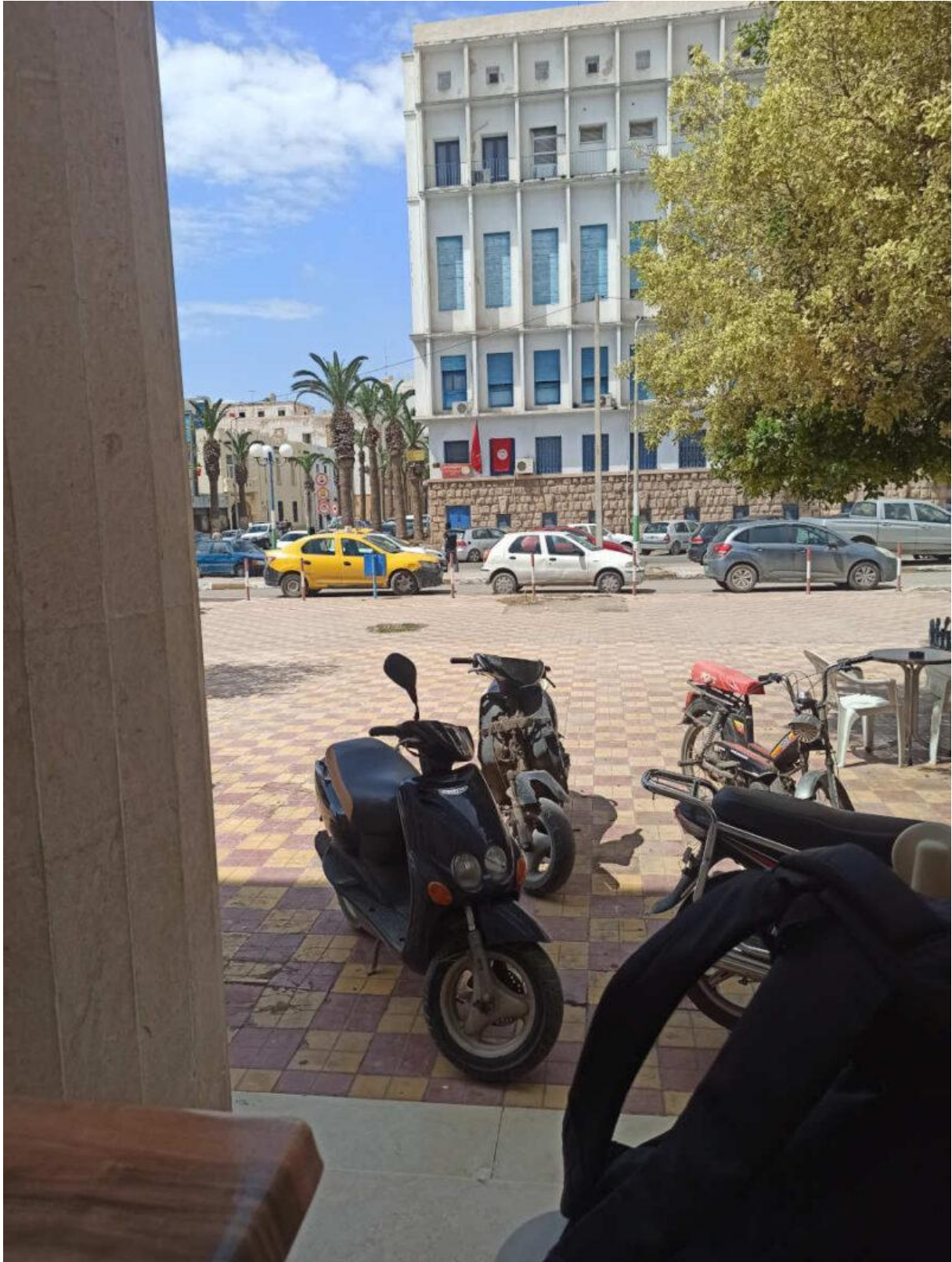
Figure 4. Vue sur la rue depuis la terrasse du café