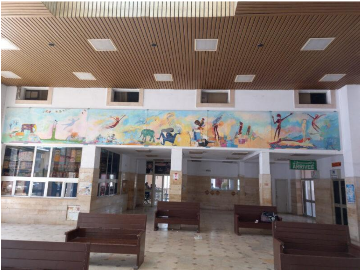
Figure 8. Le hall de gare, ses bancs et sa fresque

De la même manière qu'au café, le hall de gare est un sas de passage où il n'est pas aisé de "prendre place". Les aménagements meublés du hall permettent seulement d'organiser la file d'attente pour acheter ses billets au guichet, de s'asseoir sur les bancs en bois dans l'attente d'un train, et d'organiser le passage vers les quais (avec des barrières et une porte fermée à clé). Les murs du hall de gare sont très peu couverts d'affichages, mis à part les signaux d'indication et d'interdiction de fumer et les horaires des trains indiqués sur un écran et en version papier. Le seul décor est une grande fresque murale située en hauteur, à l'arrière des bancs.