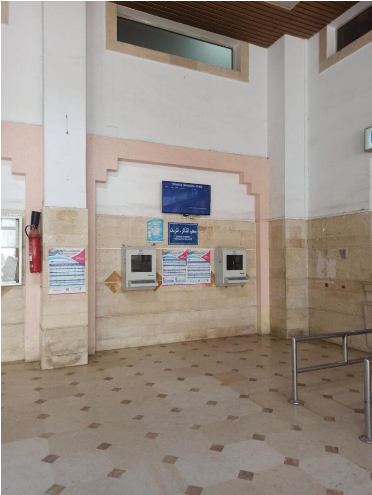
Figure 9. Les affichages du hall de gare