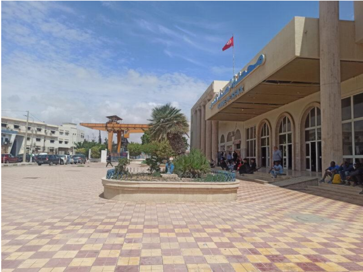
Figure 13. Le parvis de la gare, deuxième vue