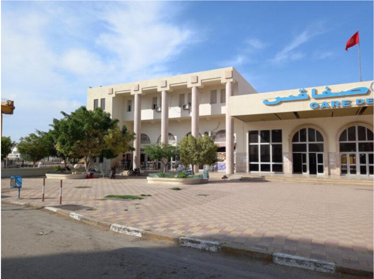
Figure 3. La place de la gare et son café