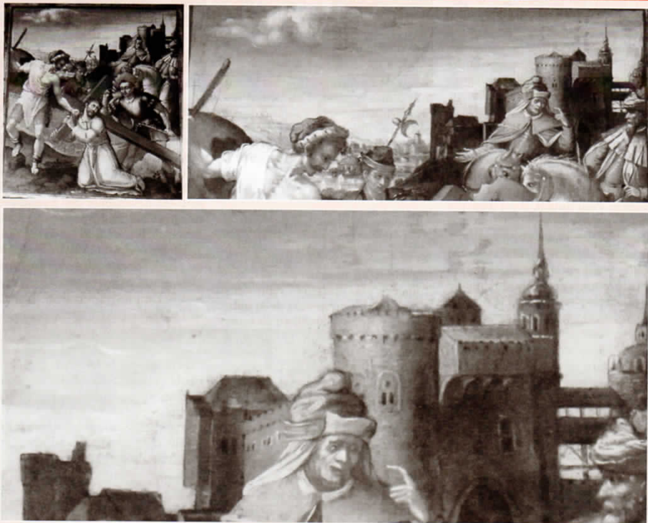
Basilique Saint-Maurice d'Épinal : Tableau de Nicolas Bellot et détail. En zoomant dans la partie supérieure, on y trouve à l'arrière-plan le paysage de la ville d'Épinal, dominée par son château dont les détails sont parfaitement visibles à l'agrandissement.

enquête où la clef de lecture se situe souvent à l'arrière-plan de l'œuvre.