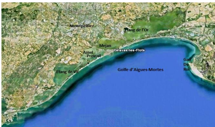
Carte 1 Circonscription prud'homale de Palavas : le golfe d'Aigues-mortes et un chapelet d'étangs salés

Un caractère marquant de la région est la rudesse de son climat et la sauvagerie de son environnement qui en expliquent la colonisation tardive. La chaleur estivale favorise peu le travail, elle se combine avec une absence chronique de végétation qui apporterait de l'ombrage à des