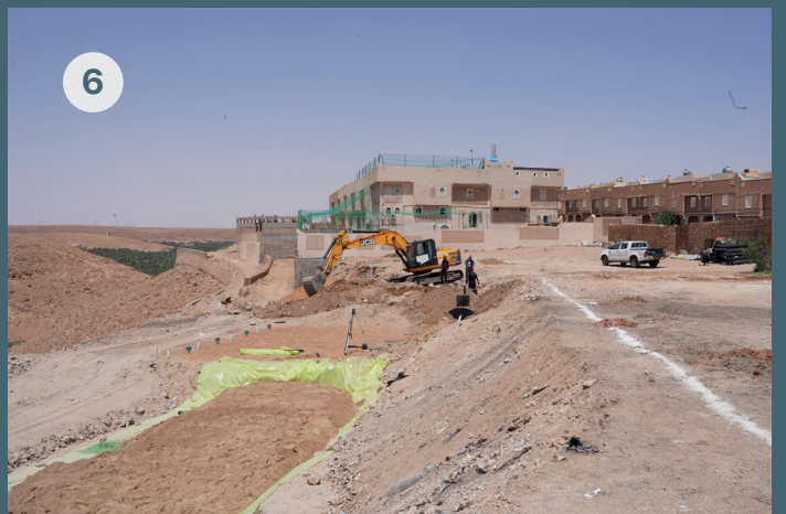
Photos : Installation du dispositif à Ghardaïa