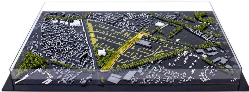
Figure 5. Maquette du projet d'écocité Jardin des maraîchers présentée lors de la réunion de concertation publique préalable à la création de la ZAC (décembre 2011)