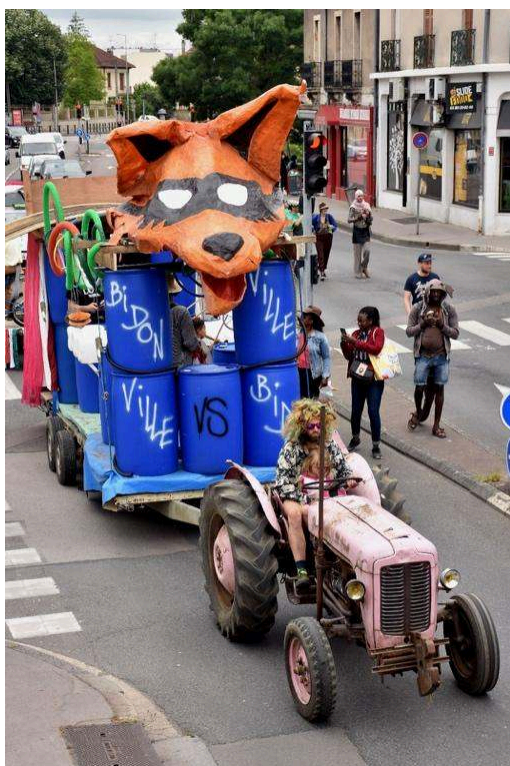
Figure 3. Carnaval du quartier libre des Lentillères, 26 mai 2022

Source : « Récit d'un carnaval haut en couleur », 26 mai 2022, [en ligne] [ https://lentilleres.potager.org/2022/05/26/recit-dun-carnaval-haut-en-couleurs-que-la-fete-continue ], consulté le 07/07/2022.