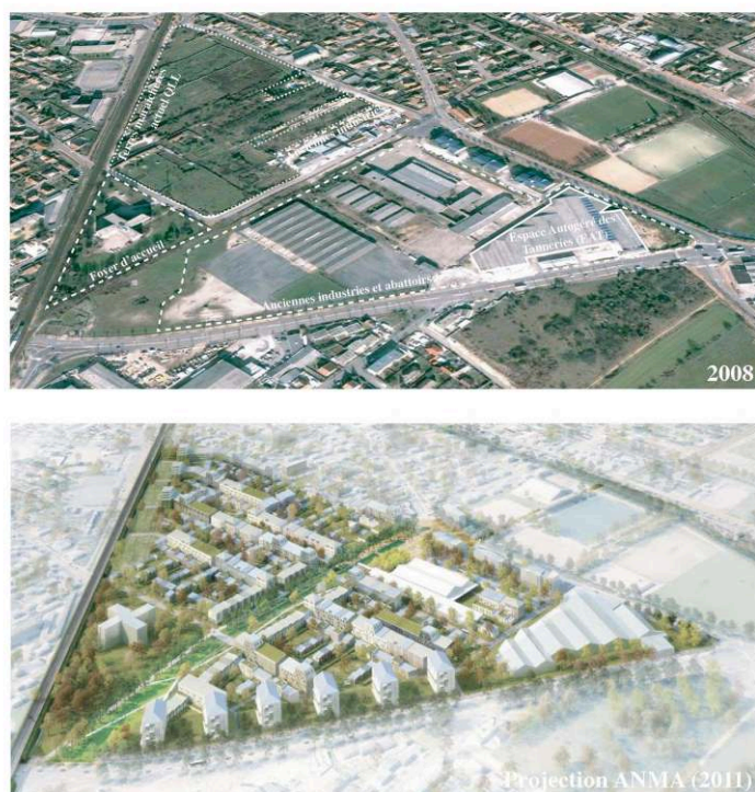
Figure 2. Vue aérienne (2008) et axonométrie de l'écocité projetée (ANMA, concours 2011)