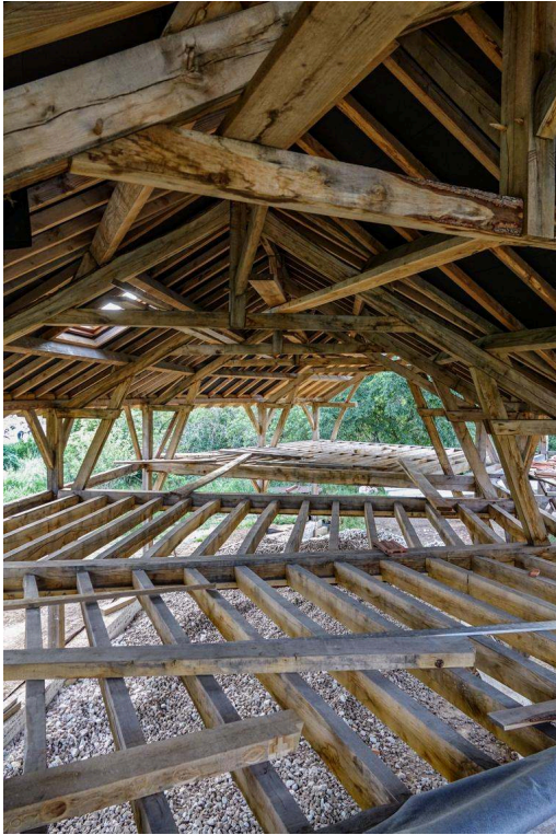
Figure 8. Charpente de la maison commune du quartier libre des Lentillères à Dijon, levée par les Renardes (école de charpentiers), en 2021