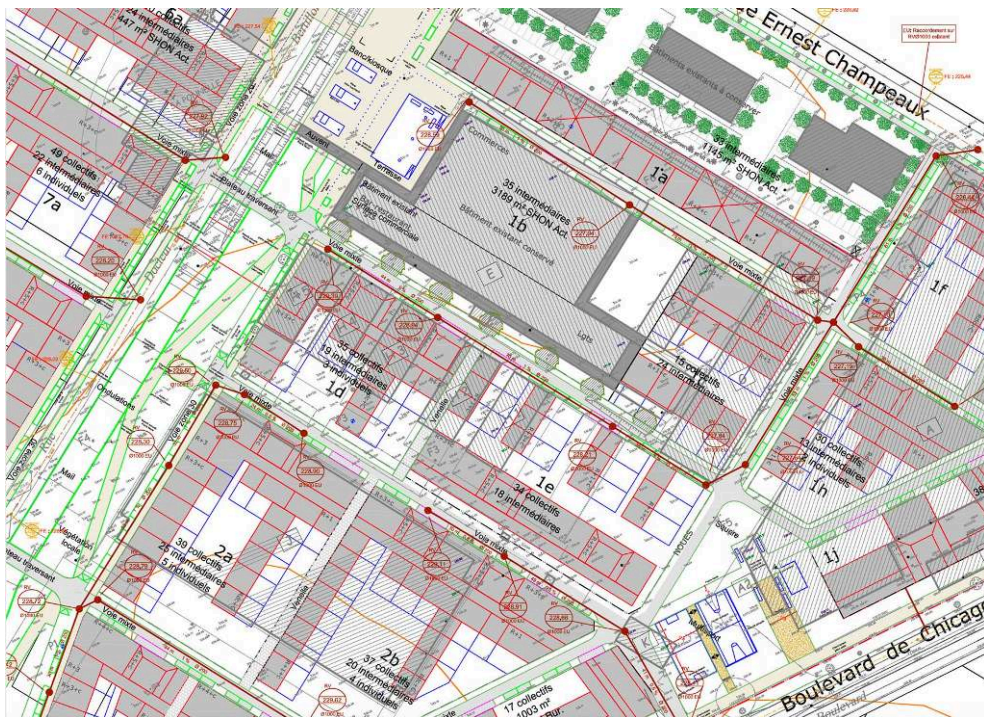
Figure 6. Extrait d'un plan des réseaux de l'écocité Jardin des maraîchers, Dijon

© ANMA, Infraservice, bureau d'études en voirie et réseaux divers, 2016