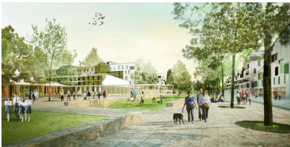
Figure 4. Perspective de l'espace public central de l'écocité, concours, 2011