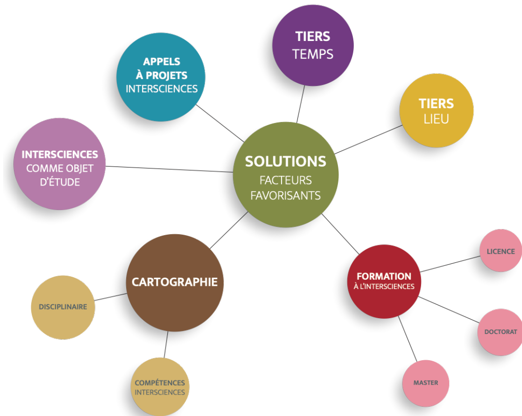
Figure 3 : Émergence de l'intersciences – Solutions multifactorielles