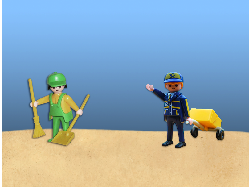
Figure 3. Exemple d'image présentée avec la phrase en (3).

Comme dans de nombreux domaines de la psycholinguistique, la question débattue est de savoir si les stratégies des locuteurs dépendent de processus cognitifs universels ou varient suivant les propriétés des langues. Dans le cas de l'interprétation d'un pronom tel qu'en (3), une hypothèse est que, quelle que soit leur langue, les locuteurs utilisent la même stratégie cognitive qui consiste à relier le pronom à l'antécédent le plus récent (ici le facteur). Or, les résultats révèlent que la préférence d'interprétation du pronom varie suivant la langue. Alors que les francophones préfèrent l'objet (le facteur) comme antécédent du pronom, les germanophones préfèrent le sujet (le balayeur) (Hemforth et al., 2010). Ces résultats montrent que les stratégies d'interprétation du pronom dépendent des propriétés de la langue. L'existence en français d'une structure alternative non ambiguë pour exprimer la référence au sujet telle qu'en (4) déterminerait la préférence des locuteurs francophones pour l'objet en (3), une telle alternative n'existant pas en allemand (pour une discussion, voir Colonna, Schimke et Hemforth, 2014).