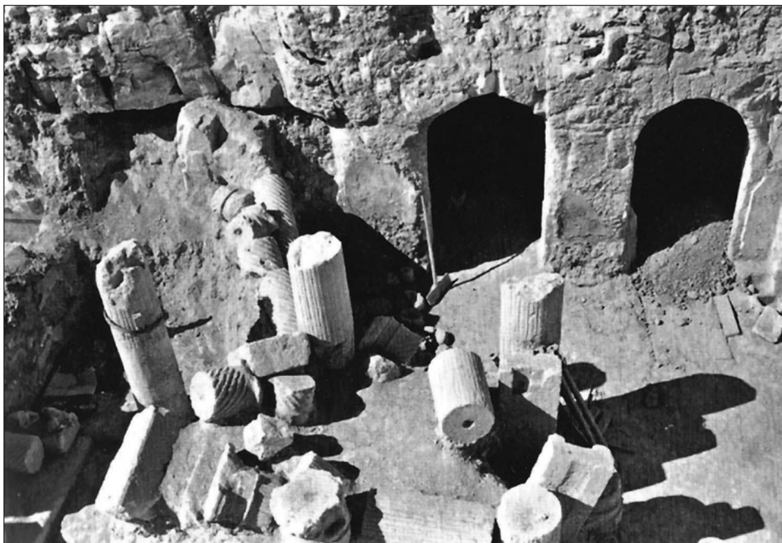
Fig. 7. Entrée des pièces rupestres A12-A16=P36-P40, dans la Maison de Poséidon.

Les habitudes régionales restent fortes, dans la construction des maisons, mais elles intègrent parfois aussi des nouveautés techniques qui viennent d'Occident de façon certaine (briques) ou plus hypothétique (variante de l' opus Africanum ) ainsi que des préoccupations nouvelles qui apportent leur contribution à la mise en place de nouvelles formules architecturales. On peut cependant noter que ces nouveautés techniques semblent relativement ponctuelles et tardives dans l'ensemble, bien postérieures à l'intégration du site dans l'Empire romain.