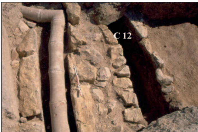
Fig. 4. Canalisation C12, dans l'angle nord-est du péristyle A6=P9.

Dans la Maison de Poséidon (Fig. 2), la stratigraphie et l'observation du bâti ont révélé que, lors d'une première phase, le péristyle P9 était plus grand qu'ultérieurement : il a été recoupé par la construction des pièces situées immédiatement à l'ouest (pièces B2-B4). La date de ce réaménagement est difficile à préciser. Pourtant, les pièces sont décorées de peintures qui peuvent être datées de l'époque sévérienne 29 . Autrement dit, le raccourcissement du péristyle a un terminus ante quem situé à la fin du II e s. ap. J.-C. De plus, un sondage (Fig. 2 et Fig. 4), conduit au nord-est du péristyle