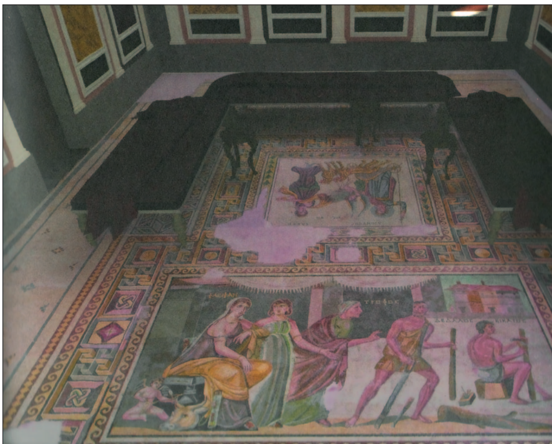
Fig. 10. Reconstitution du triclinium A1=P3 de la Maison de Poséidon.