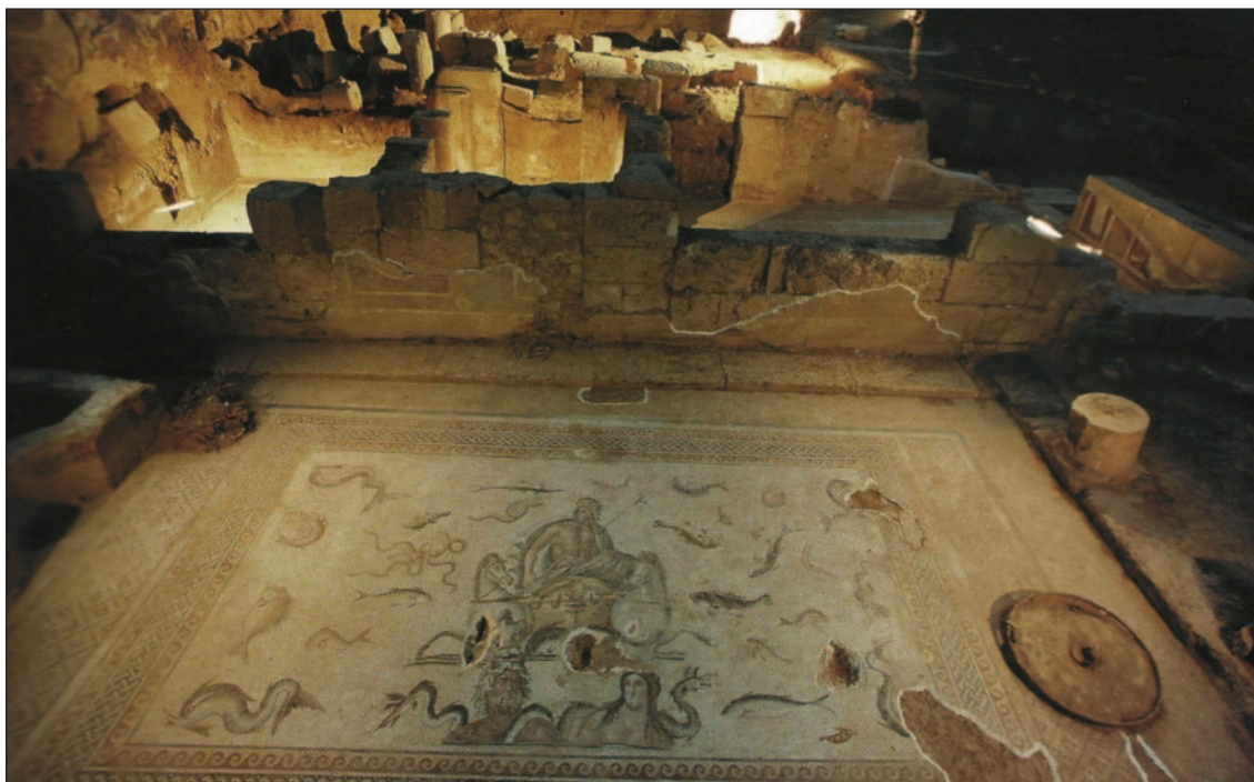
Fig. 8. Bassin et fontaine dans le péristyle A6=P9 de la Maison de Poséidon.

Zeugma, comme le montre le péristyle principal de la Maison de Poséidon : en effet, alors qu'il est interrompu par la construction de pièces à l'ouest, à l'époque sévérienne, on peut encore noter qu'une porte ouvre, lors de ce premier réaménagement, entre P 12 et P 9 98 , montrant ainsi que le bassin n'était pas encore installé à la fin du II e s. ; de même, dans la Maison de Dionysos et Ariane, le bassin mosaïqué est daté par le fouilleur de la fin du II e ou du début du III e s. 99 . Ainsi, la fonction du péristyle change en partie : certes, il reste lieu de distribution des pièces, mais il devient aussi lieu de repos, de rafraîchissement et de contemplation. Les peintures murales découvertes à Zeugma n'infirmement pas cette nouvelle fonction du péristyle. En effet, dans le grand péristyle de la Maison de Poséidon, il semblerait que l'on puisse interpréter les peintures sur chacun des côtés comme des représentations des Tropai (les Solstices) 100 , images du renouvellement de la nature et de ses dons. De même, le péristyle de la Maison des Muses est décoré d'enduits peints représentant, à l'est, des fleurs et des oiseaux 101 . Le péristyle devient ainsi un substitut de jardin. C'est une nouvelle fonction de cet espace qui n'est pas sans rappeler ce que l'on peut observer aussi dans les maisons occidentales 102 .