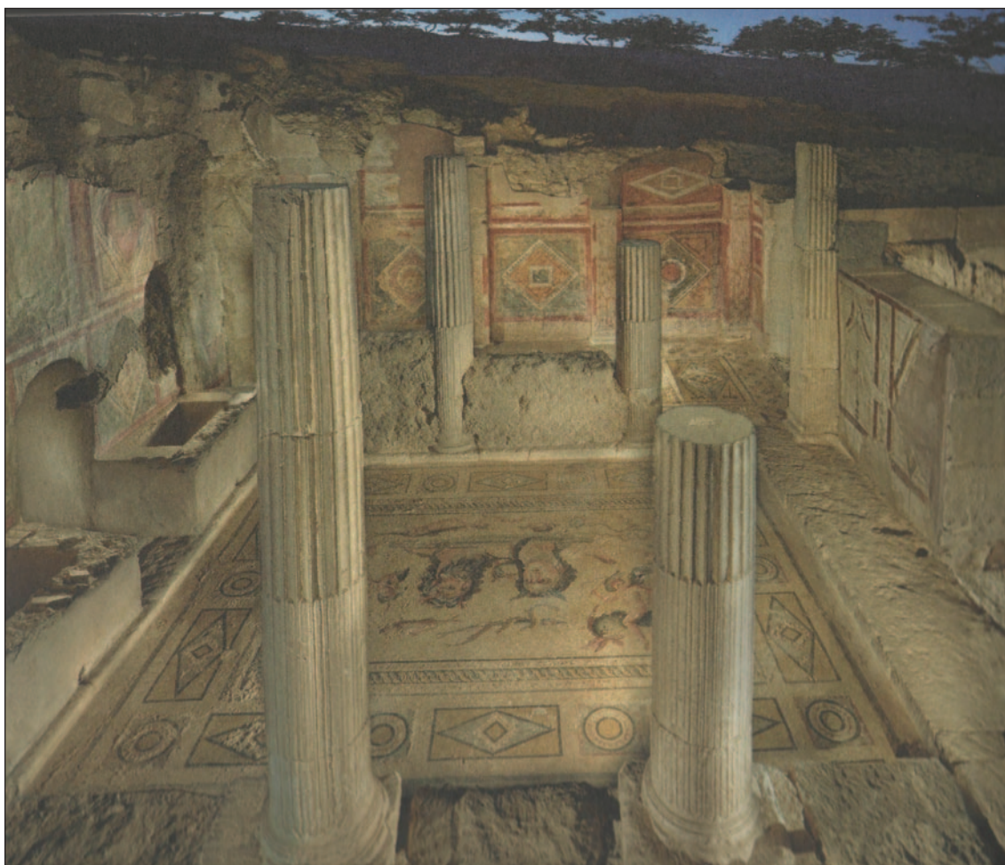
Fig. 9. Bassin et fontaine, dans le péristyle de la Maison des Muses (© Zeugma Archaeology Project).

(Fig. 9) 106 . Ce motif d'évolution du péristyle est bien connu dans l'architecture romaine, dans les domus de Pompéi en particulier peu avant 79, quand, souvent, des parapets ou des murs referment une galerie du péristyle et sont peints de jardins fictifs ou de scènes de chasse 107 . Malheureusement, à Zeugma, on ne sait pas quelle était la décoration de ces murs de fermeture qui furent, le plus souvent semble-t-il, ajoutés tardivement, entre la fin du II e et le milieu du III e s. 108 . Il est évident qu'on ne peut guère imaginer, sur ce site, de véritables jardins dans ces péristyles. Nous sommes dans un espace réduit : la population de Zeugma est dense, surtout sur un site en terrasse : il est d'autant plus difficile d'accueillir un jardin dans un péristyle que cela supposerait un arrosage important qui ne peut guère être mis en œuvre sur ce site. Ces fermetures de galerie répondent donc au modèle du jardin-péristyle tel qu'on le voit en œuvre dans la Casa delle Vestali de Pompéi 109 . En revanche, à Zeugma, nous n'avons pas pour le moment trouvé de vestige de jardinières qui accompagnent souvent ces dispositifs ce qui, étant donné le climat plutôt aride, n'a pas de quoi nous étonner.