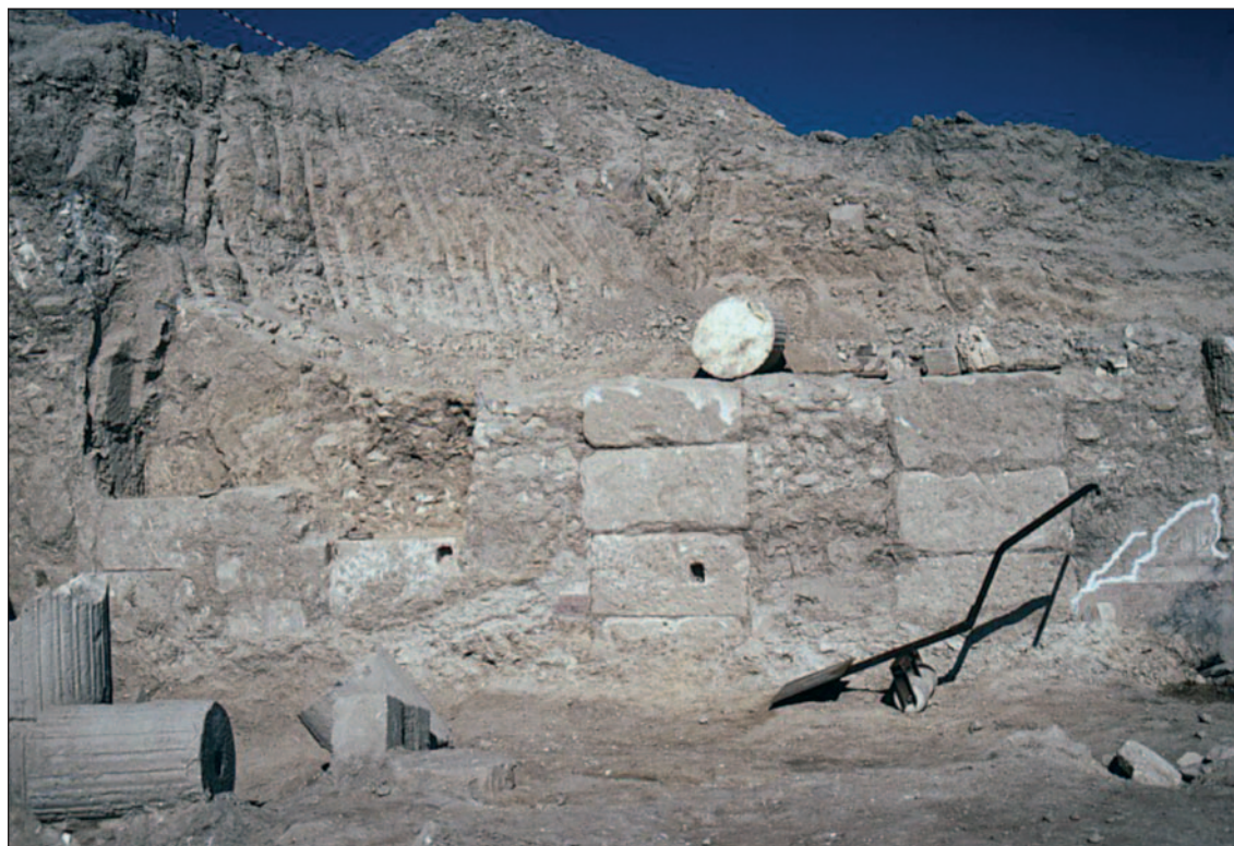
Fig. 5. Mur ouest de la pièce C10=P24 dans la Maison de l'Euphrate, en cours de fouille.

toute façon, marquerait une rupture nette par rapport aux pratiques antérieures des artisans constructeurs.