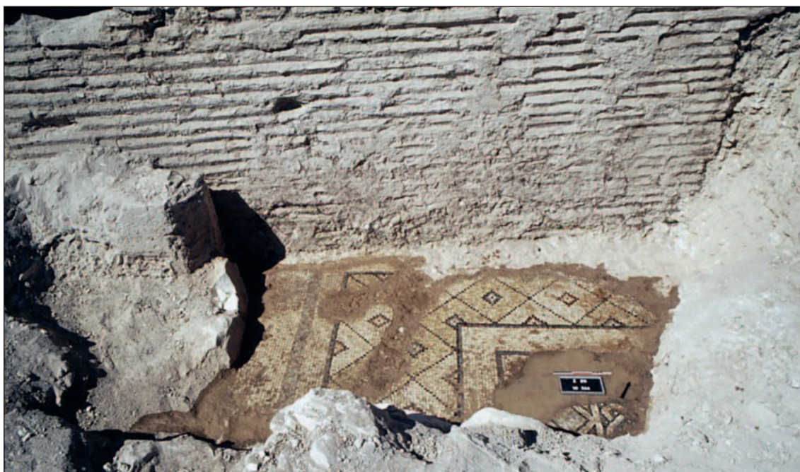
Fig. 6. Murs en briques dans le chantier 10.

D'autre part les traditions anciennes restent vivaces. Ainsi, l'utilisation des briques de terre crue, attestée de façon certaine au I er s. 77 , continue pendant les II e et III e s. comme le montrent les derniers états des maisons de Zeugma. Les premières assises des murs sont faites de gros blocs de calcaire local, mais toute la partie haute de l'élévation (à moins que ce ne soit l'étage) est construite en briques de terre crue 78 , à moins que ce matériau ne soit utilisé dans les remplissages entre les chaînages 79 , voire pour la construction de cloisons 80 ou pour le blocage de portes 81 . Parfois pourtant, on trouve, tardivement, quelques exemples de constructions en briques cuites. Cependant, il s'agit le plus souvent d'ajouts limités ou de réparations tardives (Fig. 6) 82 . La brique de terre cuite n'a pas constitué une technique de construction véritablement largement diffusée à Zeugma à l'époque romaine.