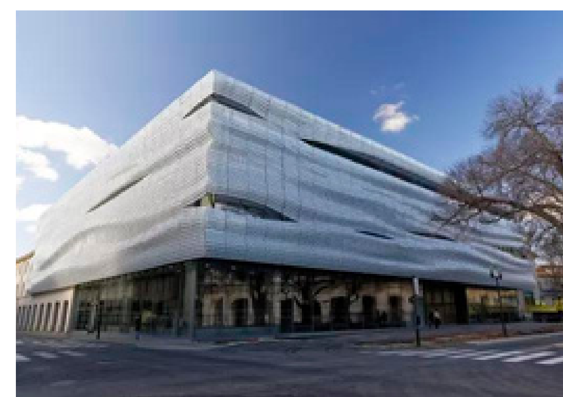
Musée de la Romanité