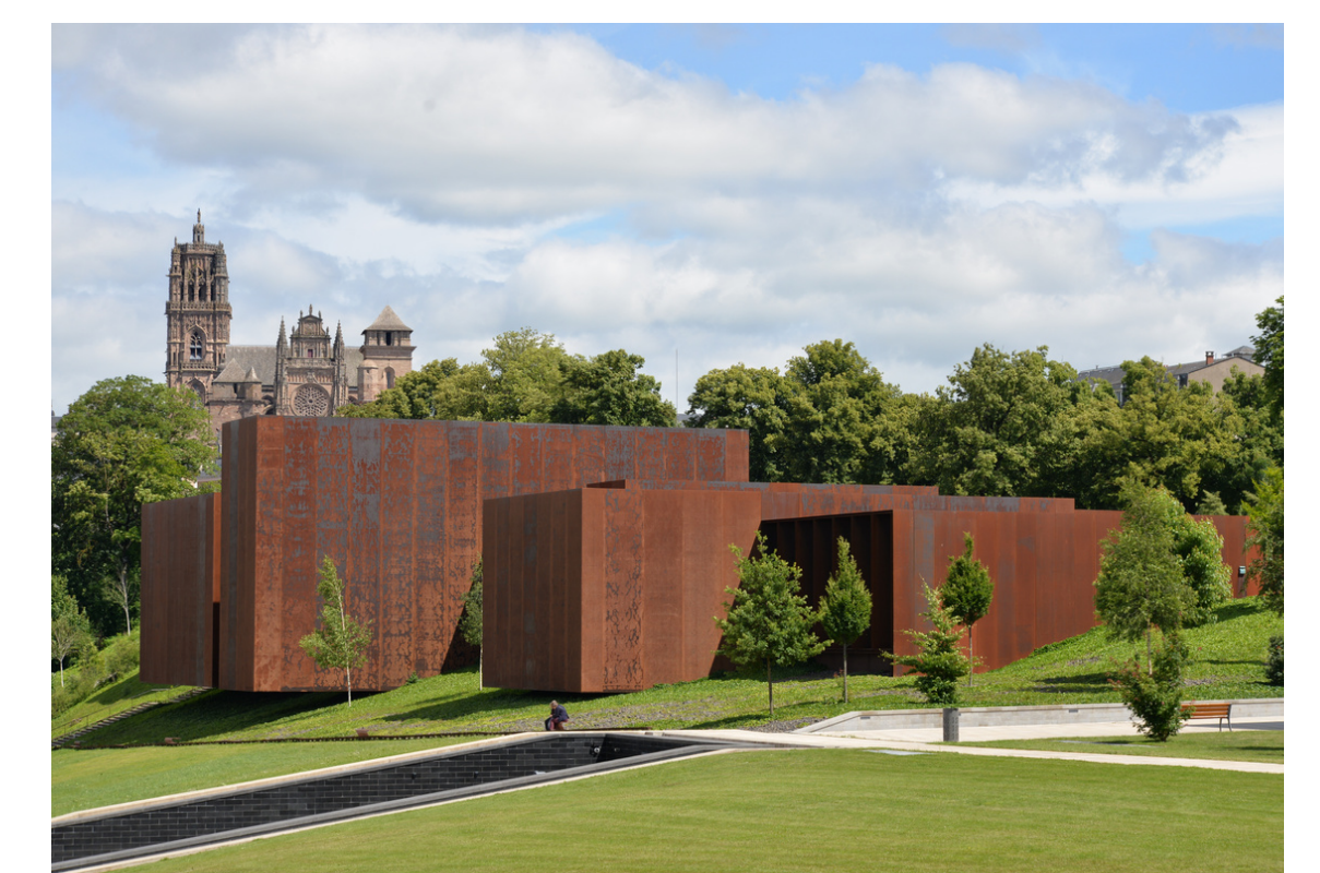
Musée Soulages