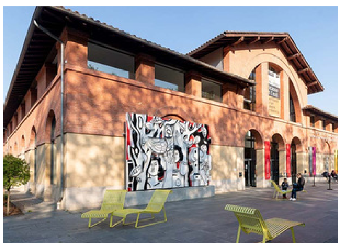
Les Abattoirs, Musée - Frac Occitanie Toulouse