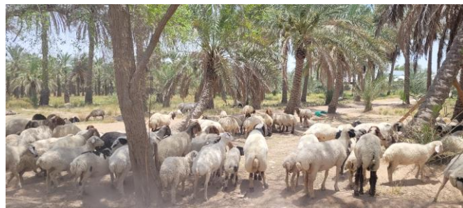
Figure 5 : Troupeau de mouton sous la palmeraie de la ferme 2 par temps très chaud.

Les 500 moutons (figure 5) sont de races awassi et sumali qui sont adaptées à la chaleur grâce notamment à leur réserve de gras dans la queue et dans le cou (sumali). Seule la viande est valorisée dans cette ferme avec des moutons vendus à 10-12 mois. Ils sont nourris d'orge et de son de blé importés, d'herbe pâturée sous les palmiers, de foin de luzerne (figure 6) et de foin de rhodes grass ( chloris gayana ) en partie produit sur la ferme. Lors des journées les plus chaudes, les moutons sont emmenés sous les palmiers où il y a davantage d'air et de fraîcheur que dans les bâtiments (cour fermée avec auvent).