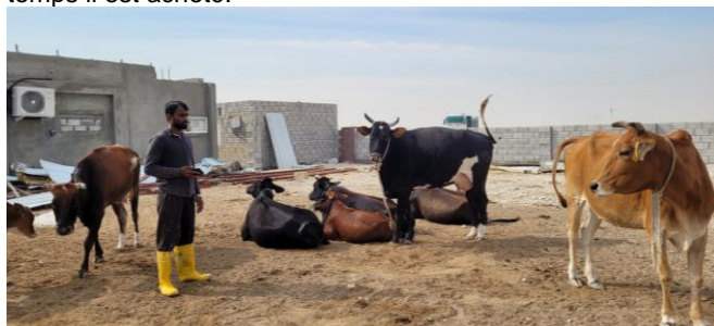
Figure 8 : Troupeau de vaches « locales » dans leur enclos avec en arrière-plan le ventilateur de la pièce climatisée.

Les vaches sont de races 'locales' indéfinies. Elles sont élevées en plein air dans une cour fermée avec un petit auvent. Elles ont accès à une pièce climatisée ouverte pendant la période chaude où elles peuvent librement aller et venir (figure 8). Les petits ruminants restent eux à l'ombre d'un toit en feuilles de palmier. La ration des vaches se compose d'environ 80% de fourrage et 20 % d'aliments à base de son de riz importé d'Asie. Le fourrage produit sur la ferme (rhodes grass) permet de nourrir en partie les animaux en hiver, le reste du temps il est acheté.