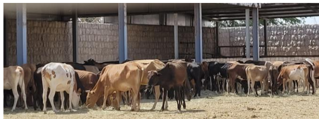
Figure 7 : Troupeau de jeunes bovins dans son enclos.

Les vaches sont des croisées européennes. Les croisements brunes suisses x jersiaises sont reconnus comme permettant une bonne production et une bonne résistance à la chaleur. Les bovins ne pâturent pas et reçoivent une ration similaire aux ovins. Les jeunes sont gardés à l'extérieur dans une cour fermée, avec un auvent sur la périphérie (figure 7). Les veaux sont vendus entre 8 et 12 mois autour de 150 kg. Les vaches en lactation bénéficient probablement d'un bâtiment rafraîchi.