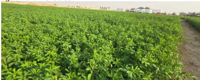
Figure 10 : Luzerne irriguée au goutte à goutte dans la ferme 4.

Les animaux sont logés dans une cour avec un auvent en tôle partiellement fermée sur 3 côtés pour abriter les animaux des vents forts. Les animaux ne sortent plus pâturer sous les palmeraies en raison des risques de prédation des chiens errants et des difficultés à guider les troupeaux à travers la ferme sans qu'ils n'abiment les cultures. L'alimentation se compose d'1 kg de son de blé et orge par jour et par brebis, de 0.5 à 1 kg de de luzerne et d'un peu d'herbe récoltée sur la ferme (figure 10). Le son blé est supprimé en période chaude et remplacé par de l'orge afin de limiter la chaleur dégagée par la rumination. Les quantités de fourrage distribuées sont également inférieures.