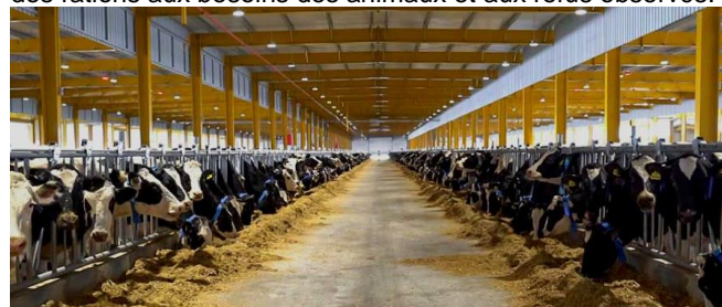
Figure 3 : Vue d'un bâtiment vache laitière de la ferme F1.

Cette ferme mise sur des vaches avec de hauts potentiels de production laitière. Les holsteins sont inséminées avec des paillettes importées des Etats-Unis. Les génisses de renouvellement et quelques veaux mâles sont élevés sur la ferme. L'objectif est de maintenir une production élevée toute l'année. Les bâtiments sont refroidis entre 25°C et 30°C grâce à de gros ventilateurs placés devant des lames d'eau qui coulent en continu pendant plus de six mois de l'année (figure 4) ainsi que des ventilateurs placés au milieu des bâtiments. La ferme n'a pas de surface agricole et importe l'ensemble de son fourrage principalement d'Espagne, des Etats-Unis et d'Afrique du Sud. Les fourrages sont stockés à température ambiante ce qui engendre une dégradation rapide de leur qualité et un risque important d'inflammation avec la chaleur. Elle possède sa propre usine d'aliments pour ajuster la qualité des rations aux besoins des animaux et aux refus observés.