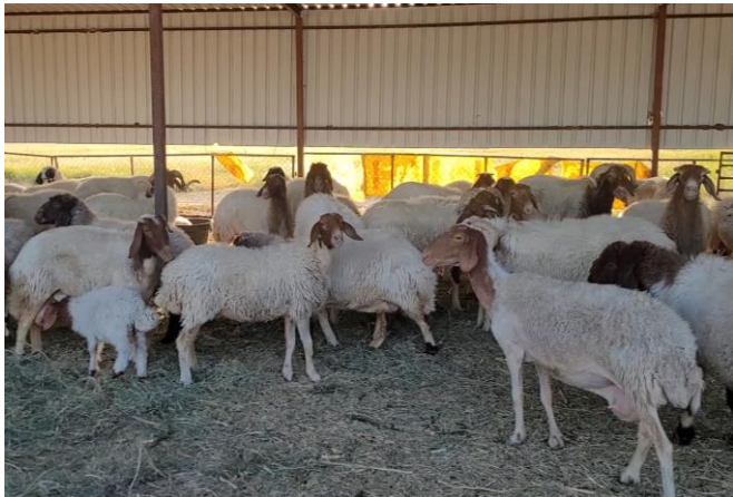
Figure 9 : Troupeau d'awassi prise par 48°C sous leur abri.

Les moutons awassi « améliorés » ont été récemment importés d'Irak afin d'avoir des brebis avec un bon potentiel laitier (figure 9). Les brebis produisent un agneau par agnelage. Jusqu'à 3 agnelages en 2 ans sont effectués. Il est à noter que l'éleveur doit souvent soulever la queue des brebis afin de faciliter l'accouplement et l'agnelage, ce qui demande beaucoup de présence. Les agneaux qui sont vendus sont nourris par leur mère jusqu'à 3 mois, les autres sont sevrés à 1 mois afin de réserver le lait pour la traite qui peut s'étaler sur 6 mois. La reproduction et la lactation sont évitées pendant la saison la plus chaude. C'est une période où finalement les animaux reprennent de l'état en raison de leurs plus faibles besoins alimentaires.