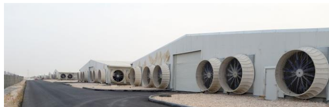
Figure 4 : Ventilateurs à l'entrée des bâtiments de la ferme F1.

Résultats. Ce système permet de produire une grande quantité de lait toute l'année avec des performances par vache très élevées (12 000L/lactation en moyenne avec un objectif d'un vêlage par an et 30% de réforme) avec des aliments 100% importés. Il repose sur une consommation d'eau et d'énergie très élevée qu'il faudrait pouvoir estimer par litre de lait produit.