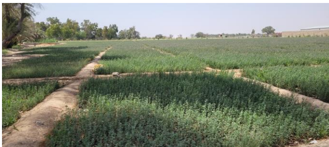
Figure 6 : champs de luzerne cultivée en bassin

Les vaches sont des croisées européennes. Les croisements brunes suisses x jersiaises sont reconnus comme permettant une bonne production et une bonne résistance à la chaleur. Les bovins ne pâturent pas et reçoivent une ration similaire aux ovins. Les jeunes sont gardés à l'extérieur dans une cour fermée, avec un auvent sur la périphérie (figure 7). Les veaux sont vendus entre 8 et 12 mois autour de 150 kg. Les vaches en lactation bénéficient probablement d'un bâtiment rafraîchi.