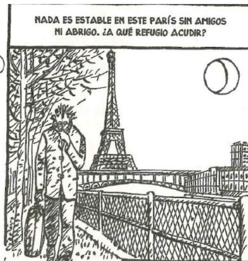
Fig. 3 Á. De la Calle, Pinturas de guerra , p. 215-2.

En ambos casos, el texto cumple lo que Roland Barthes designó como una fonction de relais 22 : sostiene la imagen y ayuda a descifrarla de manera inequívoca. Y lo que nos dice el texto, en sendos paneles, es que la movilidad que caracteriza la aprensión del espacio urbano en Pinturas de guerra , para el exiliado es una simple forma de la errancia. El contraste con las viñetas mudas que representan a Ángel caminando por la ciudad es significativo, ya que, a falta de texto, éstas quedan ampliamente abiertas a la interpretación.