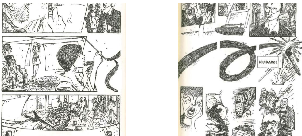
Fig. 6 Á. De la Calle, Pinturas de guerra , p. 66 y 67.

Las intervenciones autorrealistas contribuyen de manera terminante a la resemantización del espacio urbano otrora neutralizado por la mirada de Ángel, y en particular los carteles que pegan por todas partes. Unos representan el rostro del escritor francés Antonin Artaud, con quien se identifican; otros, los más, son obras personales: autorretratos insistentemente tratados in absentia . En efecto, nunca se plasman en el espacio de la viñeta, donde se reducen a carteles vacíos y hojas en blanco 45 . Punto álgido del segundo capítulo, la puesta en página de la performance autorrealista ( Fig. 6 ) saca partido de las potencialidades de las brechas visuales ofrecidas por estos autorretratos en blanco.