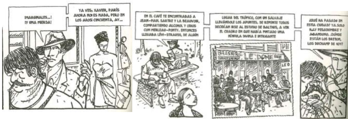
Fig. 5 Á. De la Calle, Pinturas de guerra , p. 220-2 y 220-3/5.

El caso de los tres autorrealistas, y de Xavier, el pintor mexicano, es muy distinto. Si bien son conscientes de la pérdida de aura de la ciudad, logran tocar del dedo lo que fue el genius loci de la capital francesa 35 . Para ellos, la peculiar atmósfera del París contemporáneo se cimentó en aventuras político-artísticas –en particular, pero no exclusivamente, en la revolución surrealista y el Mayo de 1968–, y ello aclara su entrañable vínculo con la urbe. Así, el fantasma del pintor surrealista Wolfgang Paalen, que acompaña la locura de Xavier, atrae su atención sobre un París extinto ( Fig. 5 ).