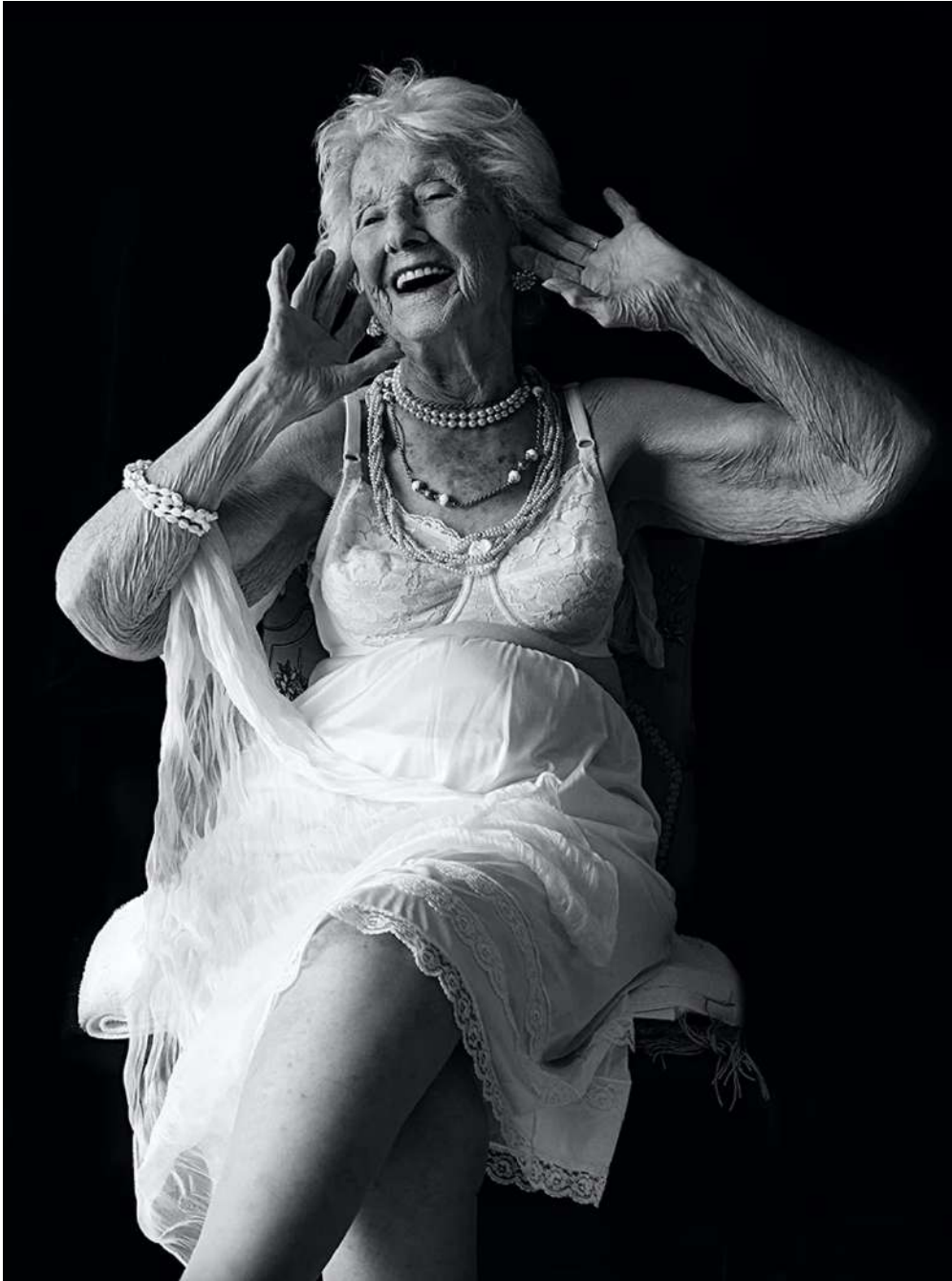
Arianne Clément, « Marilyn Monroe éternelle »

© Arianne Clément, avec son aimable autorisation [ https://www.arianneclément.com/ ].