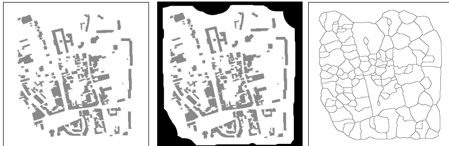
Figure 1. a) tissu urbain test, b) enceinte, c) squelette morphologique homotopique.

Les étapes fondamentales de ce travail étaient : la construction automatique d'enceintes plausibles d'un tissu urbain avec ou sans raccordement vers l'extérieur (systèmes de villes), et le calcul d'un graphe de voirie potentielle G (Figure 1) par squelettisation homotopique de l'espace inter-bâti (le sol) - qui est à l'image ce que le diagramme de Voronoï est à l'approche vectorielle (Decoret et al. , 2002). Nous avons aussi montré comment repérer automatiquement des cours d'eau d'une certaine importance qui traversent une ville de part en part. Mais notre plus forte contribution a été la détermination automatique des chemins et de leur type (résumée ci-après). Nous invitons le lecteur à consulter (Marsault, 2009) pour de plus amples détails.