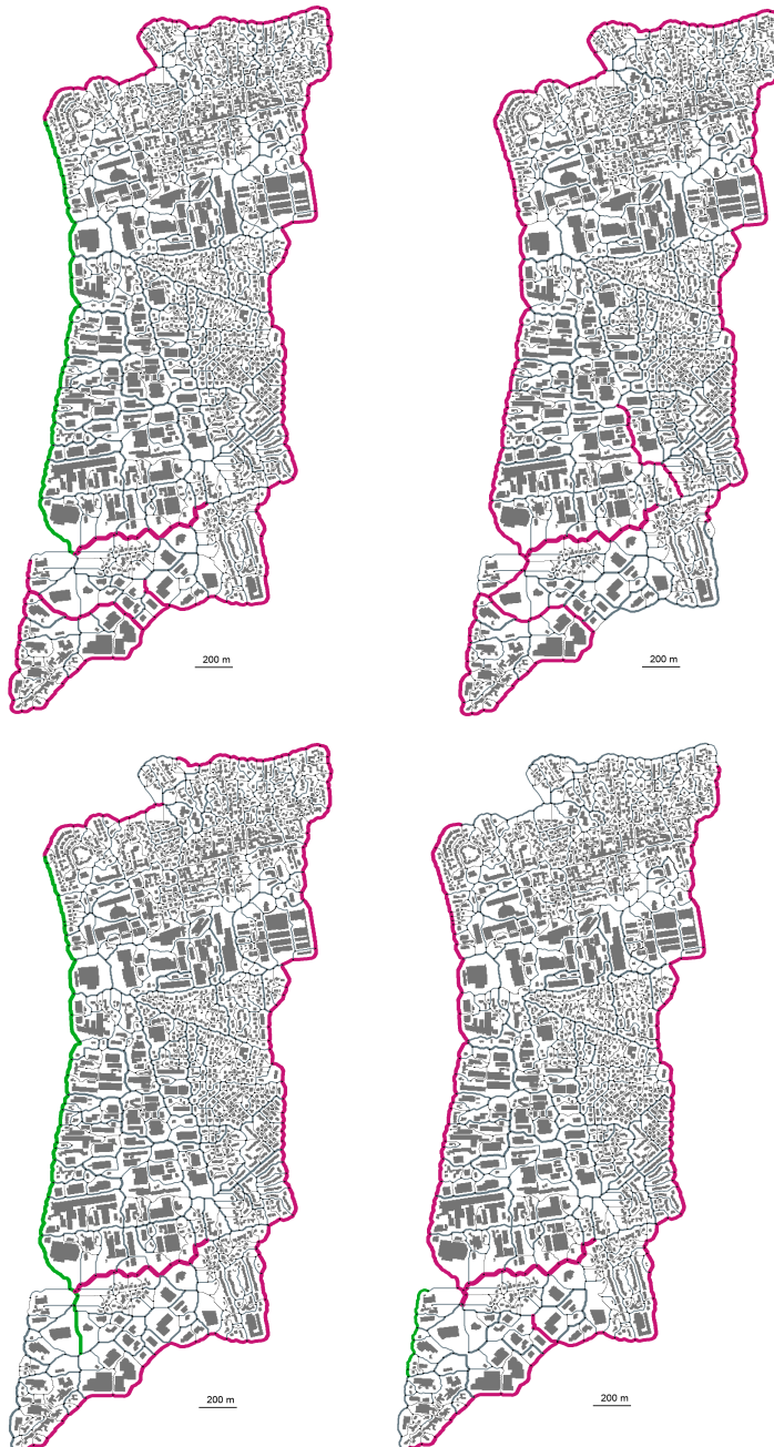
Figure 8. Optimisation des critères (18, 35, Pareto(30), Pareto(36)) sur une portion de la ville de Décines. Meilleures solutions sur 1000 cycles de calcul. Légende: gris clair (bâti existant), rouge (boulevards ou rocadés), vert (avenues), gris foncé (rues/ruelles) – rayons proportionnels aux largeurs des axes.