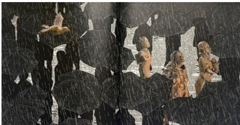
Figure 14 : De la terre à la pluie , texte et images, Christian Lagrange, © Seuil jeunesse