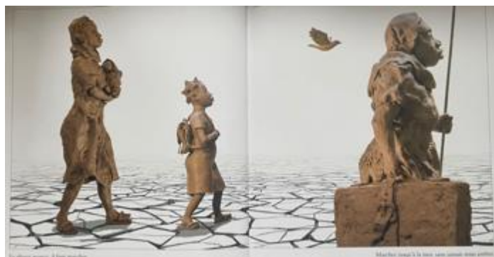
Figure 6 : De la terre à la pluie , Christian Lagrange, © Seuil jeunesse

Ces différents objets attachés au personnage peuvent être facilement repérés par les jeunes lecteurs du fait de leur caractère relativement bien identifié dans la culture enfantine et participent de l'identification du jeune lecteur à celui-ci. Cependant, leur fonction subjective pour le personnage ou leur caractère métaphorique appellent un travail d'interprétation complexe qui suppose un étayage fort de la part de l'enseignant pour susciter et faciliter les discussions entre élèves à ce sujet.