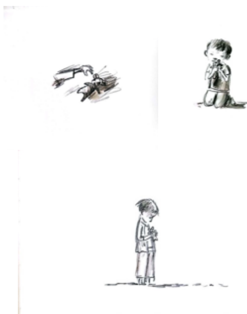
Figures 4 et 5 : Akim court , texte et illustrations : Claude Dubois, © Pastel