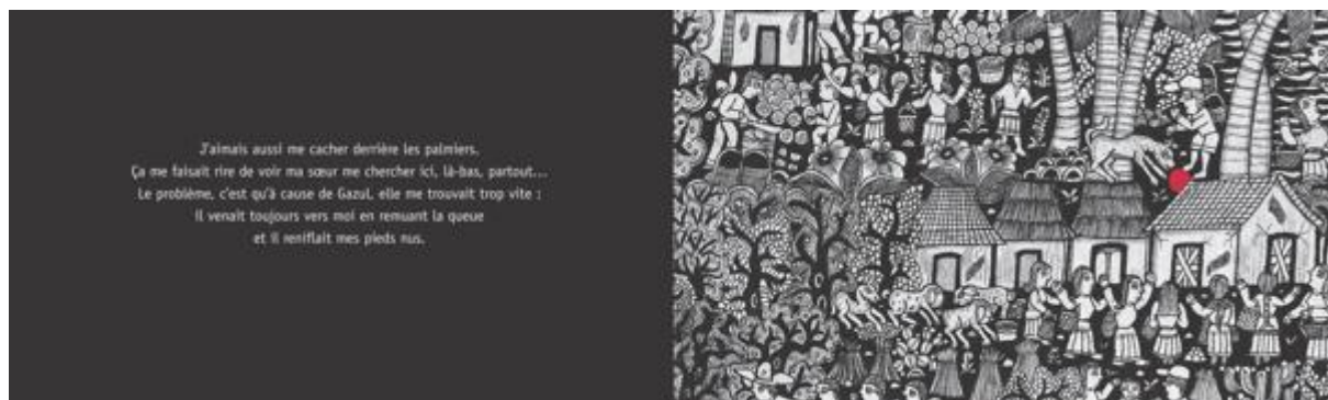
Figure 1 : Au pays de mon ballon rouge , texte : José Caldéron ; illustrations : Javier Martinez-Pedro© Rue du monde

« J'aimais aussi me cacher derrière les palmiers. Ca me faisait rire de voir ma sœur chercher ici, là-bas, partout... Le problème, c'est qu'à cause de Gazul, elle me trouvait trop vite : Il venait toujours vers moi en remuant la queue et il reniflait mes pieds nus. »