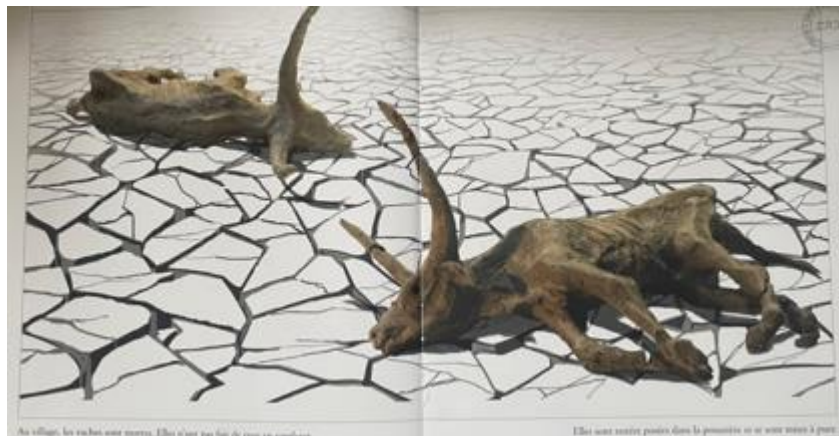
Figure 10 : De la terre à la pluie , texte et images, Christian Lagrange

Enfin, dans De la terre à la pluie , la représentation est beaucoup plus crue, directe et inquiétante, même si ce sont les animaux qui sont représentés morts dès les premières pages de l'album, préfigurant ce qui pourrait arriver aux hommes s'ils ne fuient.