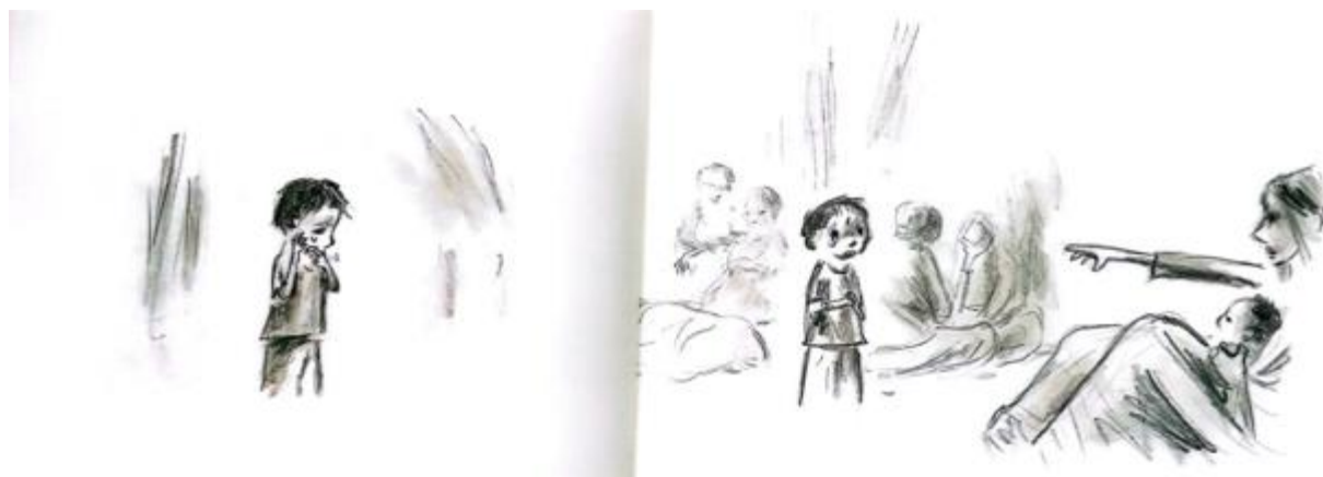
Figure 13 : Akim court , texte et illustrations : Claude Dubois, © Pastel

Dans son parcours dangereux, Akim rencontre deux femmes qui lui tendent la main alors qu'il se retrouve seul et abandonné : une jeune mère avec son bébé et une vieille femme épuisée qui l'accompagnent un temps.