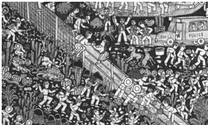
Figure 12 : Au pays de mon ballon rouge , texte : José Caldéron ; illustrations : Javier Martinez-Pedro © Rue du monde

Même dans les situations où les personnages rencontrent des obstacles et traversent des zones dangereuses, comme les héros d' Au pays de mon ballon rouge lorsqu'ils essaient d'entrer aux États-Unis tout en étant traqués par les gardes-frontières, l'entraide permet de continuer malgré tout.