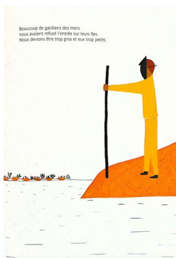
Figure 15 : Un autre rivage , texte et illustrations, Chloé Almeras, © Gallimard jeunesse