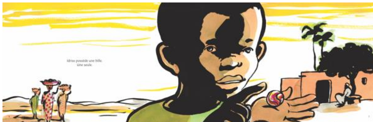
Figure 3 : La bille d'Idriss , texte : René Gouichoux, illustrations : Zaü, © Rue du monde

« Idriss possède une bille. Une seule. »