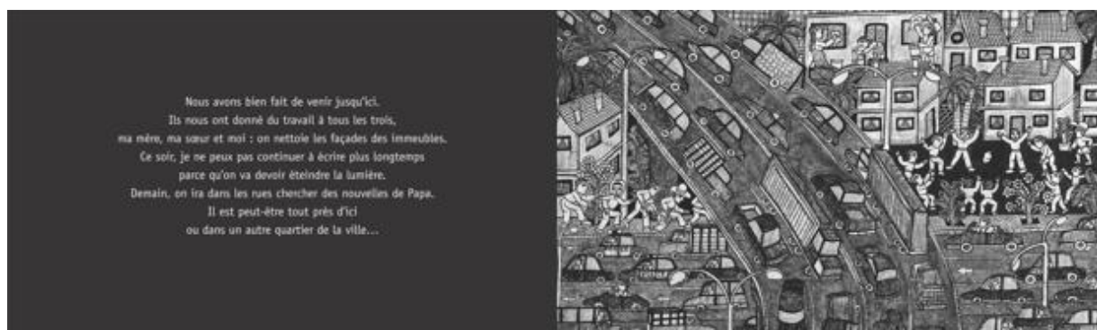
Figure 16 : Au pays de mon ballon rouge , texte : José Caldéron ; illustrations : Javier Martinez-Pedro© Rue du monde

De façon analogue, dans Au pays de mon ballon rouge , le texte entre en tension avec ce que nous montre l'image. Le soulagement déclaré de l'enfant qui énonce : « Nous avons bien fait de venir jusqu'ici. Ils nous ont donné du travail à tous les trois ma mère, ma sœur et moi : on nettoie les façades des immeubles », prend un autre sens dès lors que l'illustration nous montre d'autres enfants en train de jouer au ballon à proximité. Se retrouver travailleur sans papier sans pouvoir accéder à une vie d'enfant apparaît comme un destin certes moins tragique que la famine ou la mort en chemin, mais bien peu compatible avec la convention universelle des droits de l'enfant, par exemple.