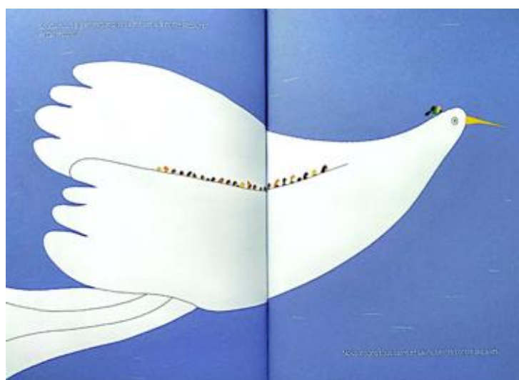
Figure 17 : Un autre rivage , texte et illustrations, Chloé Almeras, © Gallimard jeunesse

Ces différents exemples montrent bien que même si la structure du récit est linéaire, la compréhension de ces albums est parfois complexe. C'est notamment le cas lorsque l'image ne vient pas seulement redoubler ou illustrer le texte, mais introduit un hiatus ou des éléments supplémentaires qui ne sont pas immédiatement lisibles par de jeunes élèves ou bien lorsque, comme dans l'album Akim court , le texte n'est pas immédiatement accolé à l'image mais la précède ou la suit, nécessitant des retours en arrière dans la lecture pour saisir le sens et se repérer dans les étapes du parcours de l'enfant. Cette complexité, en même temps qu'elle constitue potentiellement une difficulté pour la compréhension des élèves est aussi un appel à prendre appui sur le collectif classe pour confronter et mettre à l'épreuve les diverses interprétations possibles de l'histoire, avec l'étayage de l'enseignant, et à développer par là un rapport sensible et réflexif aux œuvres.