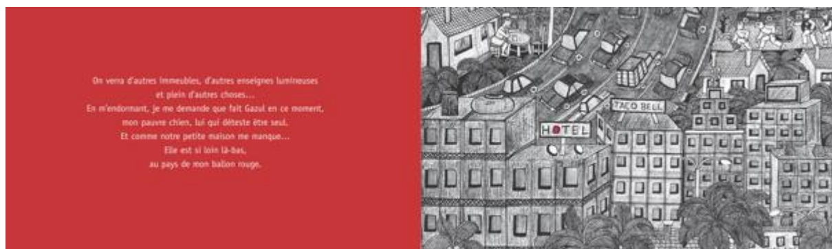
Figure 2 : Au pays de mon ballon rouge , texte : José Caldéron ; illustrations : Javier Martinez-Pedro© Rue du monde

« On verra d'autres immeubles, d'autres enseignes lumineuses et plein d'autres choses... En m'endormant, je me demande que fait Gazul en ce moment, mon pauvre chien, lui qui déteste être seul. et comme notre petite maison me manque... Elle est si loin, là-bas, au pays de mon ballon rouge. »