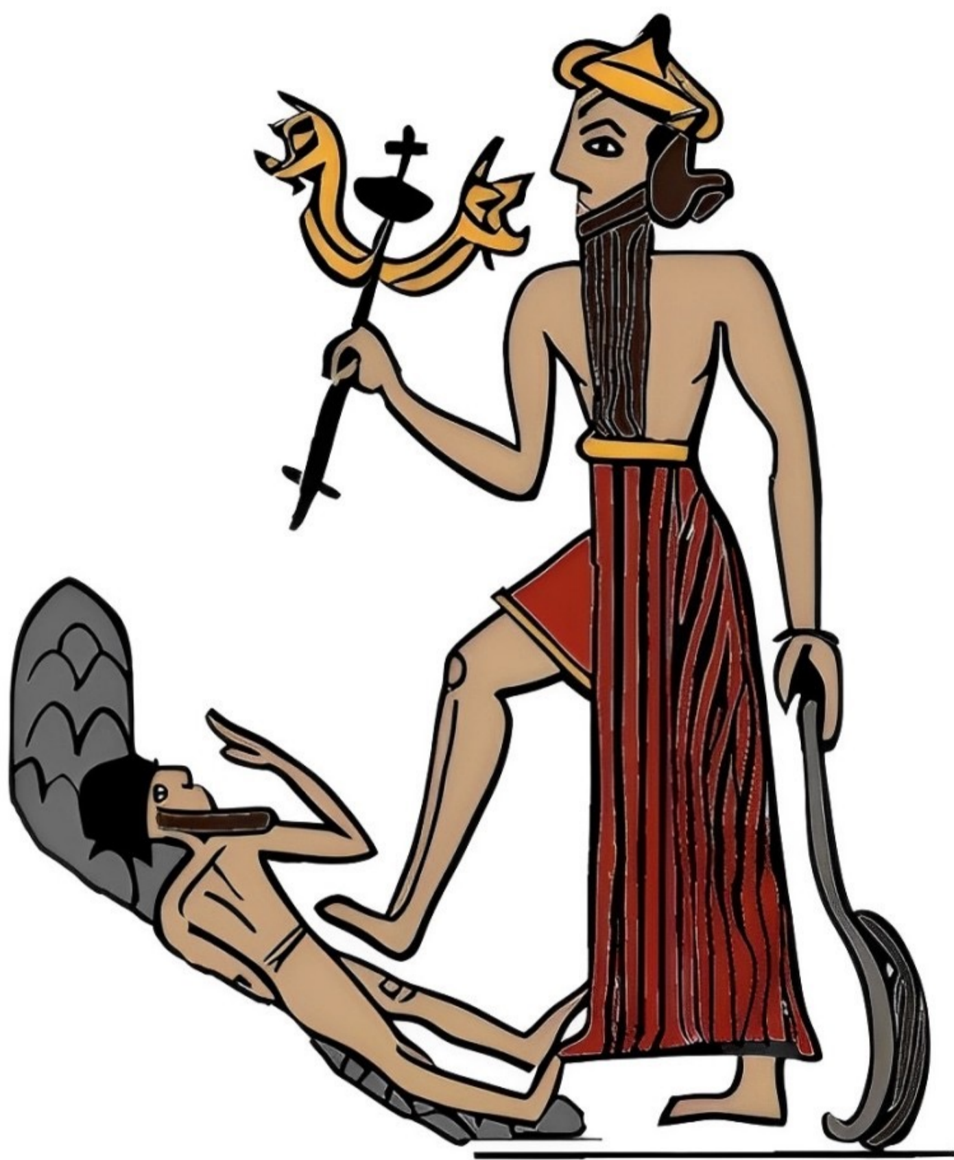
Nergal écrasant un ennemi, reproduction d'un sceau-cylindre de Larsa, début du II e m. av. J.-C. (© MARCHETTI 2024 d'après COLLON 2005 et WIGGERMANN 1998).