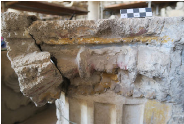
6. Pompéi, Granai del Foro. De la maison VII 6, 30. Détail du chapiteau ionique peint sur le bloc (inv. 25904)