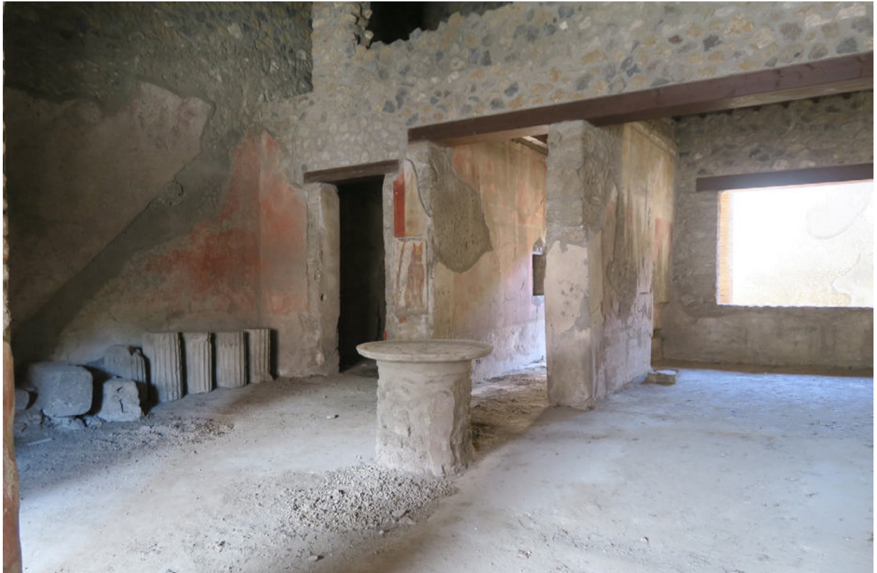
2. Pompéi, Caupona di Sotericus (I 12, 3). Atrium : vue générale de depuis l'angle nord-ouest. Sur le mur est, on aperçoit le négatif de l'escalier qui monte au premier étage, résultat, ce tel qu'on le voit aujourd'hui, d'une restauration de 1998