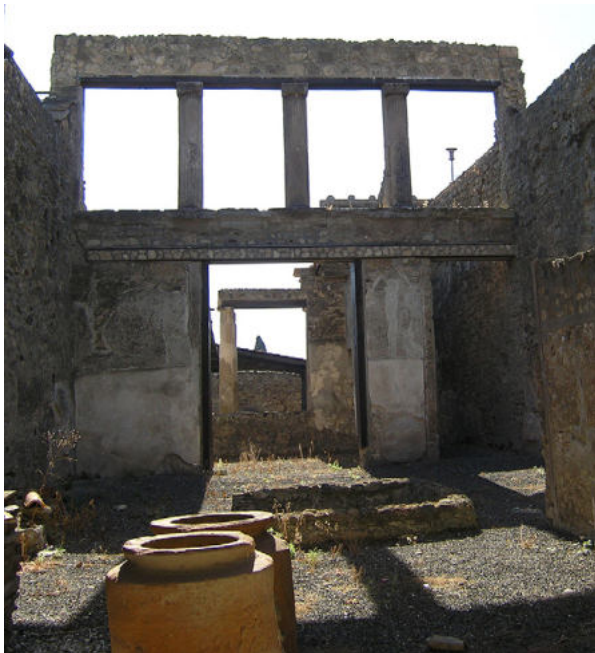
3. Pompéi, boutique I 6, 8-9. Atrium : vue générale depuis le Nord. Au Sud, le premier étage de l' atrium présente trois piliers avec demi-colonne engagée en encadrement d'ouvertures

avec le bouchage des mortaises pour la mise en œuvre du revêtement d'enduit peint présenté ici.