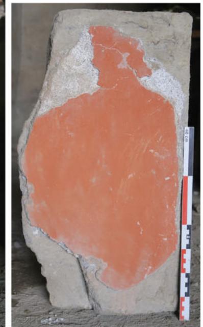
5. Pompéi, Caupona di Sotericus (I 12, 3). Face avant et arrière des blocs A, B et C avec leur décoration peinte conservée. On distingue le décor figuré à l'arrière des blocs A et B