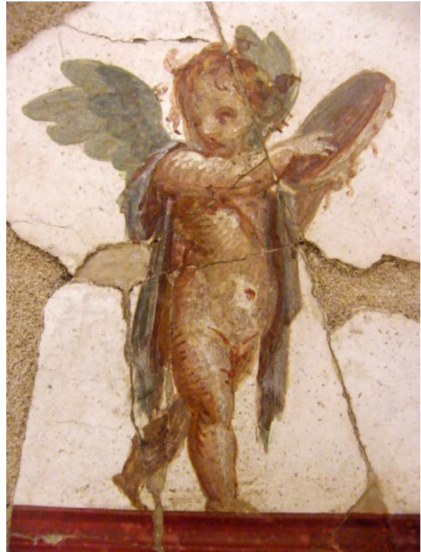
8. Stabies, Villa San Marco. Pièce 10 : petit amour avec tambourin

9, 12 23 , le cubiculum 12 de la Casa dell'Efebo (I 7, 11) et dans l' atrium de la Casa di Leda (V 6, 12) 24 pour ne citer qu'eux. Toutefois, un parallèle encore plus étroit peut être fait avec un amour situé en zone supérieure de la pièce 10 de la Villa San Marco à Castellammare di Stabia (fig. 8). Le corps est de face avec la tête tour-