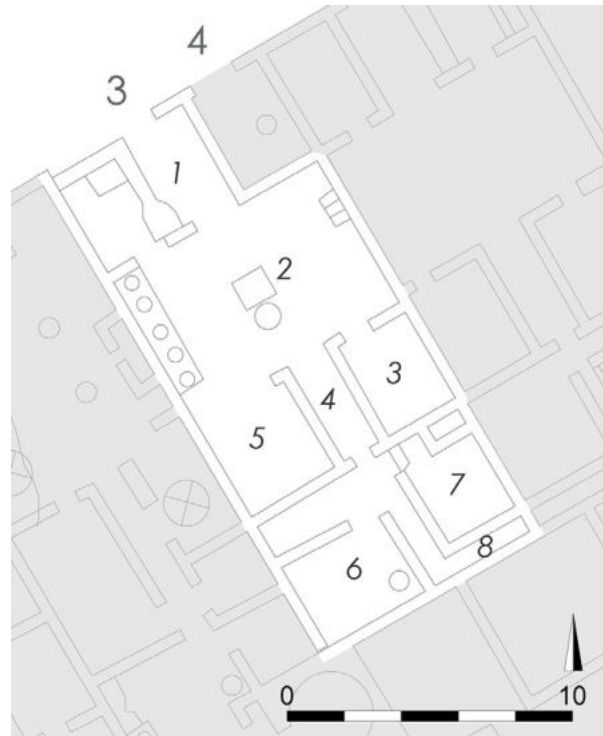
1. Pompéi, Caupona di Sotericus (I 12, 3). Plan (retravaillé par M. Covolan du plan RICA MAPS 1984, avec les numéros du PPM II, 701)

À Pompéi, on connaît d'autres exemples de piliers, non peints, qui décorent les premiers étages des atria . On les retrouve uniquement dans des maisons transformées, après le tremblement de terre de 62 ap. J.C. 14 , en édifices commerciaux (fig. 3 ; boutique I 6, 8-9 et Fullonica de Stephanus (I 6, 7). Dans les deux cas les édifices étaient, à l'origine, des maisons 15 . On peut donc supposer que les blocs étudiés ici appartiennent