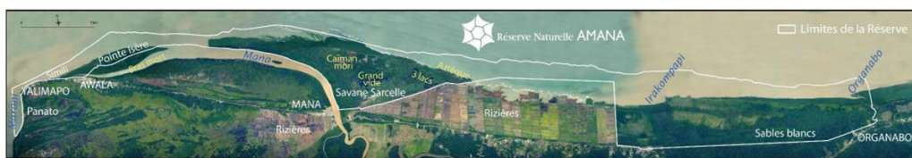
Carte 2 : RNA et lieux dits, Orthophoto DEAL 2012