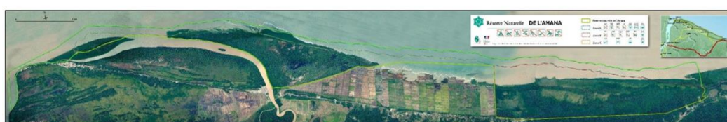
Carte 4 : Zonage de la RNA, Orthophoto DEAL 2012