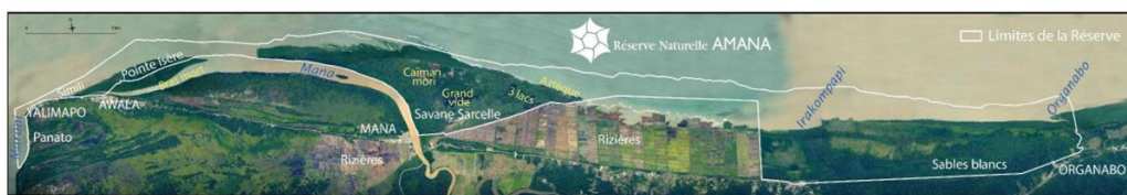
Carte 2 : RNA et lieux dits, Orthophoto DEAL 2012