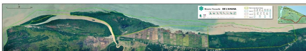
Carte 4 : Zonage de la RNA, Orthophoto DEAL 2012