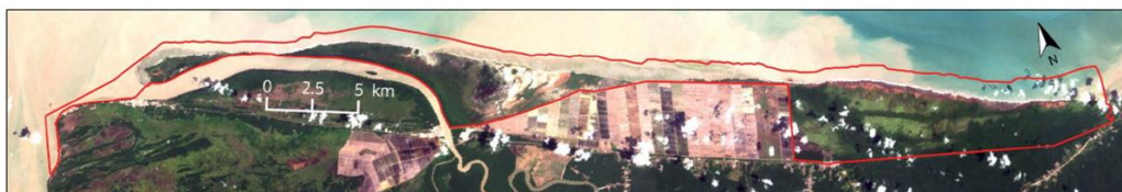
Carte 3 : Image satellite de 1999 et limites de la RNA (Landsat 5)