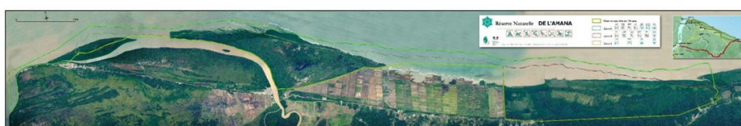
Carte 4 : Zonage de la RNA, Orthophoto DEAL 2012