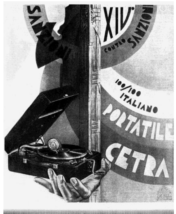
Abb. 1 Werbeanzeige aus der Fernsehzeitschrift Radiocorriere , 17.5.1936

Das Italienische der phonographischen Aufnahmen wird auch in einer Werbeanzeige der Plattenfirma Cetra thematisiert (vgl. Abb. 1). Kurz nach Kriegsende in Äthiopien publiziert, zeigt sie einen tragbaren Plattenspieler vor