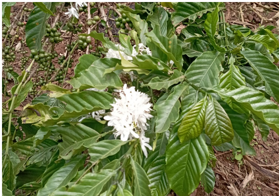
Caféier en fleurs. région centrale de l'Ouganda.

à la terre et leur transformation par un nouvel essor du titrage. Nous aborderons d'abord les grandes orientations politiques qui transparaissent dans les textes officiels émanant du ministère des terres (I). Nous analyserons ensuite la superposition des droits en discutant l'approche de la propriété utilisée dans la fabrication des données statistiques nationales et les transformations de la propriété dans les pratiques (II).