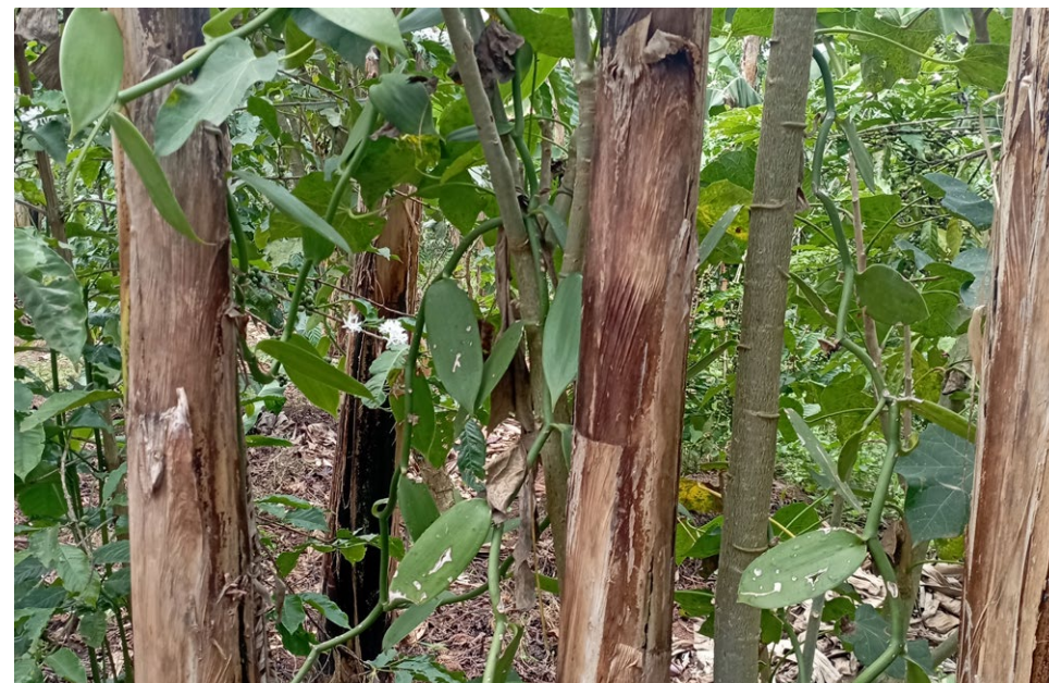
Vanille. Crédit photo : Valérie Golaz (2022), région centrale de l'Ouganda.

mailo rend les opérations de démarcation systématique très difficile, du fait de la superposition des droits fonciers qui ne sont pas tous documentés de la même manière. Du point de vue juridique, la reconnaissance de différentes formes de propriété superposées existe au Buganda. L'idée que ce système dual est incompatible avec la conception du progrès et du développement qui caractérise une élite et l'idée qu'il va disparaître de lui-même est répandue. Le cadre qui permet la transformation vers la pleine propriété est en place : aux acteurs de s'en saisir avec les appuis politico-administratifs nécessaires, avec pour conséquence le renforcement des inégalités.