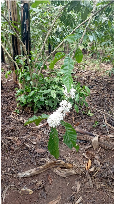
Un jardin ganda entretenu. Crédit photo : Valérie Golaz (2022), région centrale de l'Ouganda.

Le terme de mailo désigne dans les années 2010 à la fois des domaines définis par ce système dual, comprenant les droits distincts d'un détenteur de titre et de détenteurs de parcelle et des parcelles détenues en pleine propriété. Certaines terres sont héritées