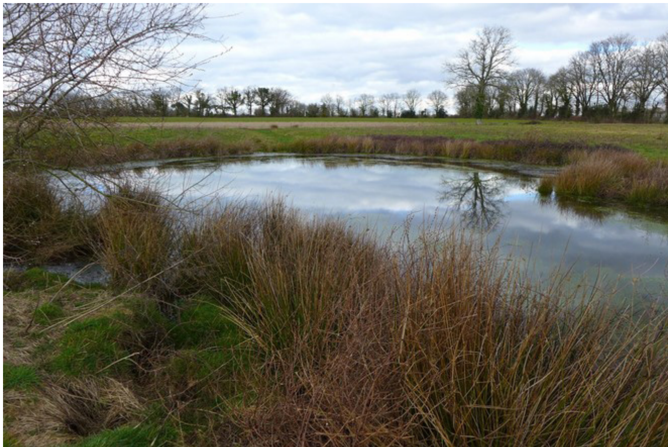
Fig. 1. — Exemple de milieu humide, Venansault (85).

8 août 2024]). La convention de Ramsar, quant à elle, s'appuie sur le traité international de 1971 entré en vigueur en 1975 et adopte une définition plus large que la réglementation française : les zones humides sont alors « des étendues de marais, de fagnes, de tourbières ou d'eaux naturelles ou artificielles, permanentes ou temporaires, où l'eau est stagnante ou courante, douce, saumâtre ou salée, y compris des étendues d'eau marine dont la profondeur à marée basse n'excède pas six mètres » ( http://www.zones-humides.org/entre-terre-et-eau/une-zone-humide-c-est-quoi/les-zones-humides-dans-le-droit-francais-et-inter , dernière consultation le 1 er juillet 2024). Dans cette étude nous considérerons comme milieux humides les milieux aquatiques continentaux d'eau douce uniquement (Fig. 1).