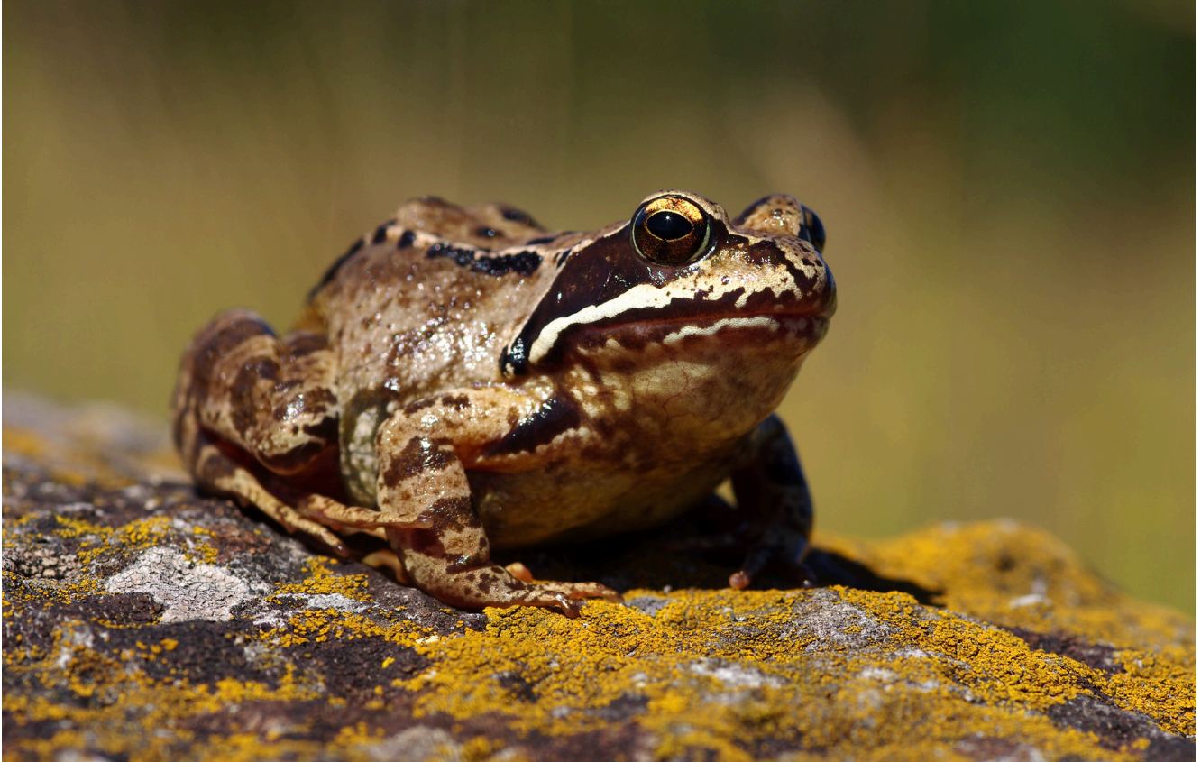
FIG. 3. — Grenouille rousse ( Rana temporaria Linnaeus, 1758), espèce sensible à RHV-3.

zoospores sont incapables de nager sur de longues distances (> 2 cm). Dans la nature, les mouvements d'eau (cycle de convections journaliers, vents, courants) pourraient permettre aux zoospores de se propager sur de plus longues distances mais elles peuvent aussi faire l'objet de prédation par d'autres organismes (Schmeller et al. 2014). Sur la base de résultats expérimentaux, les zoospores de Bd possèderaient également une capacité d'attraction à certaines substances, notamment les sucres, protéines et acides aminés, qui leur permettrait de rejoindre leur hôte par chimiotaxie (Moss et al. 2008).