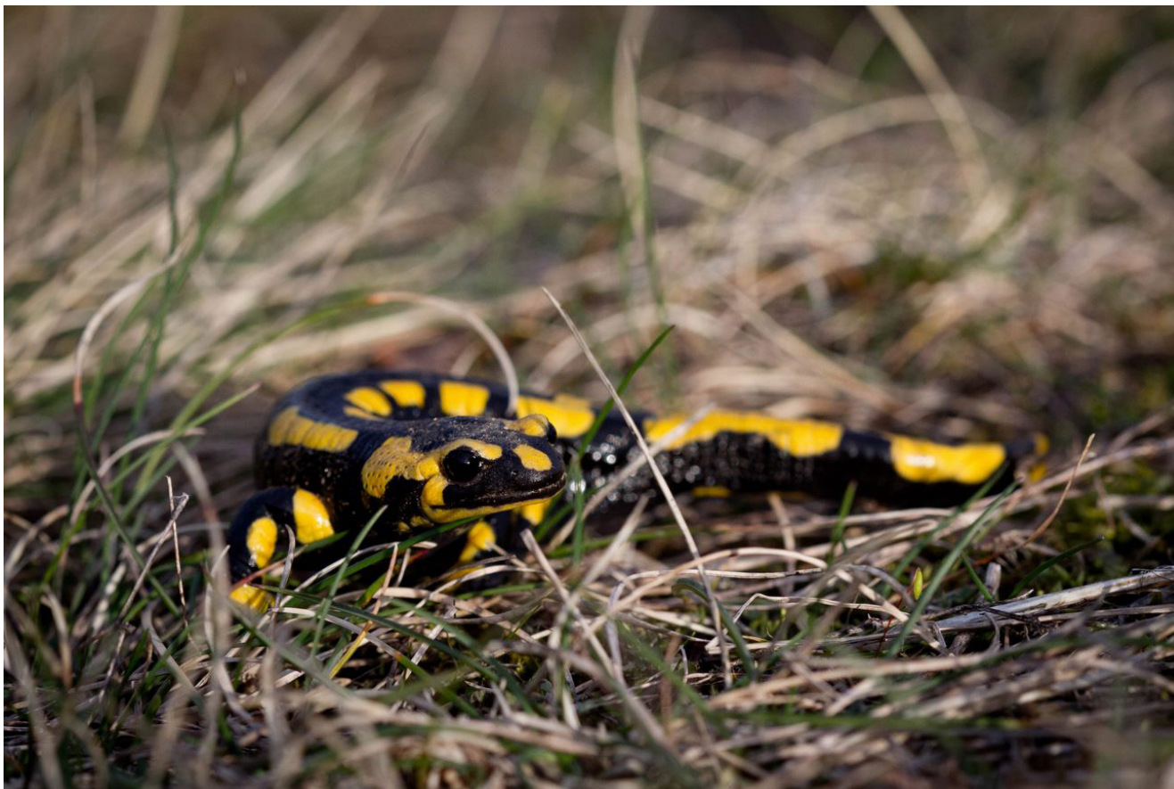
Fig. 2. — Salamandre tachetée ( Salamandra atra (Linnaeus, 1758)), espèce sensible à Bsal.

commun ( Lissotriton vulgaris (Linnaeus, 1758)) et le Triton marbré ( Triturus marmoratus (Latreille, 1800)) (Martel et al. 2014, 2020 ; Catenazzi 2015 ; Van Rooij et al. 2015 ; Spitzen-van der Sluijs et al. 2016 ; Yap et al. 2017).