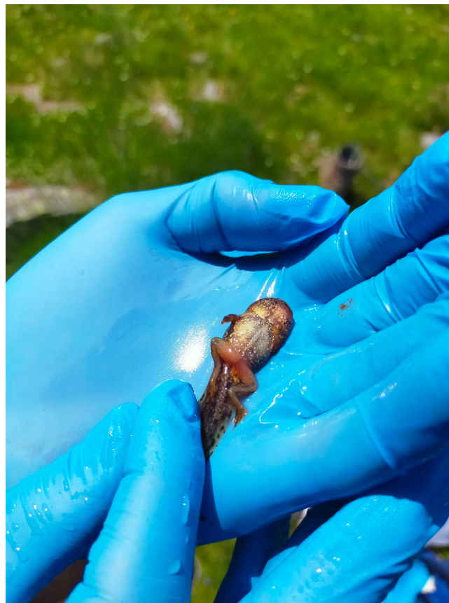
Fig. 5. — Manipulation d'un métamorphe Alytes accoucheur ( Alytes obstetricans (Laurenti, 1768)) avec des gants en nitrile.

Une désinfection bien gérée en fin de journée et réalisée au local prévient déjà d'une transmission d'agents infectieux par le matériel d'un jour sur l'autre. Celles réalisées sur le terrain lorsqu'un changement d'équipement n'est pas possible doivent être réfléchies en amont et la gestion de l'impact environnemental pris en compte. Les désinfections peuvent être réalisées entre deux unités écologiques, soit entre deux plans d'eau éloignés de plus de 500 mètres, valeur qui nous paraît pertinente et facile à mettre en place (Tableaux 2, 6), mais qui doit être adaptée au besoin à l'issue de l'étude de risques réalisée en amont de l'intervention. Le nettoyage