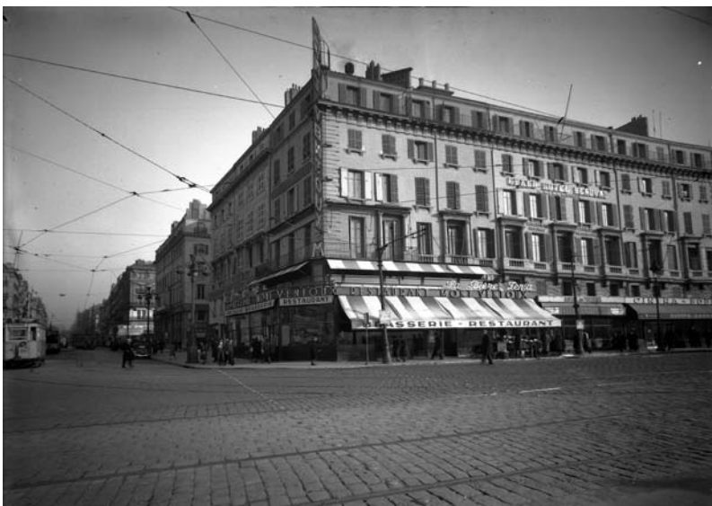
Fig. 3 : Marseille, 1940, quai des Belges : le café du Mont Ventoux, du Brûleur de Loups et le Cintra, Archives municipales de Marseille, côte 89 Fi 219-221