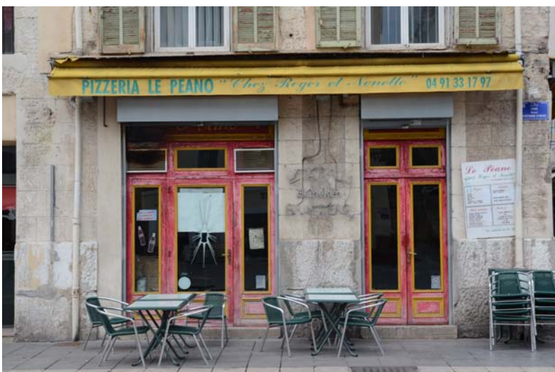
Fig. 4 : Le Péano, 17 rue Fortia (en 2011)