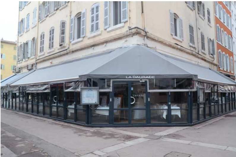
Fig. 2 : La Daurade, 8 place Fortia (en 2011)