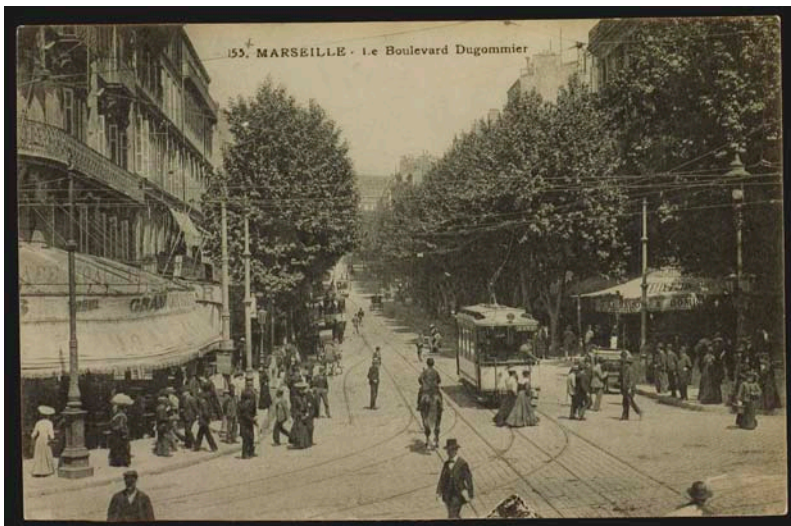
Fig. 5 : Noailles en 1907, archives municipales de Marseille 88 Fi 51