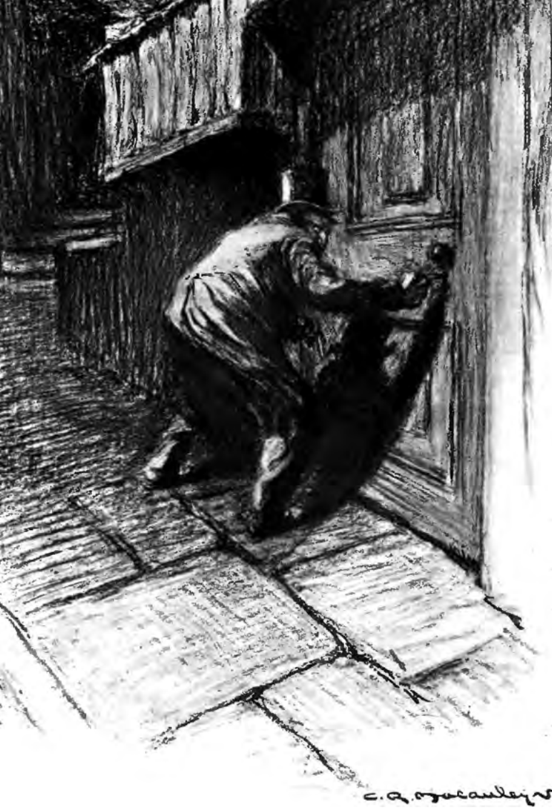
L'Étrange cas du Docteur Jekyll et Mister Hyde. Illustré par Charles Raymond Macaulay (1904).