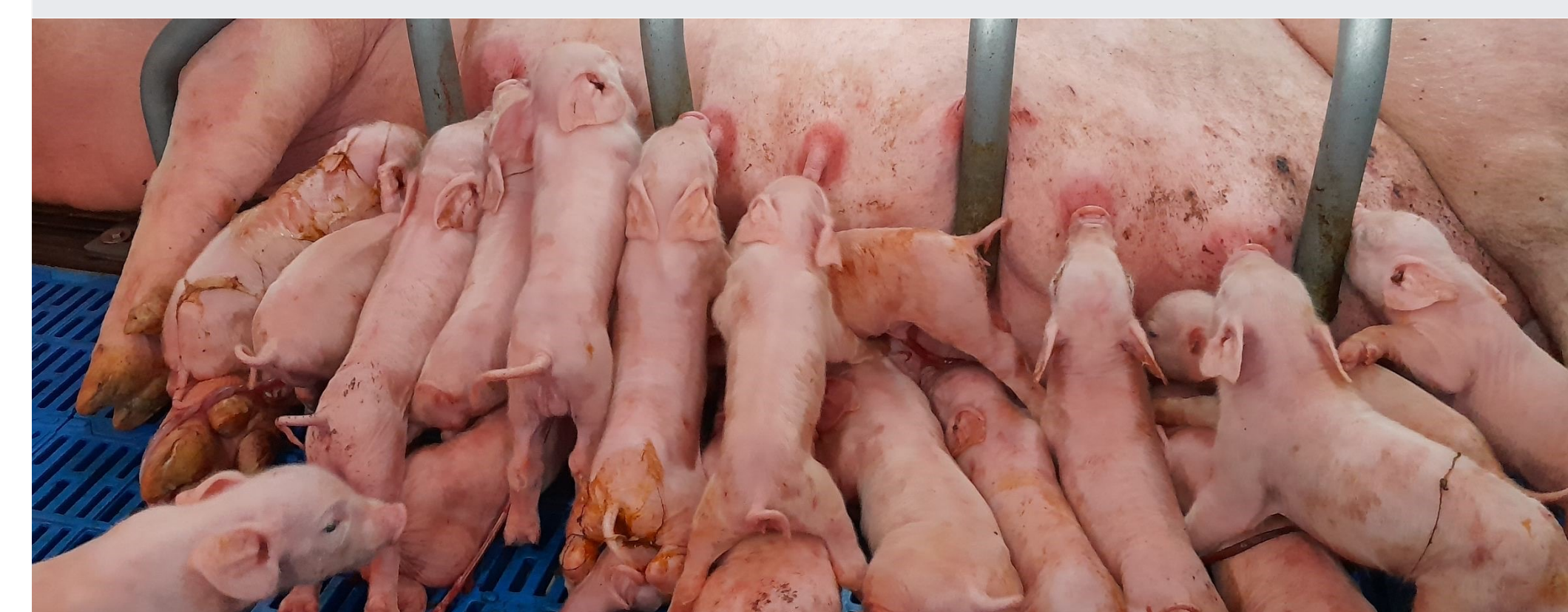
Avec une hypothèse de 16 tétines, 37% des portées ont au moins un porcelet surnuméraire (> 16 nés vivants) avant ajustements éventuels.

Grâce à son nouveau module de bilan des pratiques d'allaitement, PertMat offre des éléments d'expertise originaux et des références pour évaluer l'efficacité de la gestion des grandes portées. Pour améliorer la survie, PertMat est appelé à évoluer au-delà de l'analyse des simples données GTTT, pour décrire et évaluer qualitativement la diversité des pratiques d'élevage.