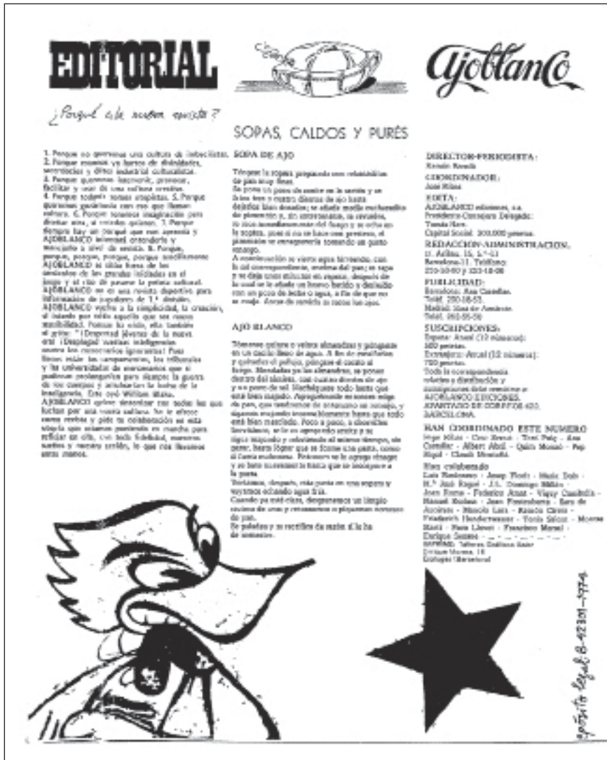
Ilustración 3. Ajoblanco nº 1, oct. 1974.