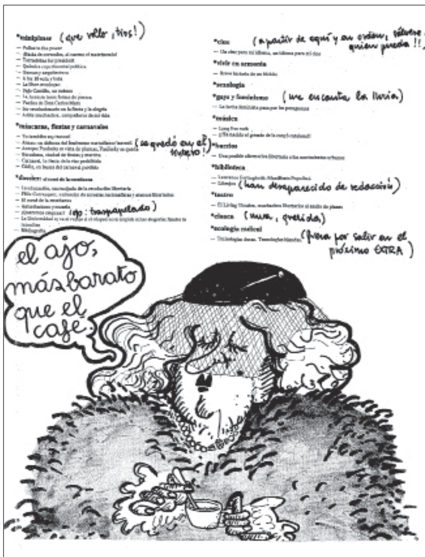
Ilustración 4. Ajoblanco n° 19, febrero 1977.

Ajoblanco (1974-1980), cuando la forma quiere ser fondo