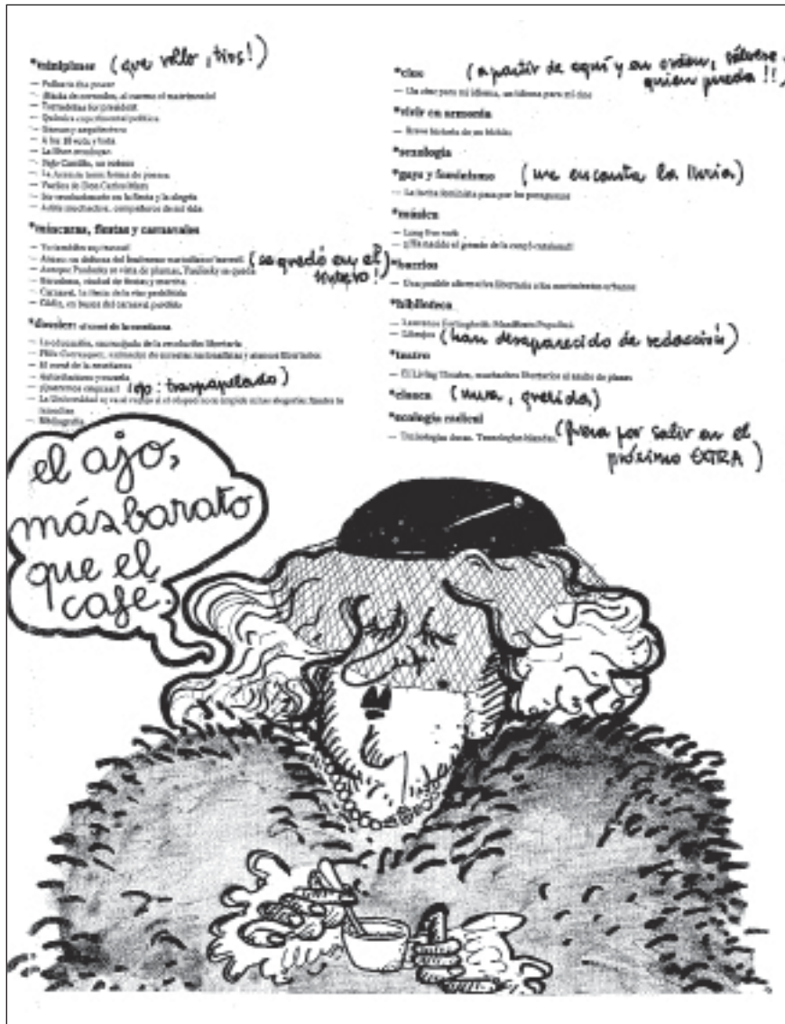
Ilustración 4. Ajoblanco nº 19, febrero 1977.

Ajoblanco (1974-1980), cuando la forma quiere ser fondo