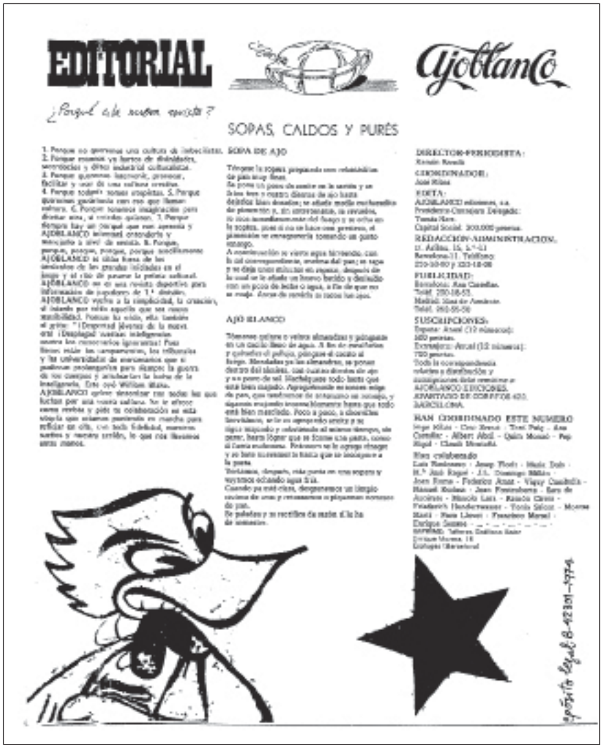
Ilustración 3. Ajoblanco nº 1, oct. 1974.