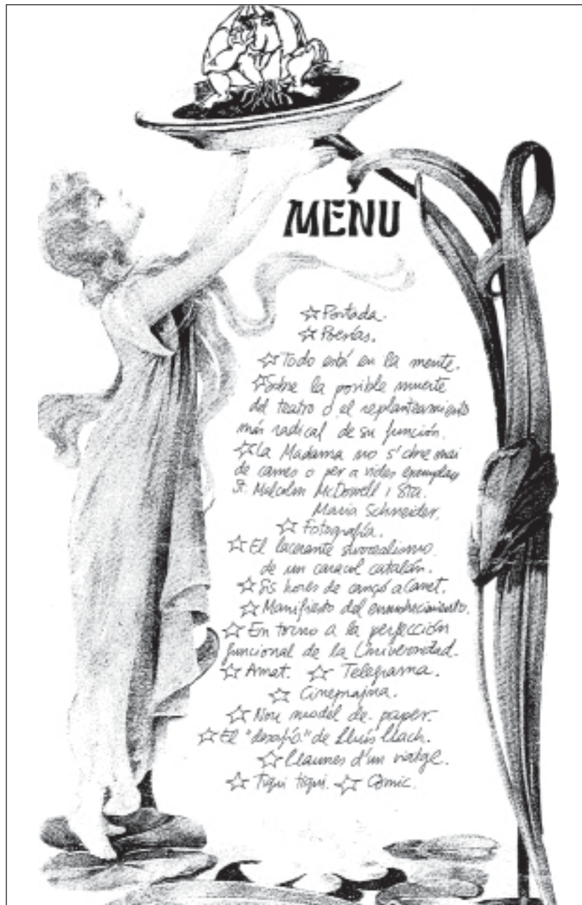
Ilustración 1. Ajoblanco nº 1, oct. 1974.