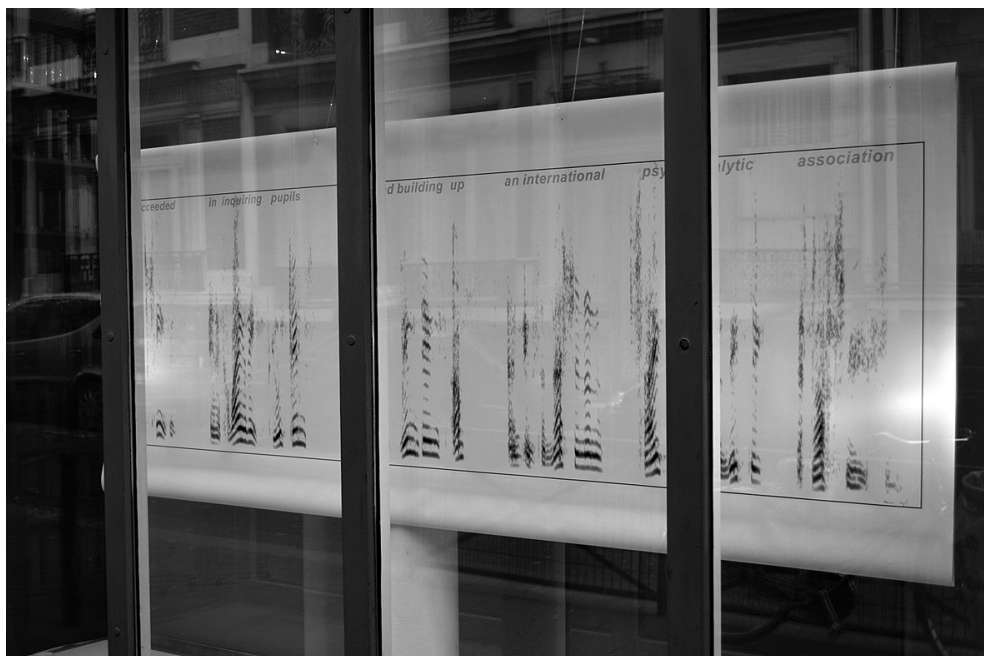
Figure 1 – “Lire Freud... Ecouter Freud – La voix de Sigmund Freud réinterprétée”. Vitrine de la Bibliothèque Sigmund Freud, 2011, Paris, France.

images et des associations. Dans la dernière partie, la voix s’est épurée jusqu’à ne plus devenir qu’un unique instrument dont la prosodie reste celle de Freud et dont la matérialité a donné naissance à une musique et à une poésie minimaliste.