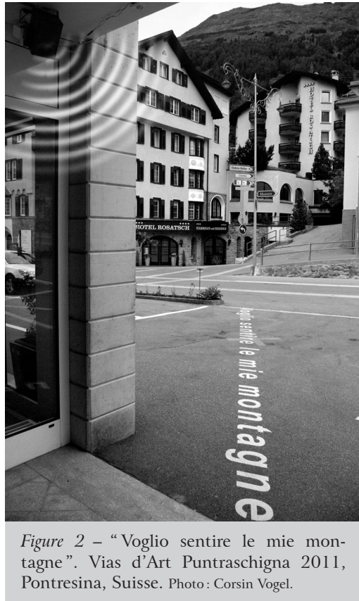
Figure 2 – “Voglio sentire la mie montagna”. Vias d'Art Puntraschigna 2011, Pontresina, Suisse.

Contrairement à certaines installations de l'artiste américain Bill Fontana et à ses diffusions sonores transposées dans d'autres lieux (Moore 2010), il ne s'agit pas ici de diffuser des ambiances des pâturages alpins en temps réel dans la ville, mais plutôt de reconstituer une forme sonore qui évoque un passé acoustique et réactive les représentations en mémoire des visiteurs. En effet, les sources sonores présentées ont disparu du paysage local depuis plusieurs décennies.