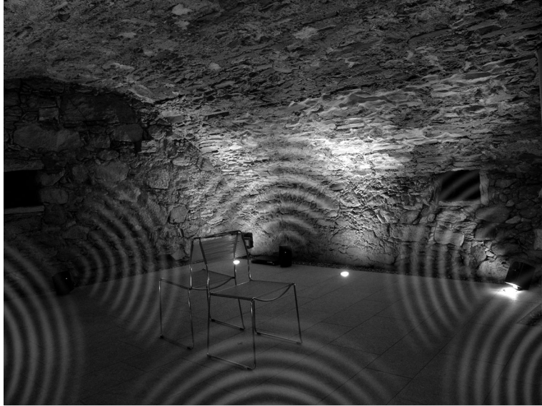
Figure 5 – “Schamser Klangskulptur”. 555 Ons Val Schons, 2010, Zillis, Suisse.