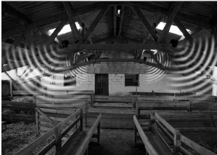
Figure 4 – “Hors-Champs”. Troisième cycle d’art contemporain, 2011, Vernand, France.