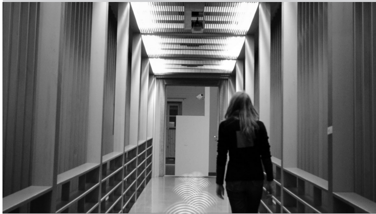
Figure 6 – “Wandelgang”. Musée d’Art des Grisons, 2011, Coire, Suisse.