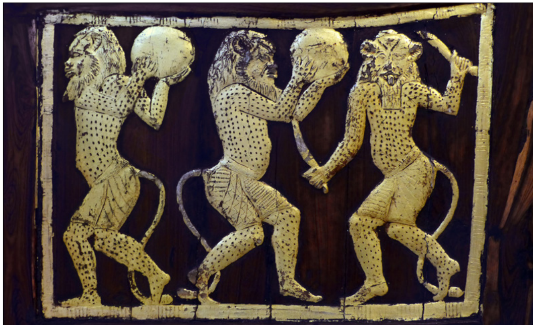
11. Trois représentations de Bès sur le trône de la princesse Satamon, fille d'Amenhotep III et de Tiye (XVIII e dynastie), musée égyptien du Caire.