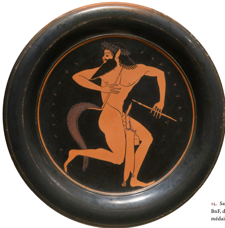
15. Satyre d'Epicète, BnF, département des monnaies, médailles et antiques.

l'Égypte dure longtemps 46 regards croisés sur la réception de la civilisation pharaonique