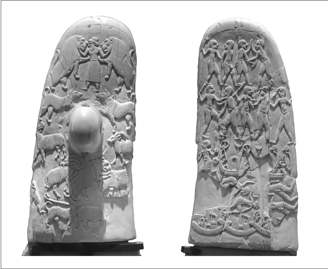
5. Couteau du Gebel el-Araq, musée du Louvre.