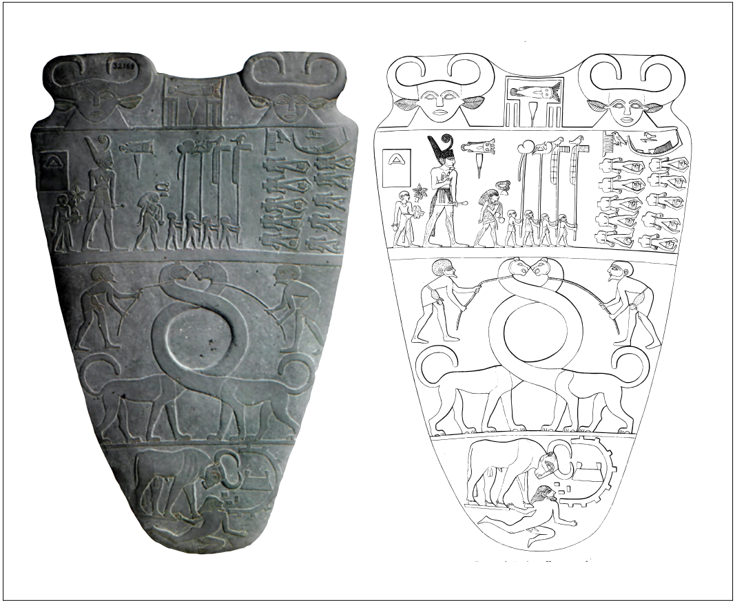
3. Palette de Narmer, musée égyptien du Caire.

regards croisés sur la réception de la civilisation pharaonique