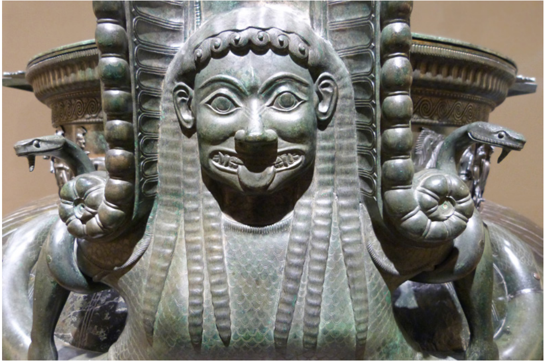
14. Représentation de Gorgone sur le vase de Vix.

l'Égypte dure longtemps 46 regards croisés sur la réception de la civilisation pharaonique