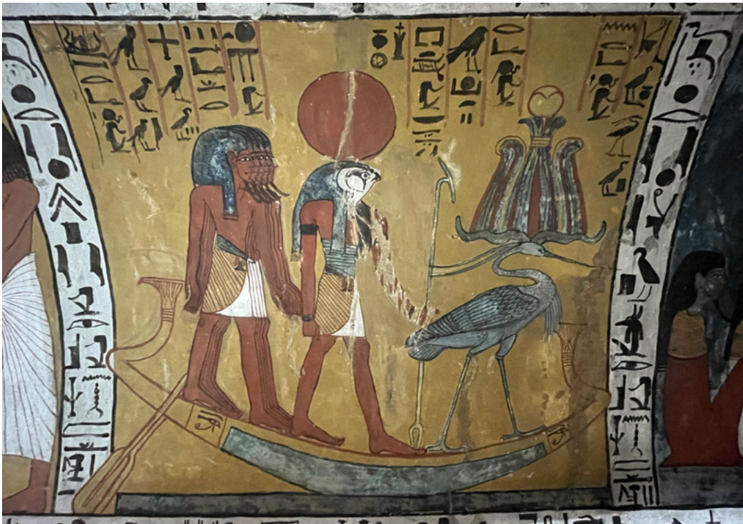
2. Bénou de la tombe de Sennedjem à Thèbes; voir également fig. 12, p. 44.

31 hybridations, intertextualité et intericonicité