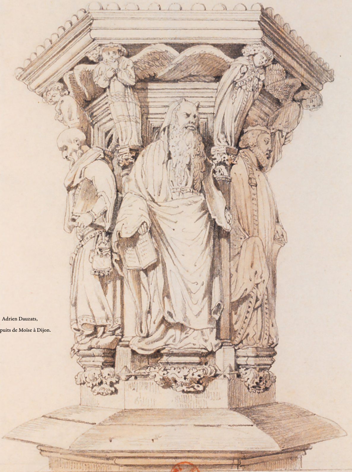
9. Adrien Dauzats, le puits de Moïse à Dijon.