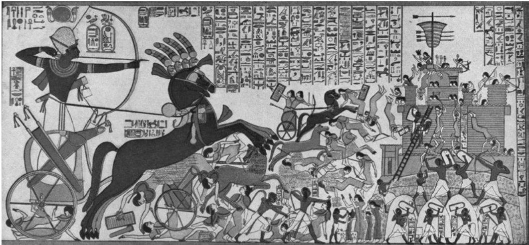
6. Prise de Dapur, relevé d'après le relief du Ramesseum.