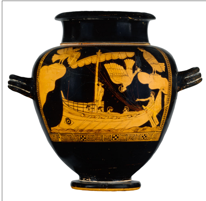
13. Stamnos représentant Ulysse et les sirènes, British Museum.