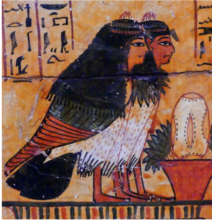
12. Le ba de Sennédjem et celui de son épouse Inéferti, peints sur le cercueil extérieur de Sennédjem (TT1) XIX e dynastie, musée égyptien du Caire ; voir également fig. 2, p. 30.