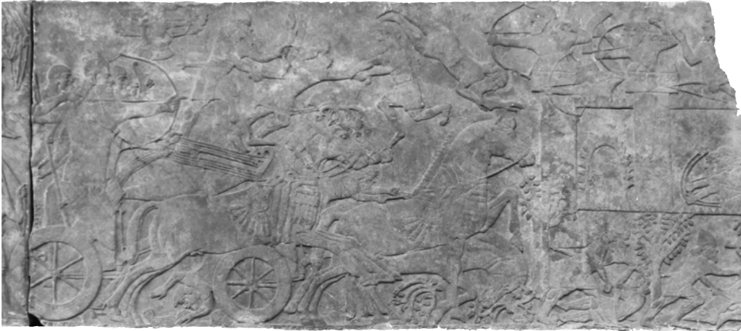
7. Bas-relief de la bataille d'Assurnasirpal II, British Museum.