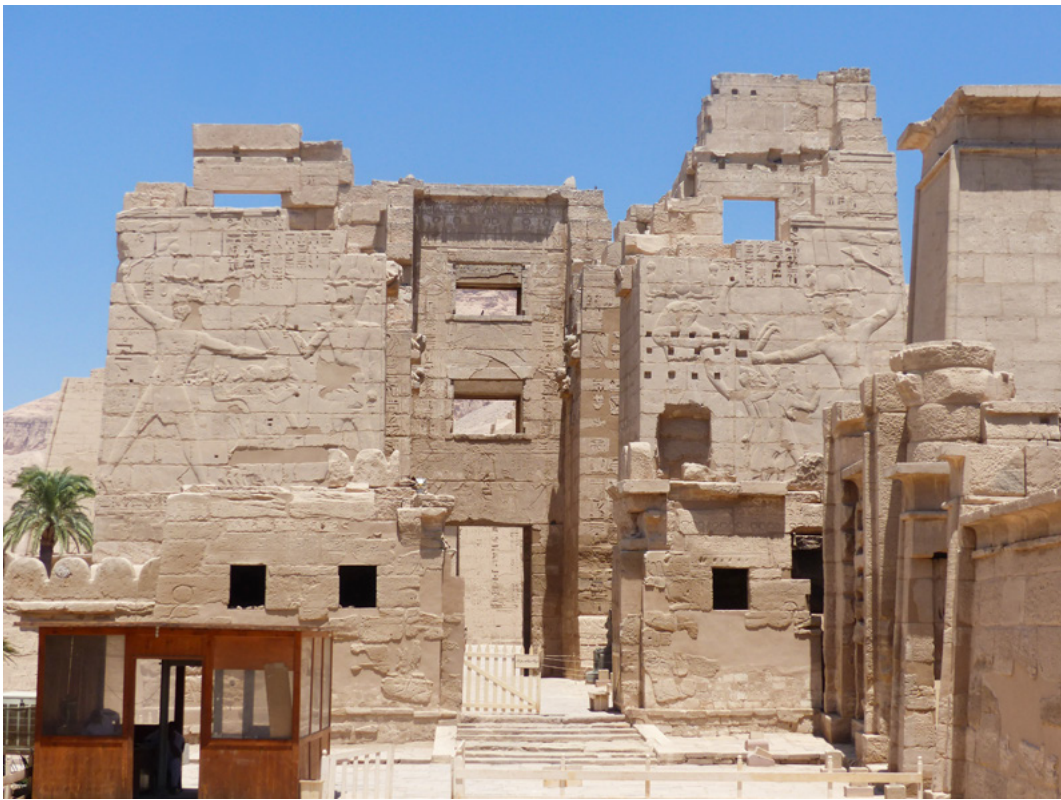
8. Migdol de Médinet Habou.