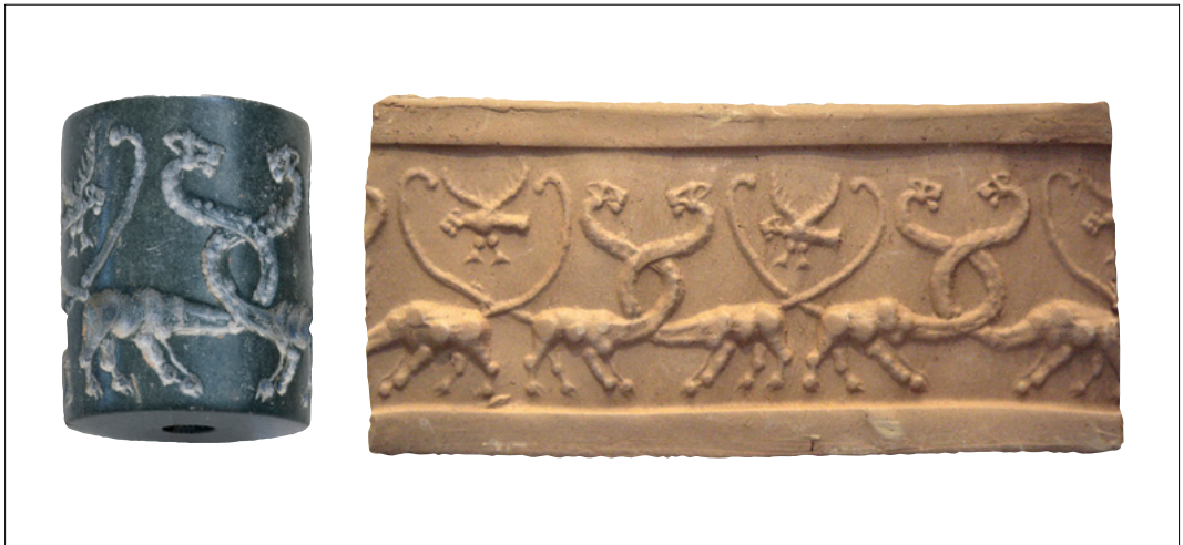
4. Sceau-cylindre d'Uruk, musée du Louvre.