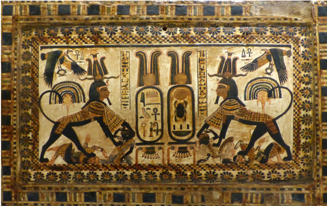
1. Sphinx sur une boîte de Toutânkhamon, musée égyptien du Caire.