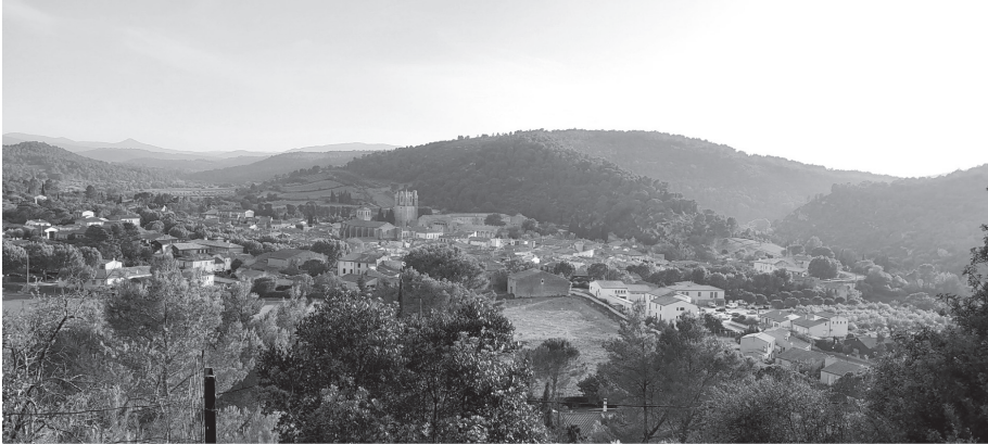
Figure 1 : Le village de Lagrasse (auteure, mai 2023).

dans les Corbières à 40 kilomètres de Narbonne et de Carcassonne, l'Observatoire des territoires français la classe parmi le « rural autonome peu dense », les « ruralités touristiques à dominante résidentielle », et du point de vue des transitions agro-écologiques, comme « système à forte valeur naturelle et agricole ». Elle est en outre identifiée Zone de revitalisation rurale, une catégorisation qui concerne les espaces présentant des difficultés économiques et sociales comme une faible densité démographique, un déclin de la population totale ou active, et/ou une forte proportion d'emplois agricoles.