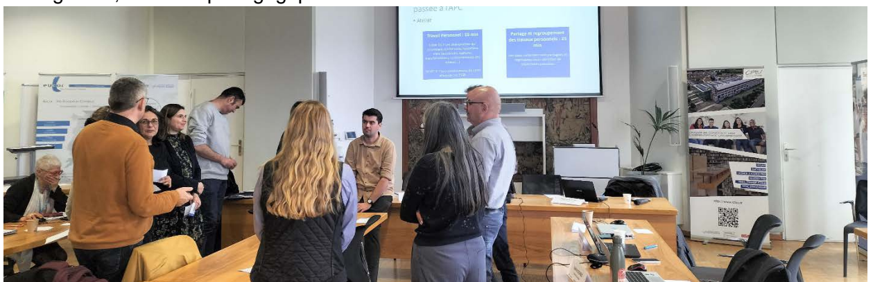
Figure 3 : ateliers participatifs

Distinction compétences entre pédagogie / certificative. GE ne parle pas pédagogie avec les enseignants, cf liberté pédagogique