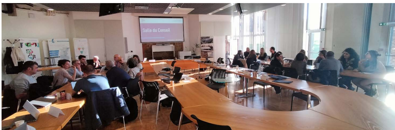
Figure 1 : ateliers participatifs