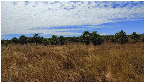
Photo 3 Pâturage à Kapahazo (village à l'intérieur des terres à Antrema)