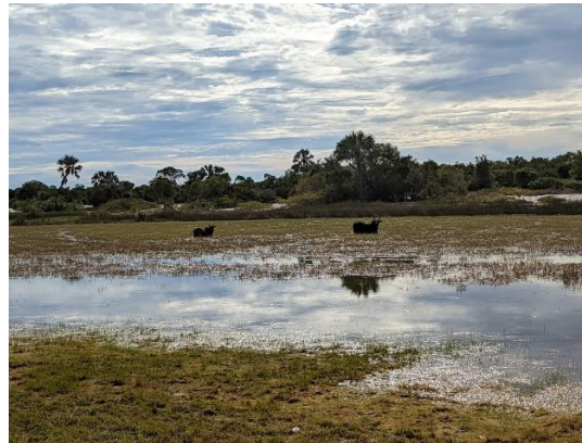
Ambanjabe, Boeny, Madagascar.

Relevé des pratiques sur les herbes et les feux, par facette de paysage et par système d'élevage, dans deux pâturages de la Région Boeny