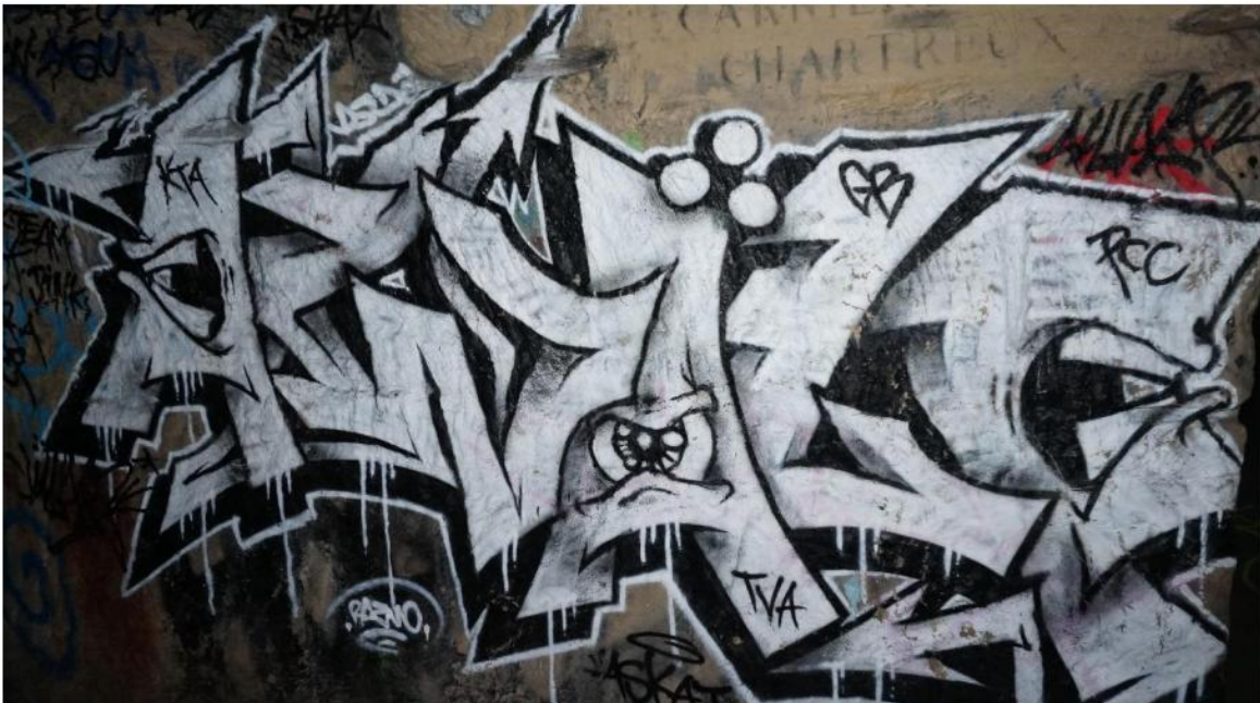
Figure 3 - graffiti photographié dans les catacombes le 28 mai 2020

Becker nous permet d'attribuer quelques éléments fondamentaux à ces conventions. Premièrement, elles sont généralisées dans tous les mondes artistiques, le graffiti souterrain ne devrait donc ne pas en être exempt. Deuxièmement, elles permettent la mise en place d'une coopération entre les pratiquant-e-s, c'est-à-dire qu'elles coordonnent une action socialement organisée. Troisièmement, elles ne sont pas créées ex nihilo , mais s'ancrent dans l'histoire artistique et sociale du monde qu'elles régissent. Enfin, grâce à ces normes les frontières du cercle des praticiens sont esquissées. Ces quatre éléments relatifs aux normes artistiques sont-ils présents pour le graffiti dans les catacombes ?