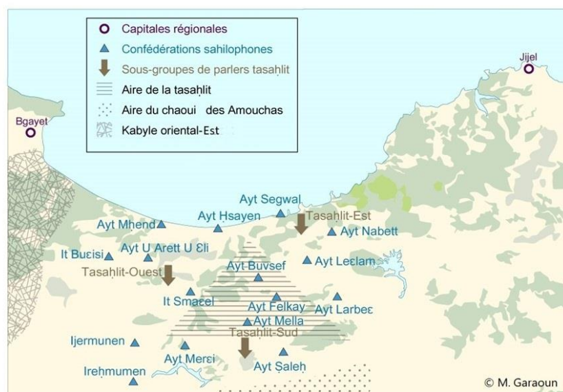
Figure 3 : classification des parlers des confédérations tasahlitophones