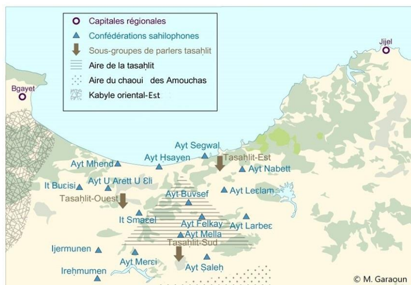
Figure 3 : classification des parlers des confédérations tasahlitophones