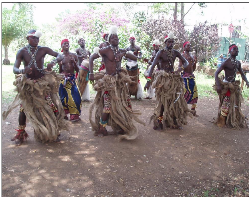
Danseurs groupe Mâ-Nkoussou