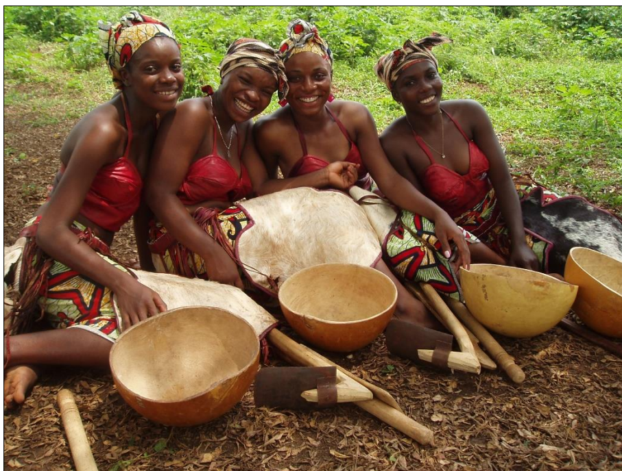
Danseuses-chanteuses, groupe Kalangou, Yaoundé photo : Apollinaire ANAKESA Les photos qui suivent sont du même auteur.

Musique du monde : Un voyage musical au pays du Cameroun , CD + DVD, CD 3709926, collection Musique du Monde, BUDA Musique, 2012. Notice bilingue (français-anglais), 27 p. + un PDF 3109926 de 30 p. avec illustrations.