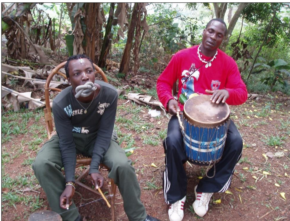
Joueurs d'arc musical, d'une flûte de tuyau récupéré d'une machine à linge.

Il en est ainsi, par exemple, des membres de la Compagnie Mâ-Nkoussou. Ce groupe est constitué de jeunes artistes dynamiques et motivés qui, par leur exceptionnel jeu des percussions traditionnelles et celles de leur propre invention (dont l'arc musical milonga ), ainsi que par leurs mélodies et leurs agiles chorégraphies promeuvent tant leur culture initiale que celle d'autres peuples africains. En véritable musicien-conteur, Adjeng Etaba, s'inscrit dans la tradition, en se tournant toutefois vers l'avenir. En effet, « l'homme mvét » construit lui-même sa harpe-cithare mvét glossaire , à cinq cordes, dont il s'accompagne par des jeux subtils, chantant la vie et les épopées.