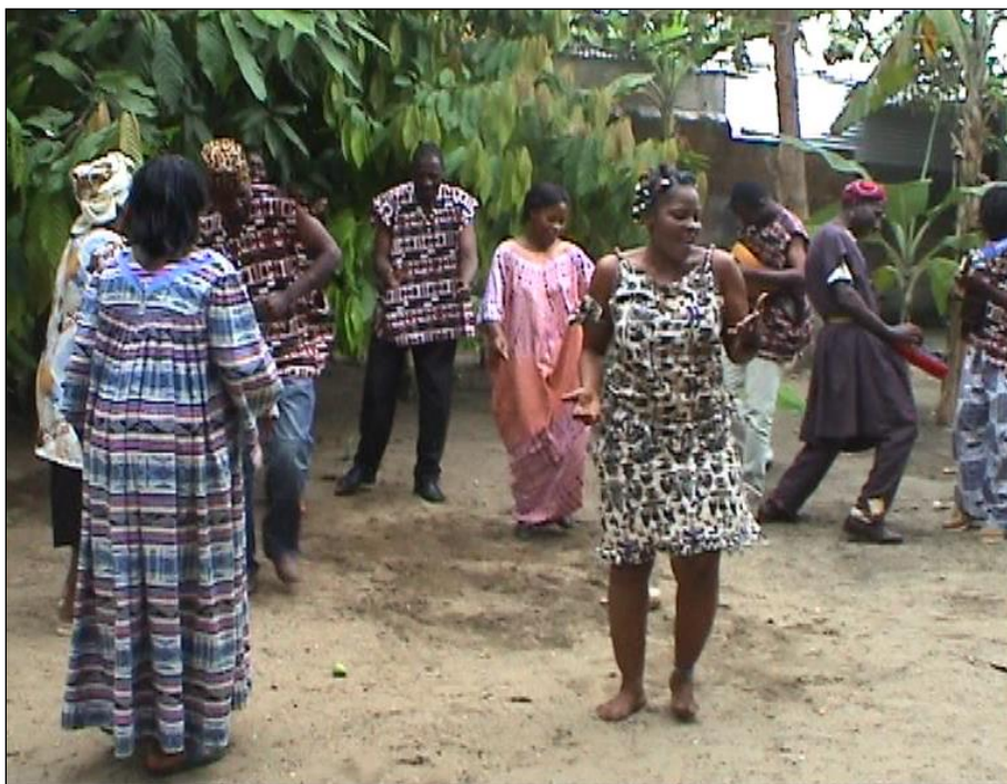
Groupe West Songs