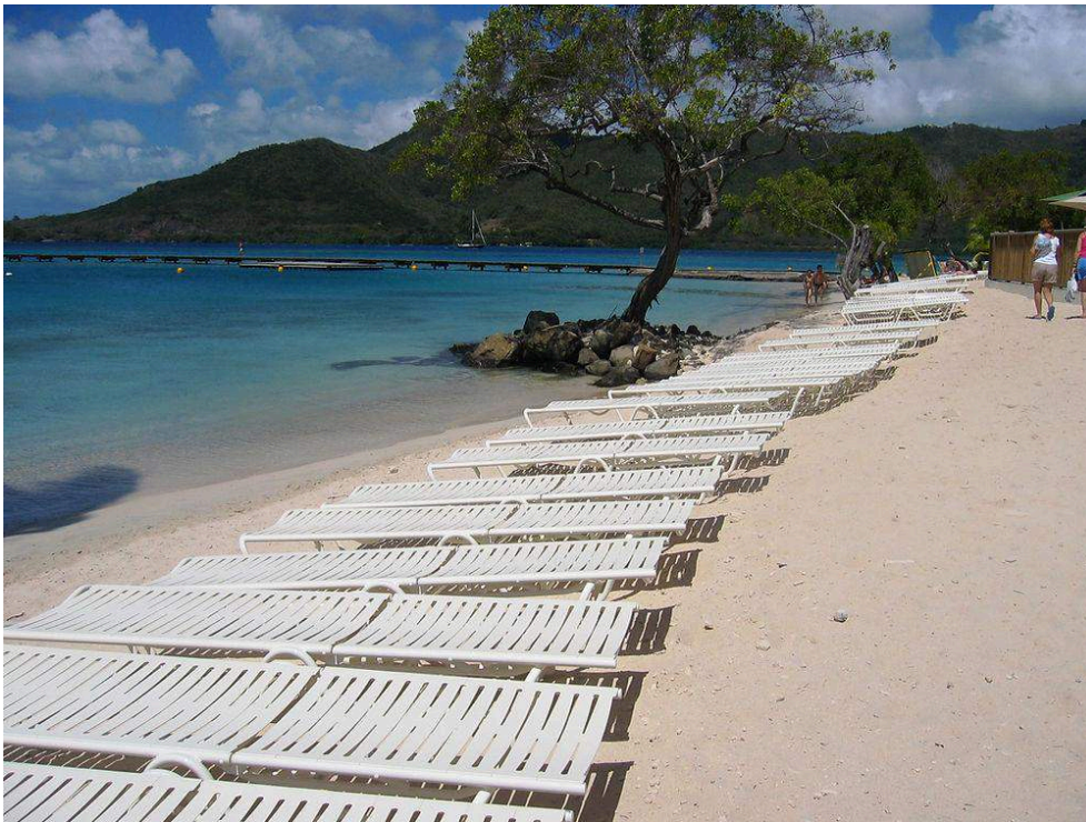
Photographie 3. Lorsque la plage est publique : la réservation de l'espace grâce à la disposition de transats privés. La méthode Club-Med en Martinique (2014)

Le complexe touristique protège ses abords en disposant ses transats aux premières heures du matin sur la plage de Sainte-Anne. Les transats sont privés et ne peuvent donc pas être bougés par les populations qui ne sont pas les clients du Club-Med. L'objectif est d'installer une zone de no-man's land entre le Club-Med et la partie de la plage fréquentée par la population locale.