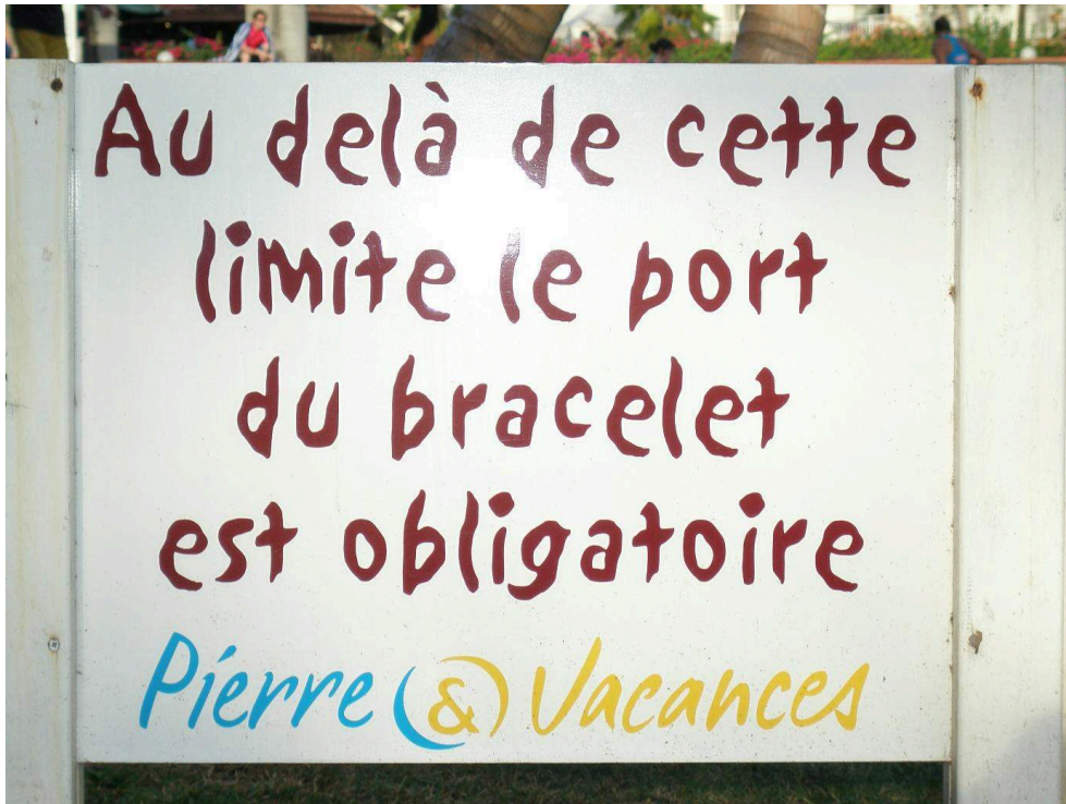
Photographie 2. « Au-delà de cette limite le port du bracelet est obligatoire ». Pierre et Vacances en 2007 (Martinique) 1

En 2007, le club de vacances décide de « sécuriser » son territoire et de s'assurer que les autochtones ne puissent plus utiliser ses aménagements aux abords du littoral.