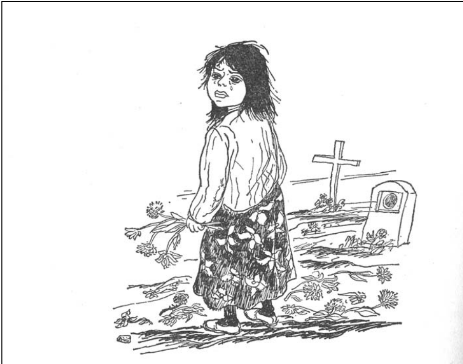
Illustration : Bettina Truninger, Die Siebente Tochter , Flamborg Verlag, 1969

Leur peau avait la couleur de la boue. Leur cœur avait la douleur du monde. Leur âme avait la douceur de la neige. Leur force avait la hauteur de la montagne. Leurs yeux avaient le bonheur des étoiles.