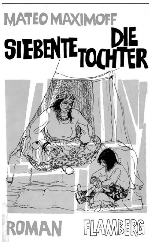
Illustration : Bettina Truninger, Die Siebente Tochter , Flamberg Verlag, 1969

Parmi les coutumes que Maximoff porte à la connaissance de son lectorat, on peut relever un point très intéressant parmi d'autres : la place des femmes dans les familles qui sont mises en scène. Comme souvent dans les familles tsiganes, les femmes chez Maximoff ont une place hautement déterminée et codée, et aucunement émancipée : leurs initiatives, limitées, se cantonnent à la cellule familiale restreinte. Au fil de ses romans, Maximoff oscille entre la présentation de ces coutumes et une certaine remise en question. D'un côté on peut lire que « maintenant qu'elle était sa femme, elle acceptait tout à fait d'être l'esclave exclusive de son seul et unique amour. Désormais elle ne