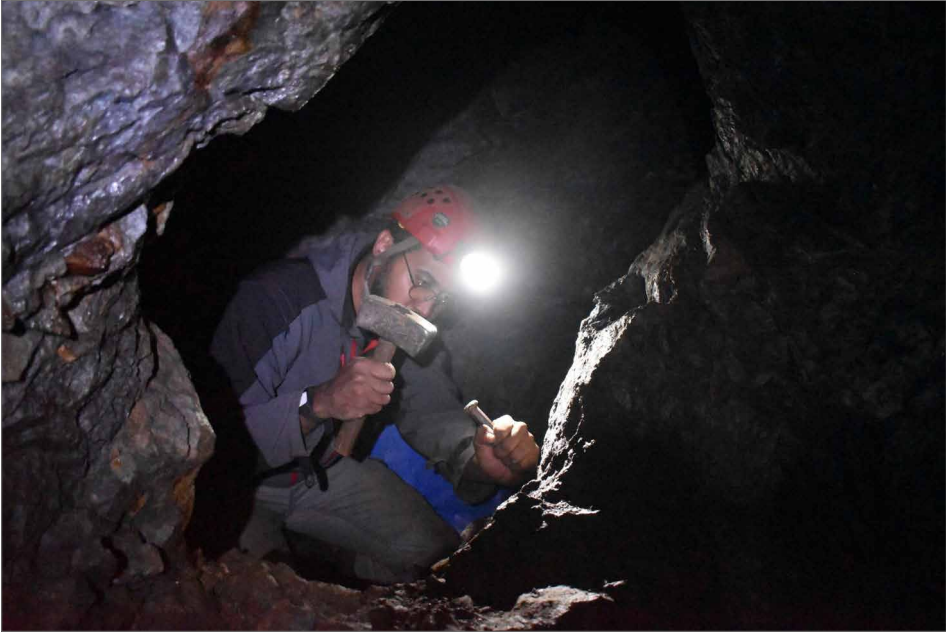
Figure 3. Mining with tools on a shale working face in the Lauqueille mine.

Obr. 3. Těžba s použitím nástrojů na břidlicovém povrchu v dole Lauqueille.