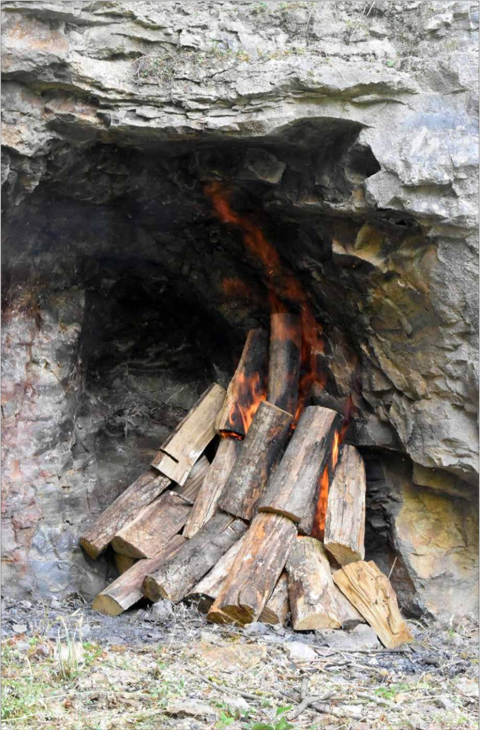
Figure 5. Pyre mounted on the working face.