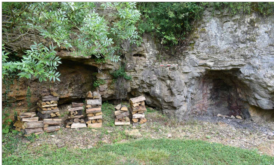
Figure 4. Experimental site for firesetting.

In this protocol there were two miner-experimenters. One carried out the first trial (Melle 1), and the second the other two trials (Melle 2 and Melle 3). Both were men who played sport and had some experience of mining at the Melle site. One of the experimenters, experimenter 1, carried out one of the fire tests and the two tool tests to ensure consistency in the measurements.