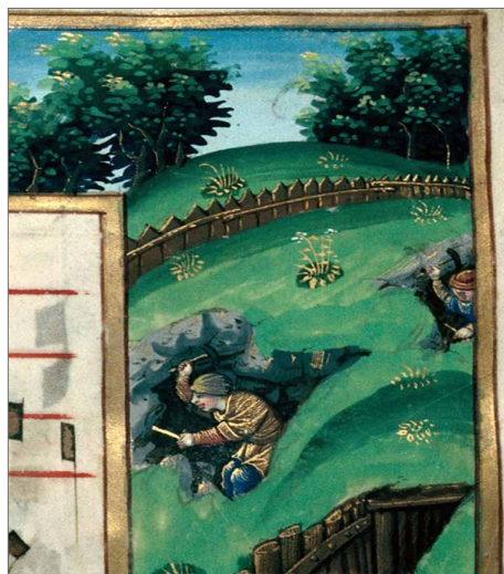
Figure 1. Illustration of mining with a hammer and a handle chisel. After Graduel de Saint-Dié 1510.

and handle chisel pair. The miner would place the handle chisel, on the wall and strike it with a hammer. This method is described in De Re Metallica (Agricola 1556) and is often depicted in ancient iconography (Kutnohorská iluminace 1490; Graduel de Saint-Dié 1510; La rouge myne de Saint Nicolas 1525; Fig. 1). This pair of tools remains the most traditional symbol of the miners. Archaeological evidence of its use can be seen in the characteristic traces visible in certain galleries, or in the handle chisel found on mining sites such as Castel-Minier in Ariège, France (Méaudre, in press). It is rare to find miners' hammers due to the pragmatic reason that a miner would use a single hammer for a day's work, compared to a dozen handle chisel. In addition, the types of hammers used by the miners are similar to those used in other areas of metallurgical production. Schnitzler (1990) found some of these hammers in mines, providing insight into their size and weight. This initial mining method relied solely on human labour.