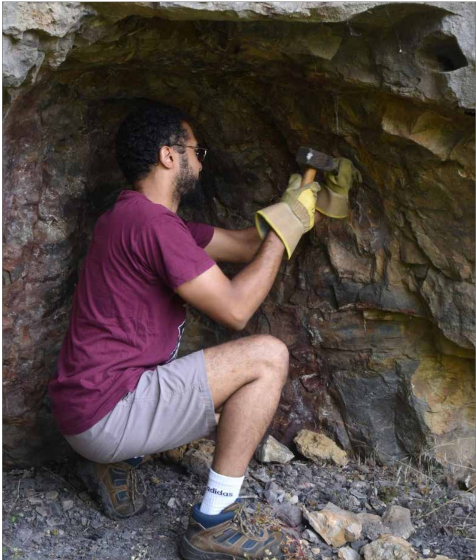
Figure 6. Removing the rock weakened by fire with tools.

Obr. 6. Odstraňování horniny oslabené ohněm pomocí nástrojů.